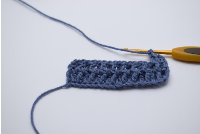
11. 1 vRStb um den nächsten Maschenkörper häkeln.