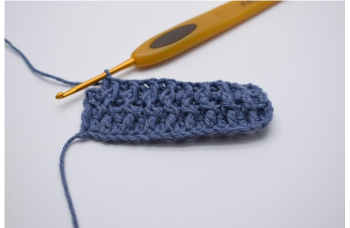
12. Abwechselnd hRStb und vRStb bis Reihenende wiederholen.