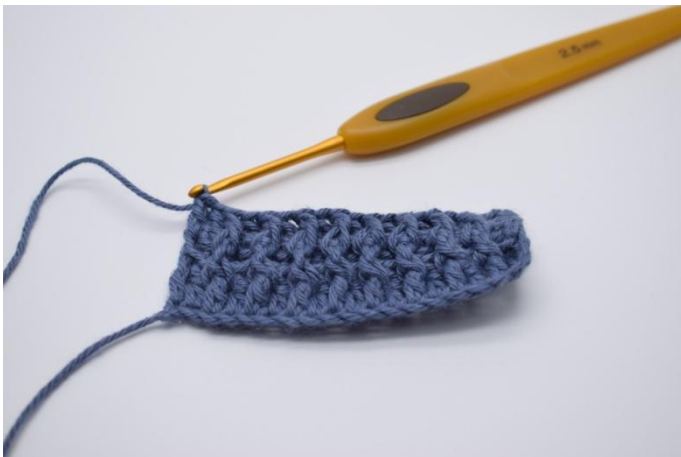
13. In die Wendemasche ein gewöhnliches Stb häkeln. So die Reihen wiederholen, bis du eine passende Größe hast.