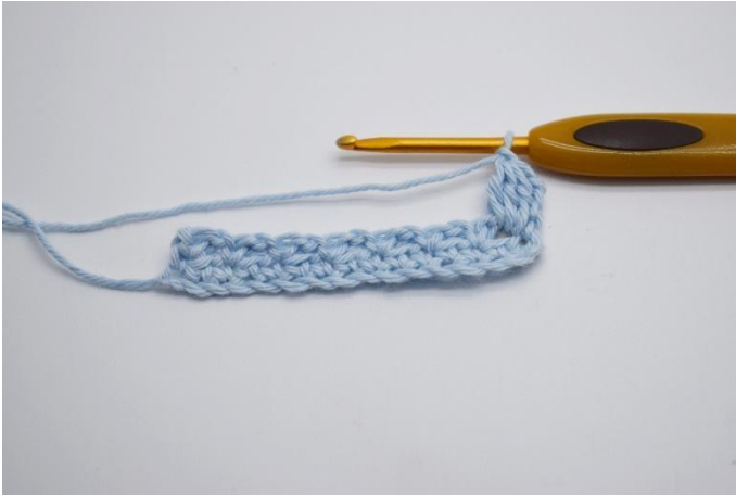
7. Häkel 1 Lm.