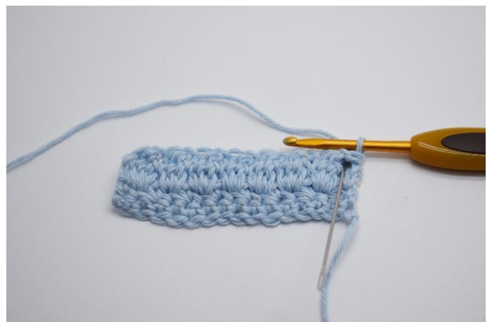
12. Häkel 1 fM in der ersten Masche.