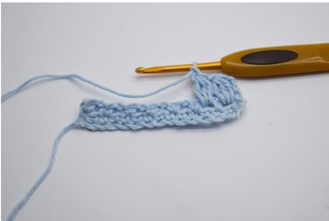
9. Häkel 1 Lm.