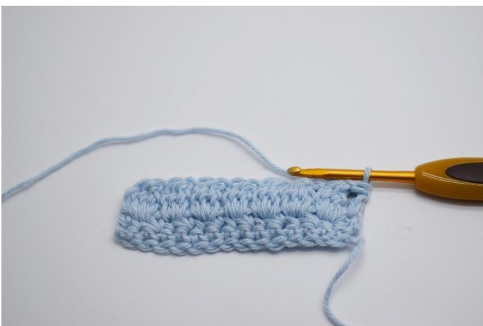
11.Wende die Arbeit mit 1 Lm.