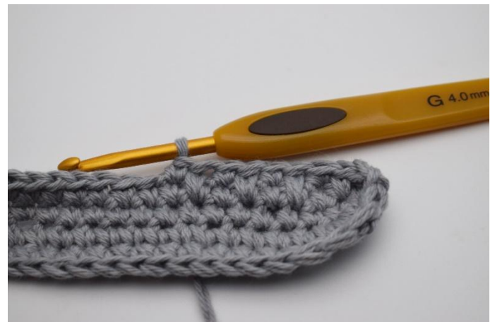
8. So weiter bis Ende der Runde, abwechselnd, und mit 1 Kett-M enden.