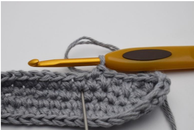
5. Nächste Masche ist wieder eine tfM. Diese wie ein fM häkeln, jedoch eine Masche tiefer einstechen. (Der Einstich für die tfM ist hier mit einer Nadel gezeigt)