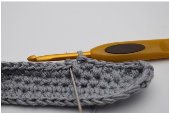
7. Eine fM wie gewöhnlich neben der tfM