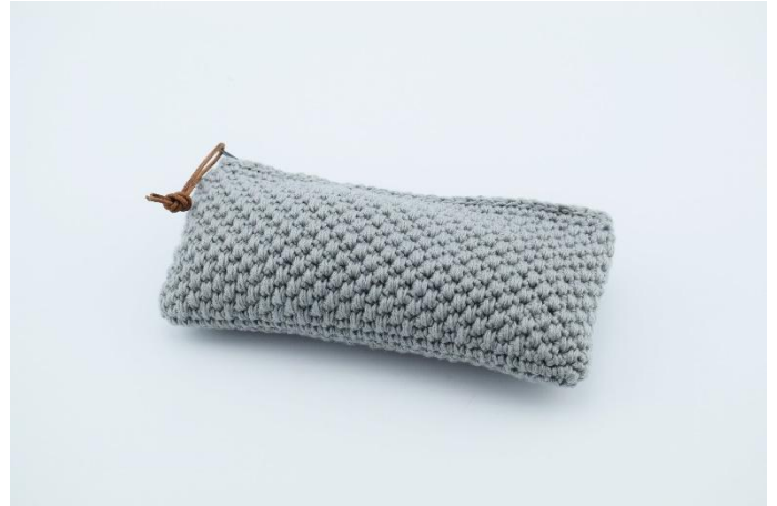
Evtl. mit einer kleinen Lederschnur verzieren.