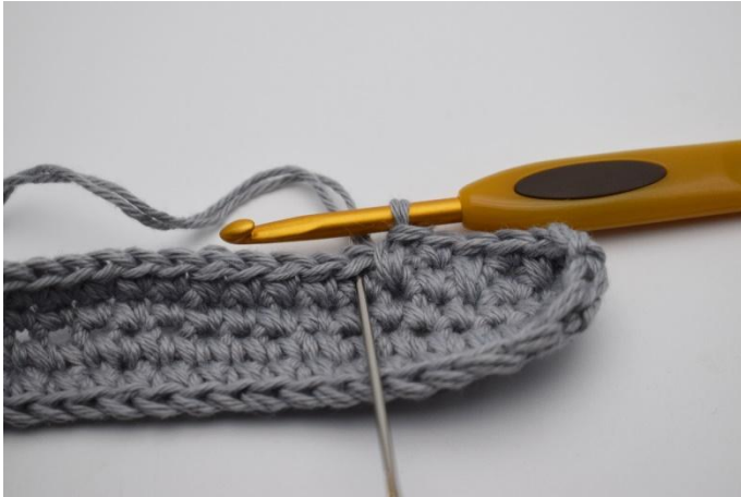
3. Eine fM wie gewöhnlich neben der tfM