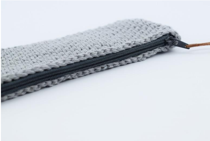
Den Reißverschluss am Rand des Etuis festnähen.