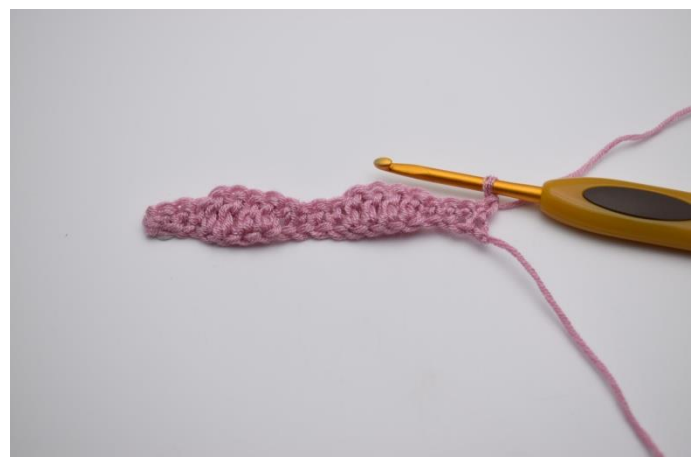
6. 1 Lftm zum Wenden.