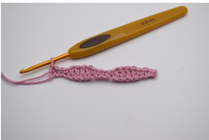
5. "Je 1 fM in die nächsten 4 Lftm, je 1 Stb in die folgenden 4 Lftm, ". Von " bis " wiederholen bis Reihenende und mit je 1 fM in die letzten 4 Maschen enden.