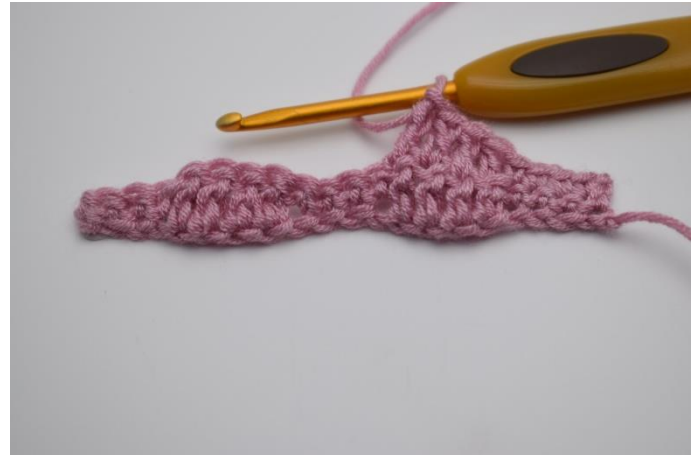
8. Je 1 Stb in die nächsten 4 Maschen.