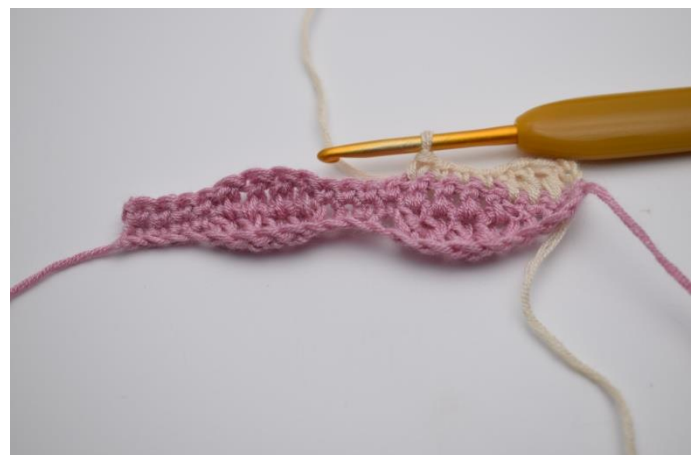
12. Je 1 fM in die folgenden 4 Maschen.