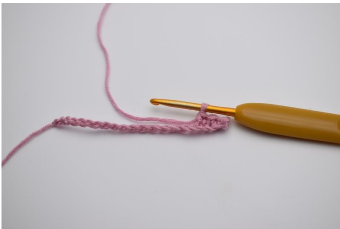
3. Je 1 fM in die nächsten 3 Lftm.