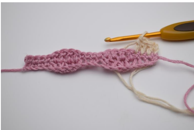
11. Je 1 Stb in die nächsten 3 Maschen.