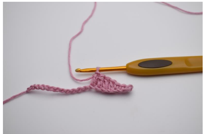
4. Je 1 Stb in die nächsten 4 Lftm.