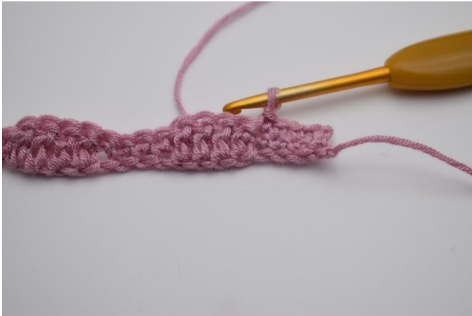
7. Je 1 fM in die nächsten 4 Maschen.