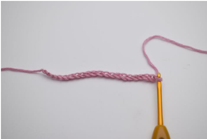
1. Mit der Luftmaschenkette beginnen.