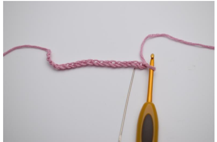
2. Die 2 ersten Lftm übergehen, so dass du die erste Masche in die 3. Lftm ab Nadel häkelst.