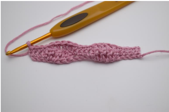
9. "Je 1 fM in die nächsten 4 Maschen, je 1 Stb in die folgen 4 Maschen". Von "bis" wiederholen bis Reihenenden, und mit je 1 fM in die letzten 4 Maschen enden.