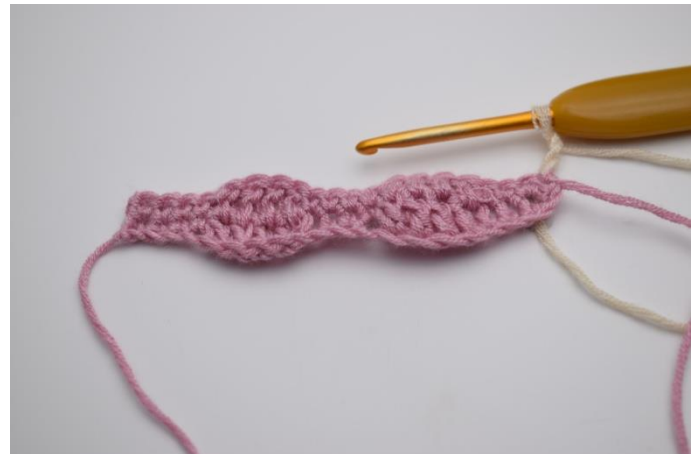
10. Zu Farbe 2 wechseln. 3 Lfm. Diese ersetzen 1. Stb.