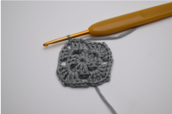
Kett-M bis zum ersten Lftm-Zwischenraum.