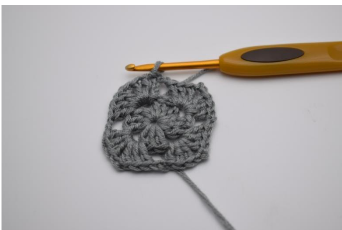
Von „ bis“ bei den nächsten 2 Lftm-Zwischenräumen wiederholen. Mit 1 Kett-M enden.