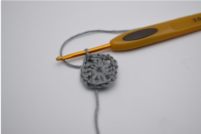
Kett-M bis zum ersten Lftm-Zwischenraum.