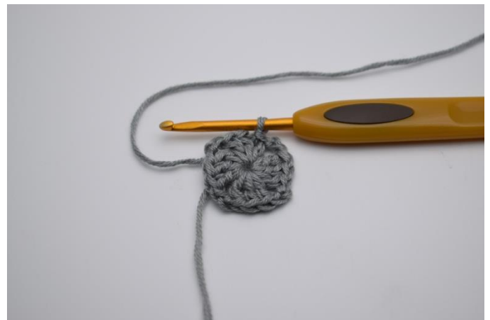
" 3 Stb um den Ring und 2 Lftm". Von " bis " noch 2 mal wiederholen und mit 1 Kett-M enden. Die Schlinge festziehen.