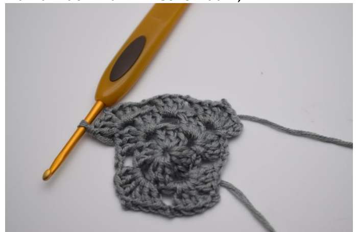
Um jede Ecke in den Lftm-Zwischenraum " 3 Stb, 2 Lftm, 3 Stb, 1 Lftm" häkeln.