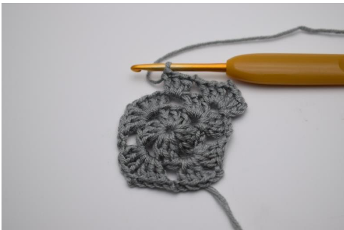
Um jeden Lftm-Zwischenraum an den Seiten 3 Stb und 2 Lftm häkeln