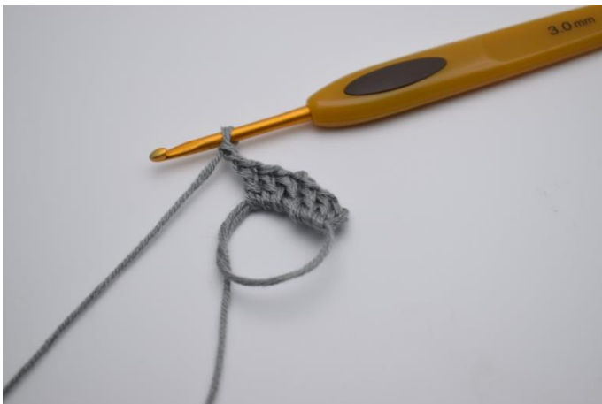
3 Stb um den Ring und 2 Lftm.