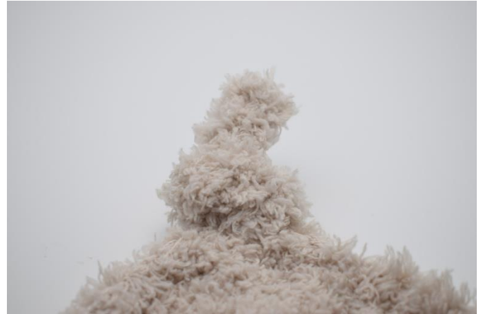
Einen Knoten binden.

Fadenenden vernähen und dein molliger Teppich ist fertig. 😊