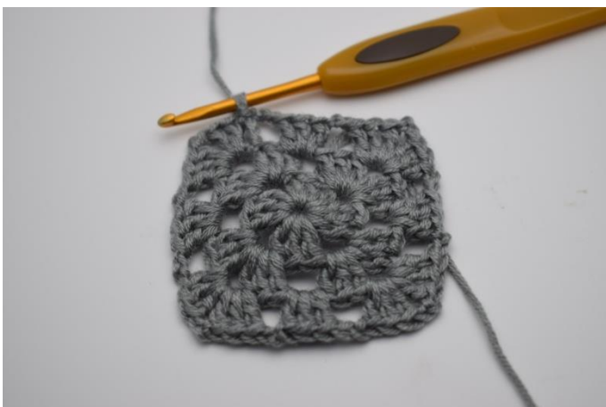
Wiederholen bis Rundenende und mit 1 Kett-M enden.