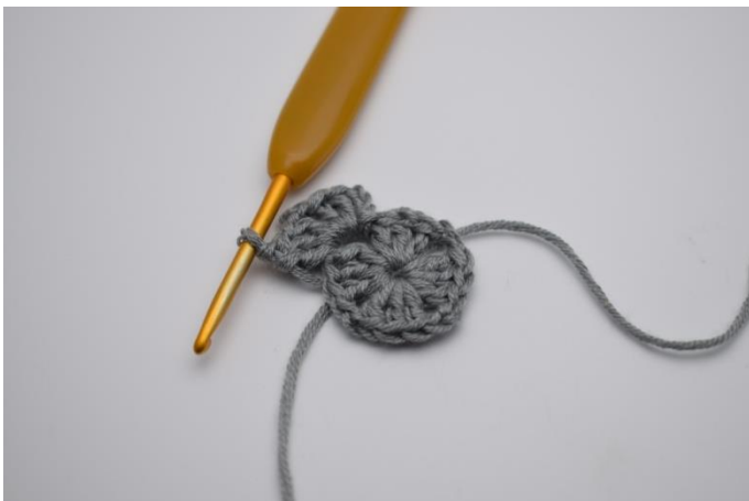
2 Lftm und 3 Stb um den Lftm-Zwischenraum, danach 1 Lftm.