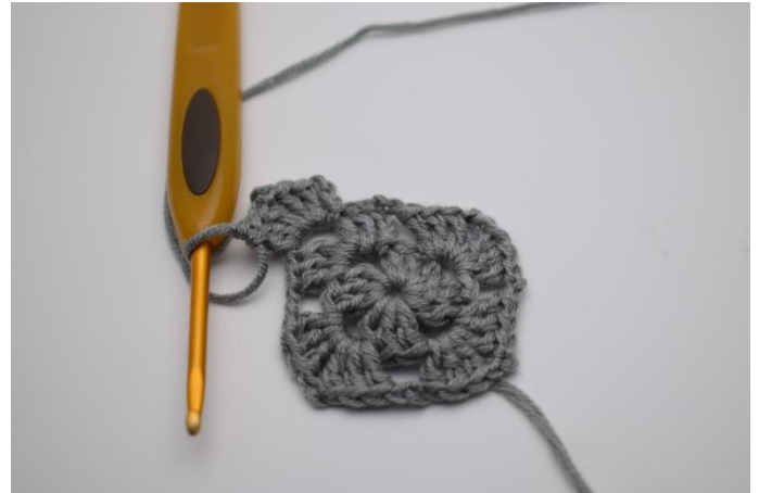
3 Lftm (ersetzen 1. Stb). 2 Stb, 2 Lftm, und 3 Stb um den Lftm-Zwischenraum,