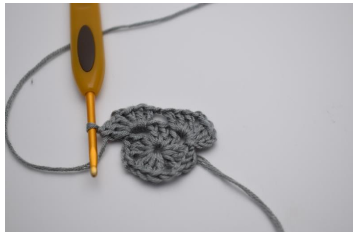
" 3 Stb 2 Lftm, 3 Stb, 1 Lftm" in den nächsten Lftm-Zwischenraum.