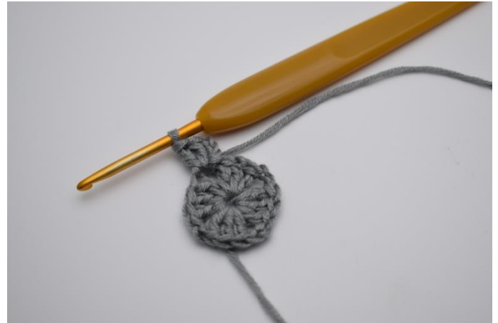
3 Lftm (ersetzen 1. Stb). 2 Stb häkeln.