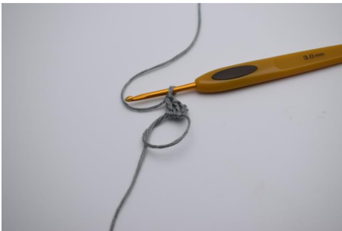
Magischen Ring (Fadenschlinge) herstellen. 3 Lftm (ersetzen 1 Stb). 2 Stb um den Ring.