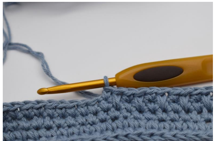
8. Genau so. Dies wird bis Rundenende wiederholt.