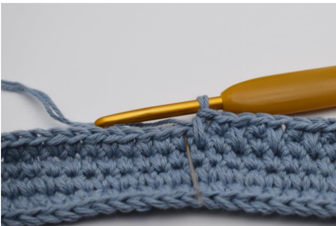
7. Daneben wird 1 fM wie gewohnt gehäkelt.