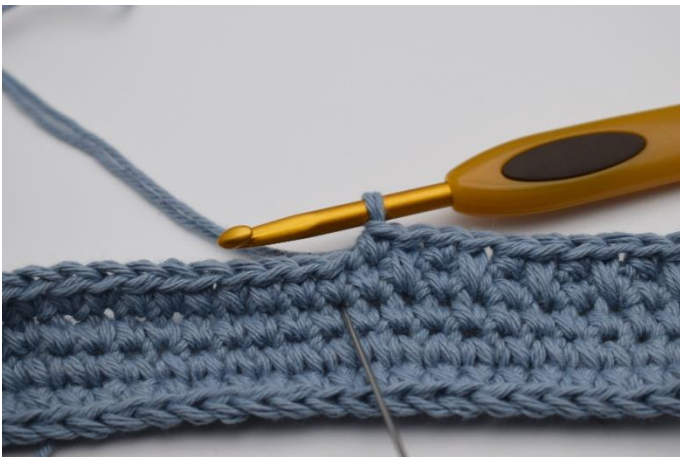
5. Die nächste M ist wieder eine tfM. Die wird wie eine gewöhnliche fM gehäkelt, aber in die tiefergelegene Maschen eingestochen. (Die Nadel markiert hier die Masche, in der die tfM gehäkelt wird)