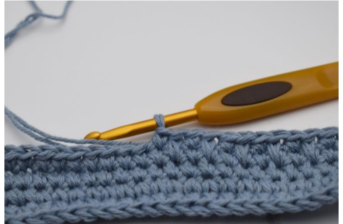
4. Genau so.