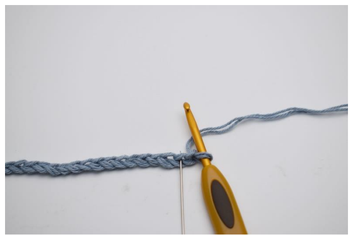
2. In die 2. Lftm ab Häkelnadel (die hier anhand der Nadel markiert wird)