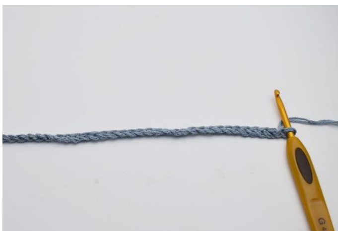
1. Beginne mit dem anschlagen Deiner Lftm-Kette.