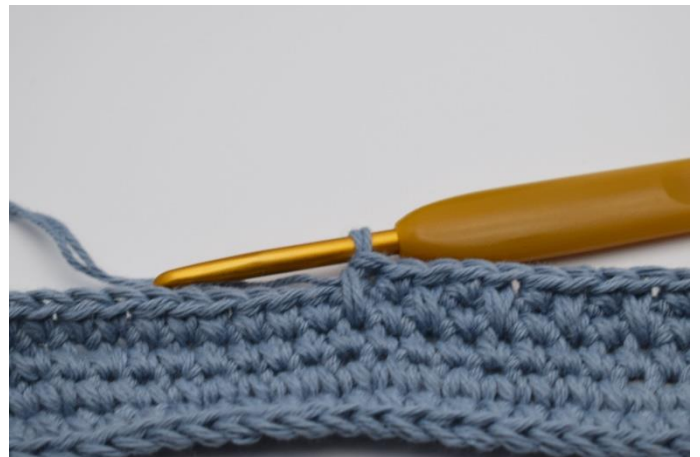
6. Genau so.