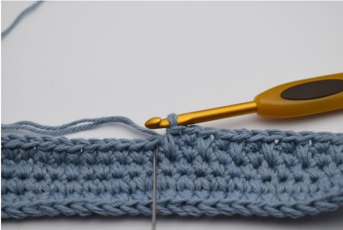
3. Daneben wird 1 fM wie gewohnt gehäkelt.