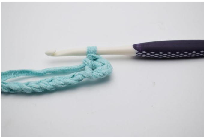
3. 2 fM häkeln