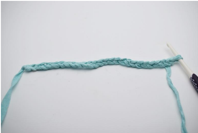
1. Mit einer Luftmaschenkette beginnen.