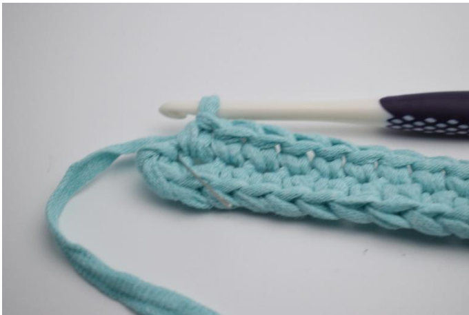
7. In die letzte Lftm (hier mit der Nadel markiert)