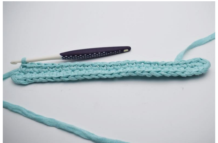
6. Dann an der gegenüberliegenden Seite der Lftm-Reihe häkeln. Je 1 fM in die nächsten 24 Lftm.