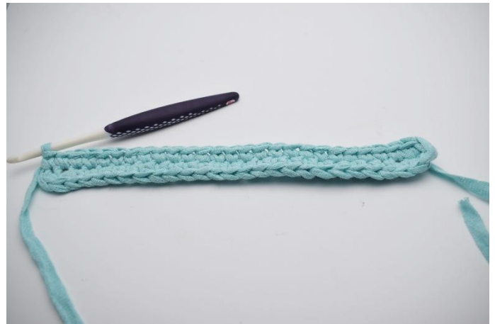
8. 1 fM häkeln(55)