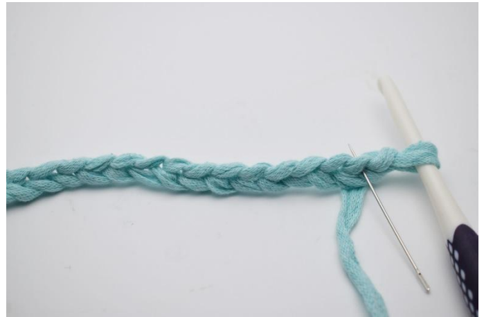
2. In die 2. Lftm ab Nadel (Hier mit der Nadel markiert)