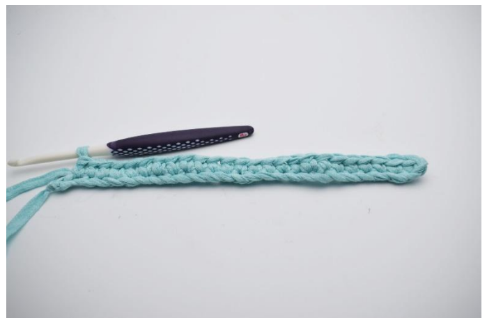
4. 1 fM in die nächsten 24 Lftm.