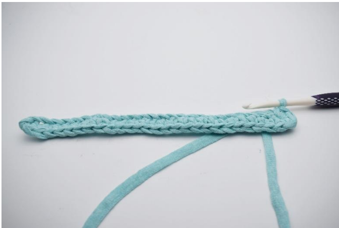
5. In die letzte Lftm 4 fM häkeln.