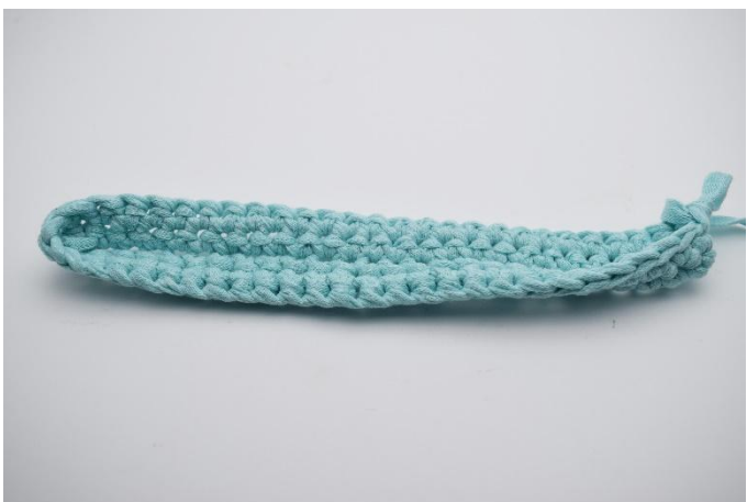
9. 1 Runde fM häkeln.