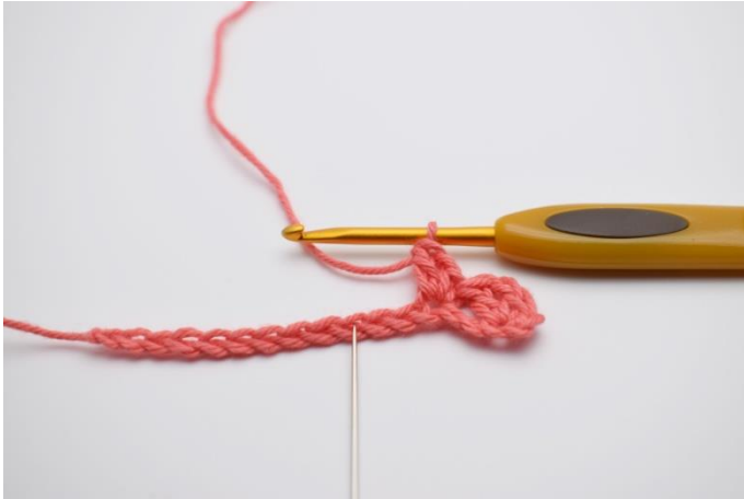
5. 2 Lftm überspringen.