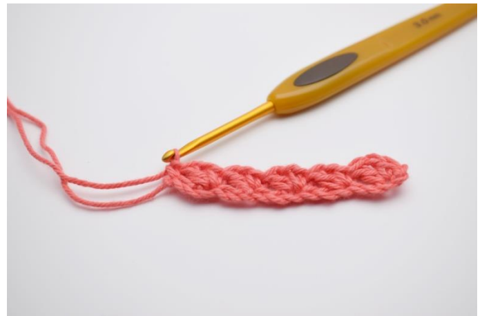
8. 1 fM in die letzte Lftm häkeln.