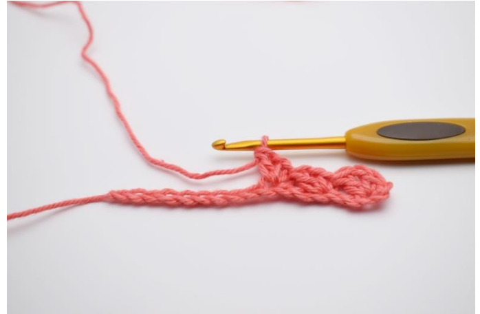
6. "1fM, 1 Lftm, 1 Stb" in die nächste Lftm häkeln.