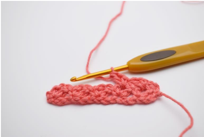
13. "1fM, 1 Lftm, 1 Stb" in den nächsten Lftm-Zwischenraum häkeln.