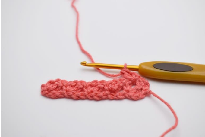
11. "1fM, 1 Lftm, 1 Stb" in den 1. Lftm-Zwischenraum häkeln.