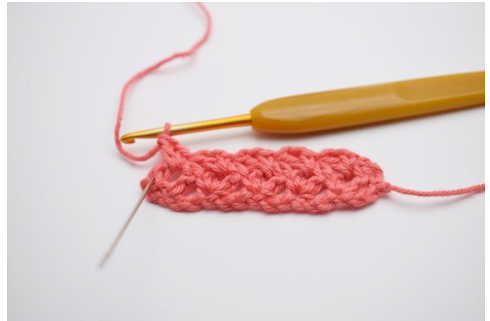
14. Bis Reihenende wiederholen.