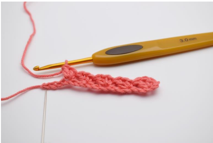
7. Wiederhole " 2 Lftm überspringen, 1 fM, 1 Lftm, 1 Stb in die nächste Masche häkeln" bis zu den letzten 3 Lftm.