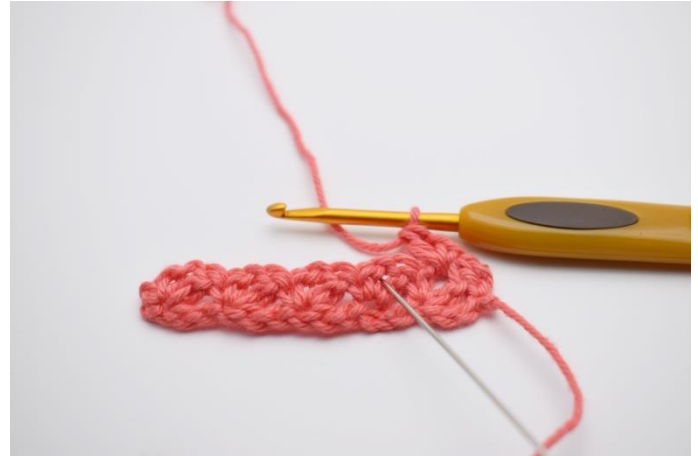
12. Nun zum nächsten Lftm-Zwischenraum springen.