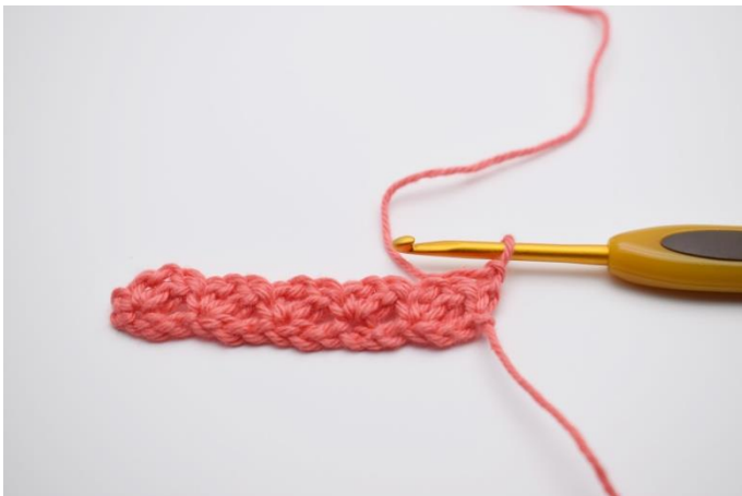
9. 1 Lftm zum Wenden.