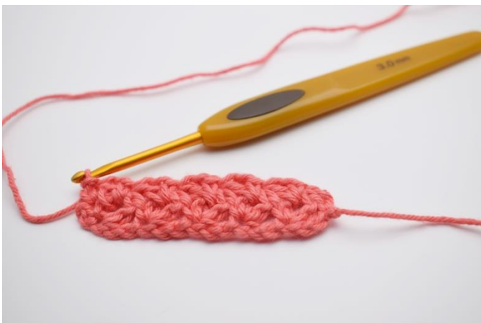
15. 1 fM in die Wendemasche häkeln. Wiederhole nun diese Vorgehensweise bis Dein Spüllappen die gewünschte Größe erreicht hat.