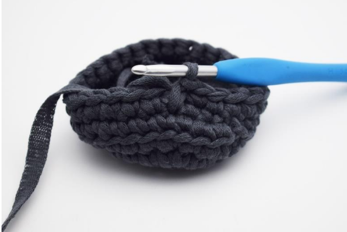
3. Das sieht dann so aus. Nun hast Du die erste tfM gehäkelt.