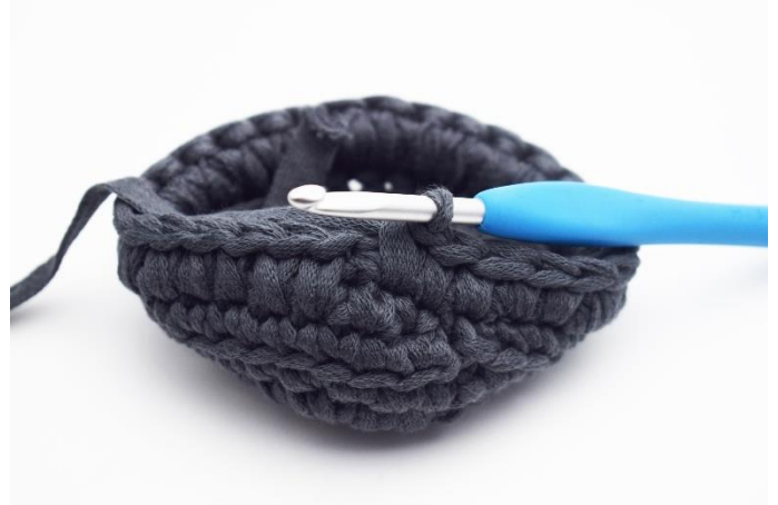
4. Bis Rundenende werden tfM gehäkelt.