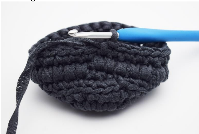
5. 1 Runde mit gewohnten fM häkeln.