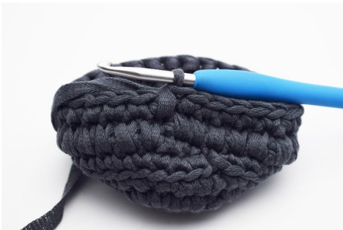
7. Das sieht dann so aus.