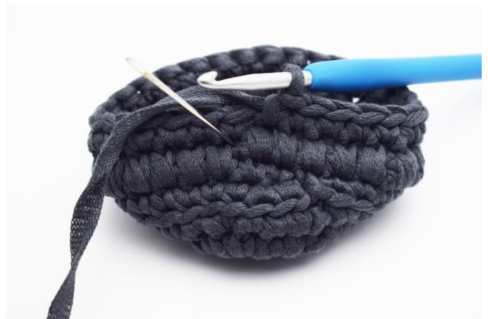
6. Jetzt wird wieder eine Runde mit tfM gehäkelt. Die Nadel markiert hier die Stelle, an der Du die nächste tfM häkeln musst.