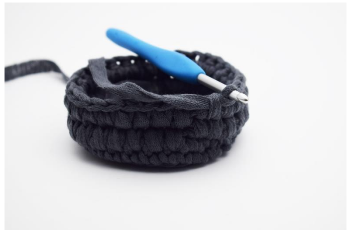
8. Wiederhole dies bis Rundenende.