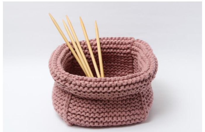
Körbchen mit Umschlagkante