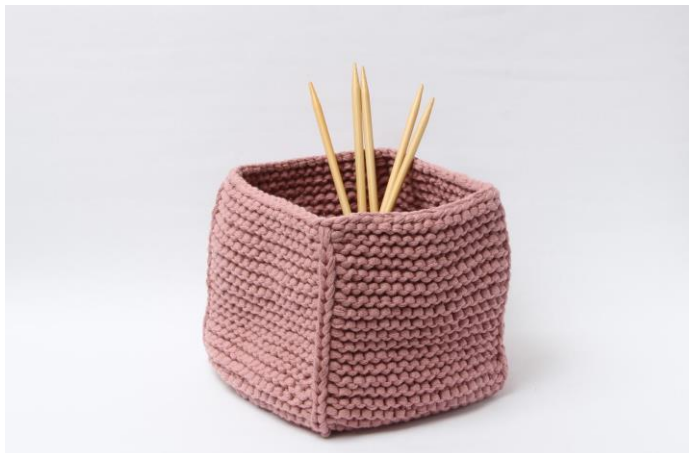
Körbchen ohne Umschlagkante

Die Arbeit nach rechts wenden und die Kante umschlagen.