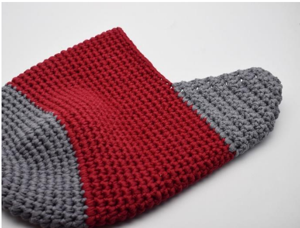
Vend Die Socke wenden.