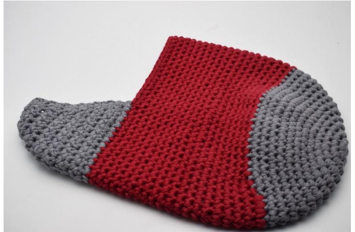
Die Enden auf der linken Seite vernähen. Die Ferse ist jetzt fertig.