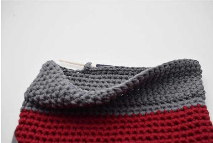
Der Bund ist jetzt fertig gehäkelt.