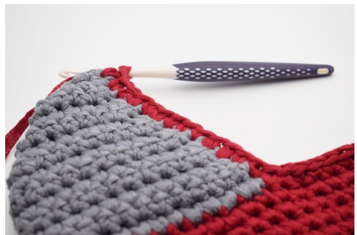
Häkl 14 fM entlang der einen Seite der Ferse