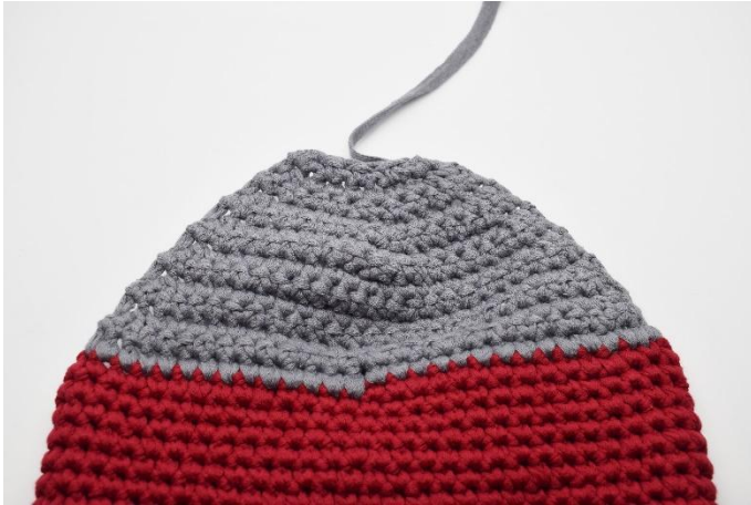
So sieht die Ferse jetzt aus.