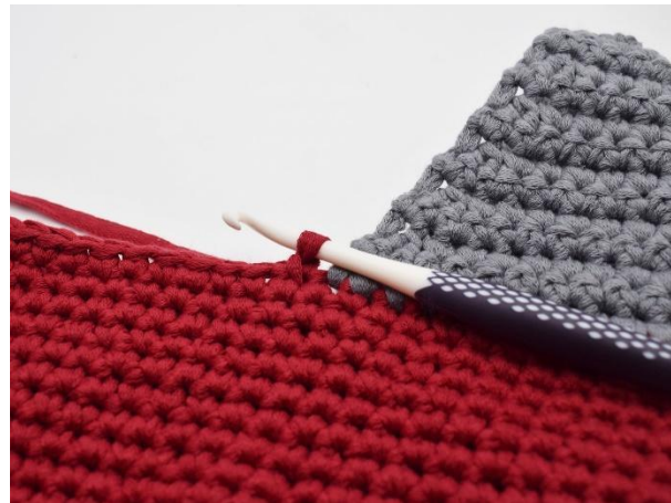
das rote Garn anhäkeln