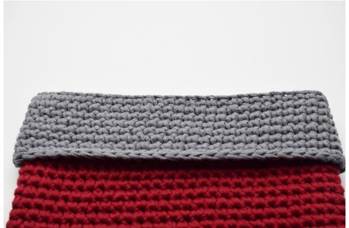
Den Bund nach unten über die Socke umschlagen.