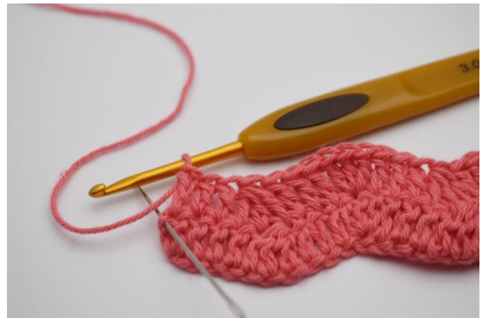
16. 2 Stb in die Wendemasche.