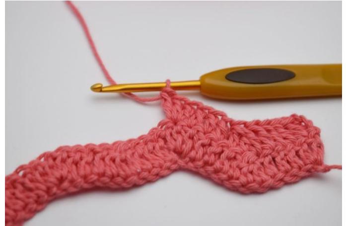
14. In die folgende M 3 Stb in die gleiche M häkeln.