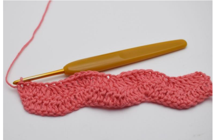
18. Die Reihen auf diese Weise wiederholen..