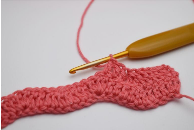
13. Je 1 Stb in die nächsten 3 M.