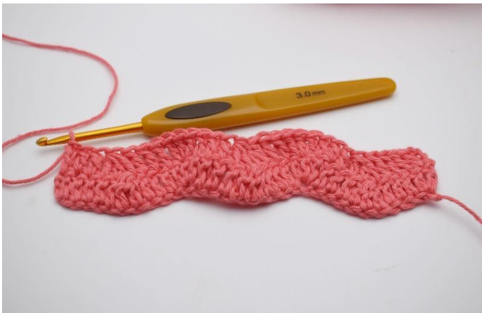
15. "Je 1 Stb in die nächsten 3 Lftm. Dann 3 Stb zusammenhäkeln. Je 1 Stb in die nächsten 3 Lftm, und in die nachfolgende Lftm 3 Stb in die gleiche Lftm." Von "bis" fortlaufend wiederholen, bis nur 4 Lftm zurück sind. Je 1 Stb in die nächsten 3 Lftm.