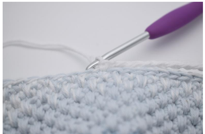
6. und überspringe die 18 Km.