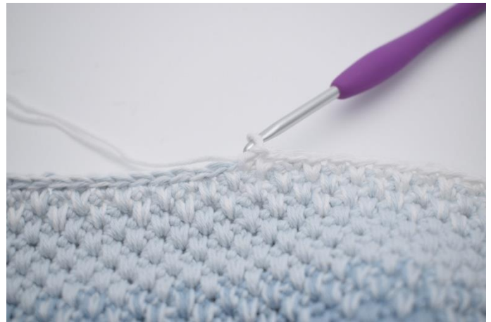
4. Abwechselnd 1 fM und 1 tfM in die nächsten 33 M häkeln. (1 fM in die letzte M häkeln.)