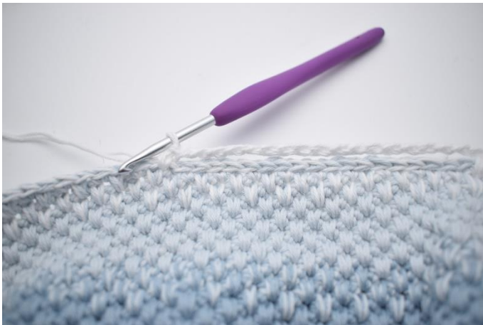
3. Überspringe die 18 Km.