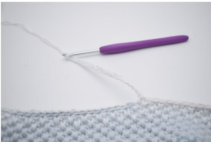
5. Bilde 18 Lftm,