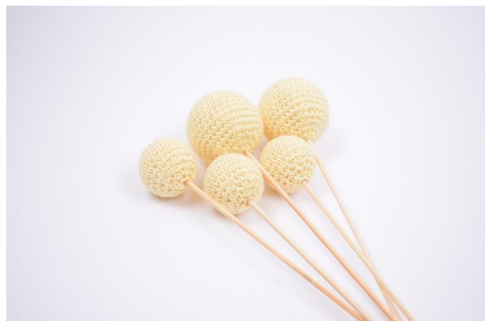
6. Nun kannst Du fleißig Deine Zuhause mit den Osterkugeln dekorieren. 😊