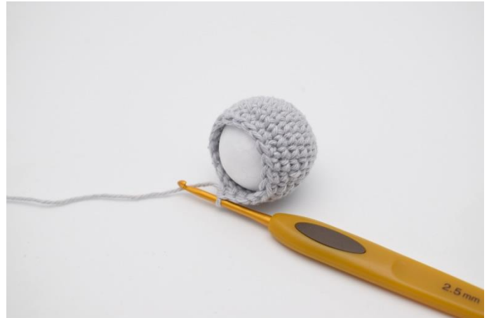
2. wird die Kugel in die Häkelarbeit gesetzt.