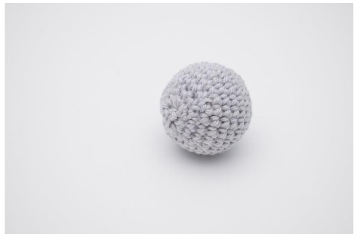
4. Nähe das Loch zusammen und vernähe den Faden.