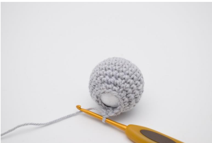
3. Nun wird um die Kugel herum gehäkelt.