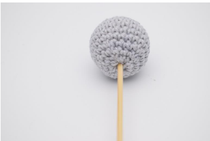
5. Setze die Kugel auf einen Blumestab oder einen Speiß.