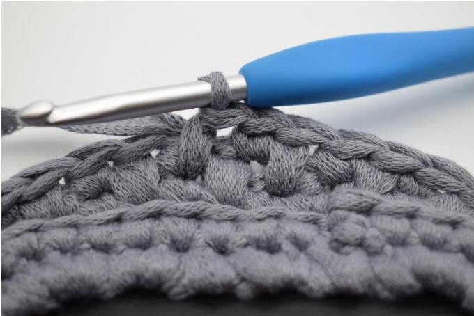
5. Genau so.