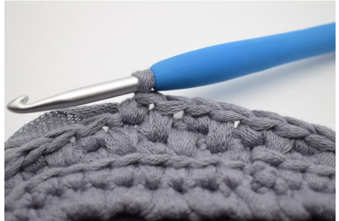
6. 1 fM in die nächste M häkeln.