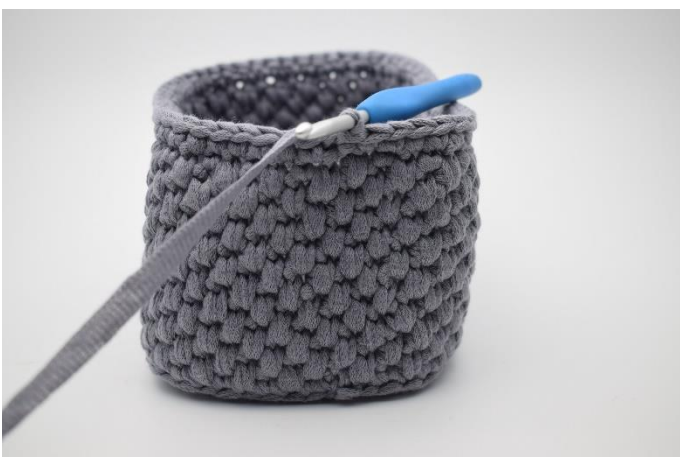
1. Bilde 1 Lftm. Jeweils 1 fM in jede M bis Rundenende häkeln und die Runde mit 1 Km beenden.