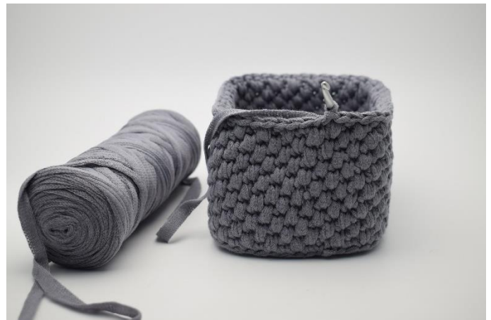
8. Wiederhole diese 2 Runden insgesamt 6 Mal oder bis Dein Korb die gewünschte Höhe erreicht hat.