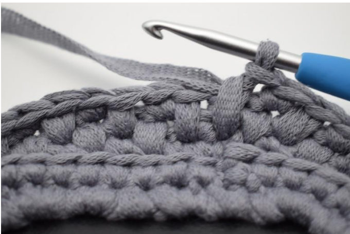
7. Wiederhole dies bis Rundenende und beende die Runde mit 1 tfM.