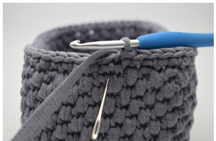
2. Bilde 1 Lftm. Nun werden jeweils 1 tfM in jede M bis Rundenende gehäkelt. Die Nadel markiert hier die Stelle, in der die tfM gehäkelt wird.