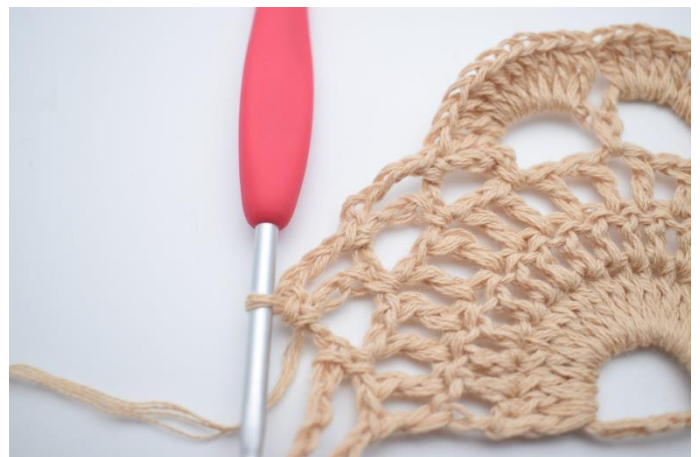
12. 4 Lftm anschlagen und 1 fM in den nächsten Lftm-Bg häkeln.