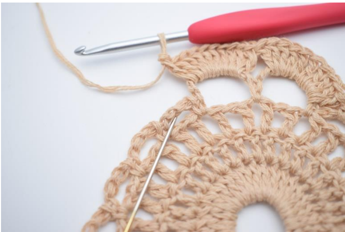
9. 1 fM in den nächsten Lftm-Bg häkeln, der hier anhand der Nadel markiert wird.