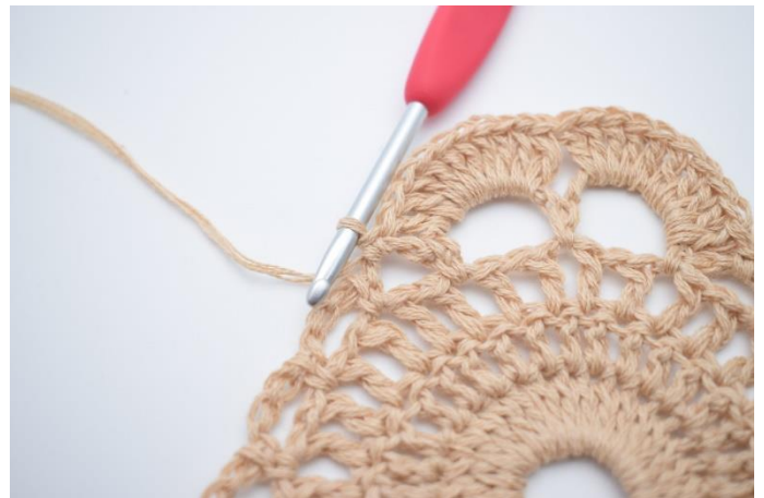
10. Genau so.