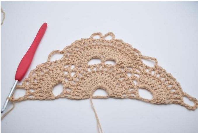
17. Genau so.

16. 7 Lftm anschlagen und 1 Stb in die letzte M häkeln, die hier anhand der Nadel markiert ist.