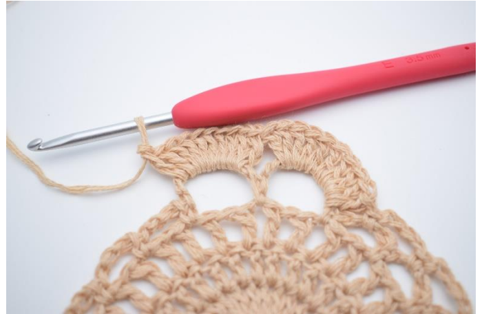
8. 10 Stb in den nächsten großen Lftm-Bg häkeln.