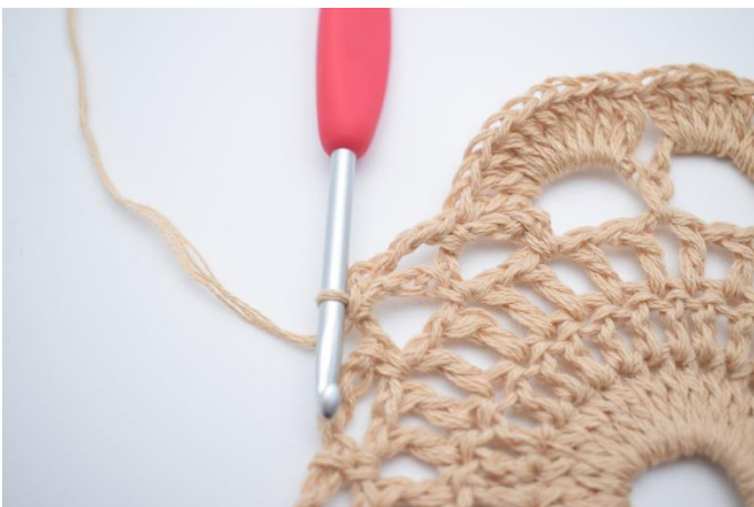
11. 4 Lftm anschlagen und 1 fM in den nächsten Lftm-Bg häkeln.