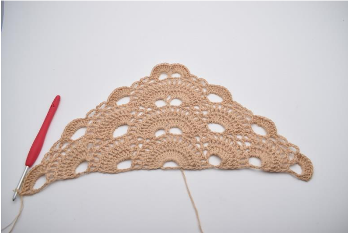
14. Diese Reihe wurde wie Reihe 10 gehäkelt.