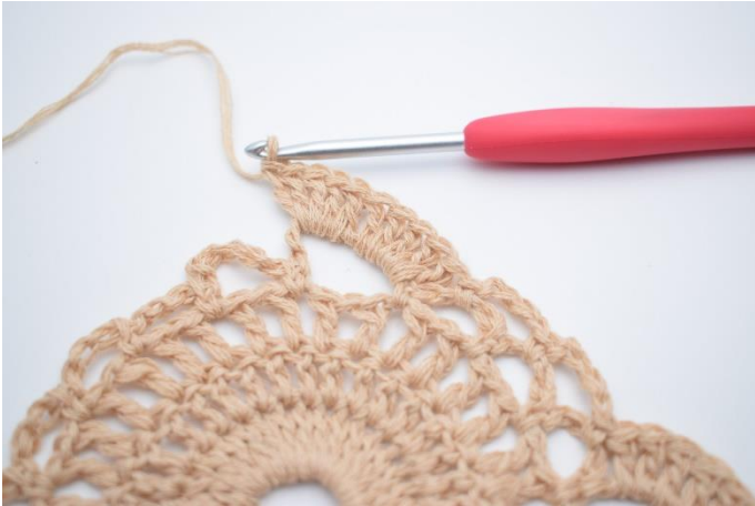
7. 10 Stb in den großen Lftm-Bg häkeln.