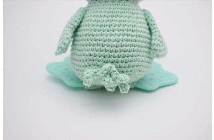
2. Und hinten.