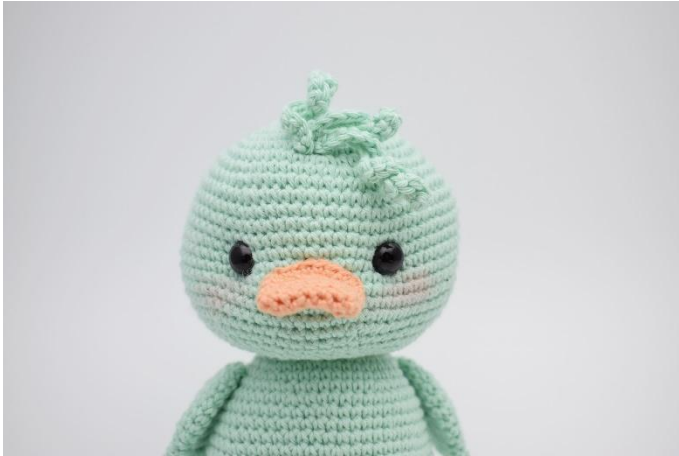
1. Die Locken oben am Kopf festnähen.