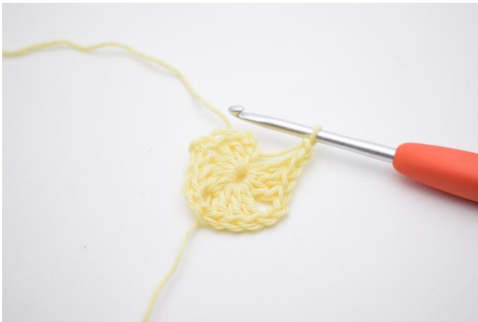
5. "3 Stb und 2 Lftm" noch 2 mal wiederholen, und den MR leicht zuziehen.