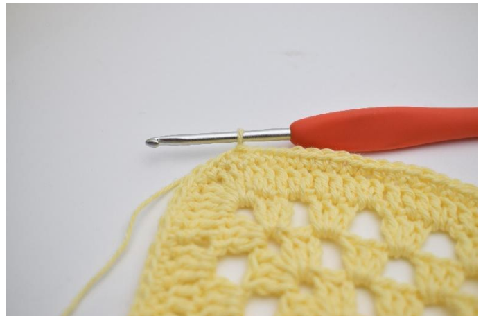
8. 1 Lftm, und 1 Runde fM. Enden mit 1 Kett-M.