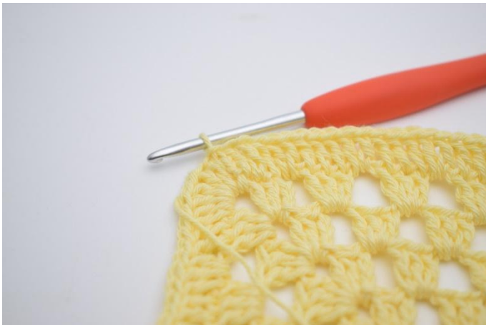
7. Mit 1 Kett-M enden.