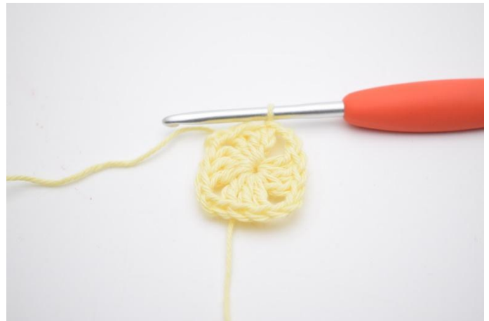
6. 2 Lftm. Die Runde mit einer Kett-M in die 3. Lftm ab Rundenbeginn enden.