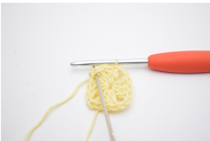
7. Kett-M hin zur ersten "Ecke" (Lftm-Zwischenraum).