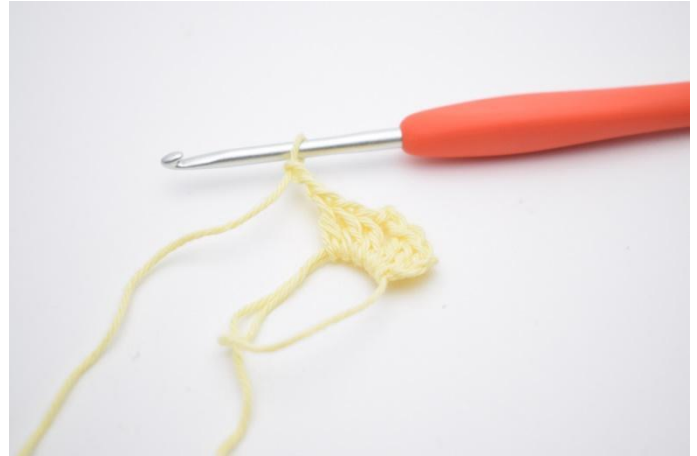
4. "3 Stb und 2 Lftm" häkeln.