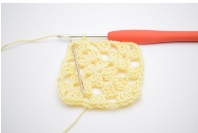
11. Kett-M hin zur "Ecke"