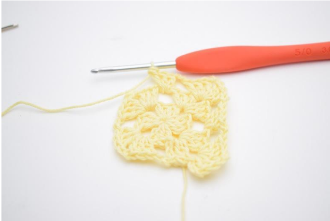
7. 3 Stb um den Lftm-Zwischenraum.