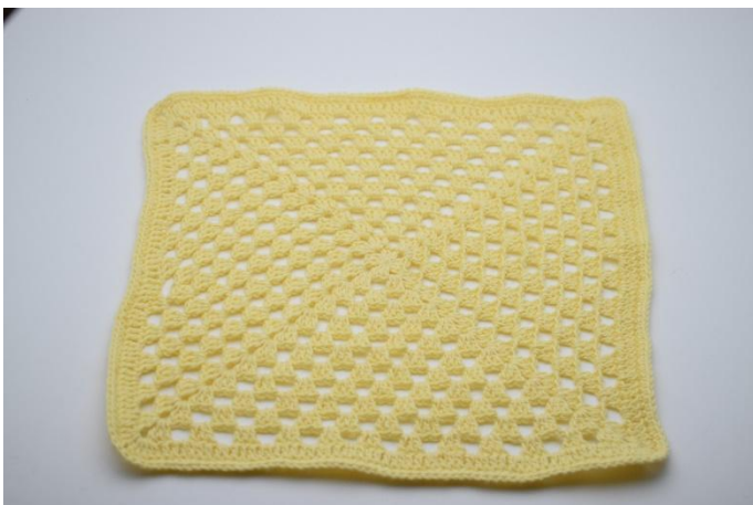
9. Das Tuch ist jetzt fertig.