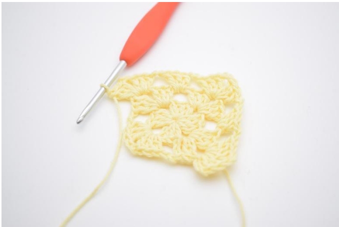
9. "3 Stb, 2 Lftm, 3 Stb" um die "Ecke" (Lftm-Zwischenraum).