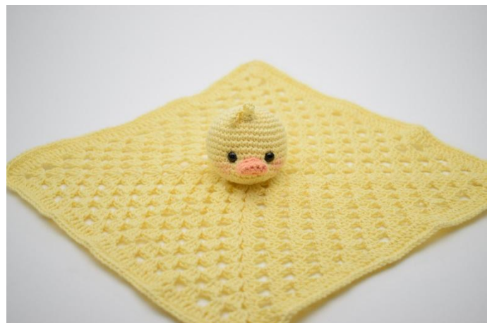
10. Dann den Kopf mitten auf dem Tuch annähen.