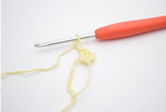
3. 2 Lftm..