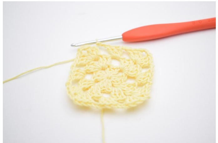
10. Dies wiederholen bis Rundenende. Enden mit 2 Lftm, und 1 Kett-M in die 3. Lftm ab Rundenbeginn.