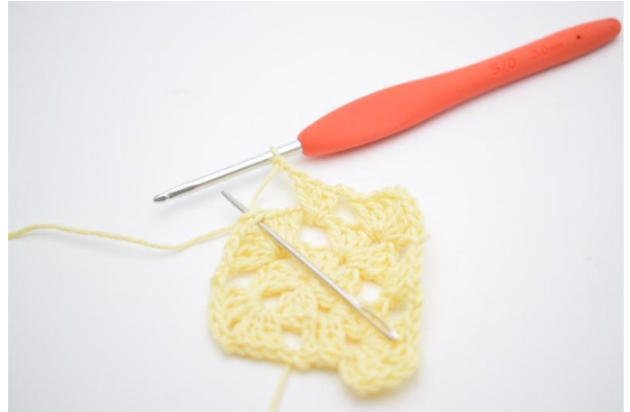
8. 2 Lftm. Dann um die nächste "Ecke" (Lftm-Zwischenraum) häkeln.