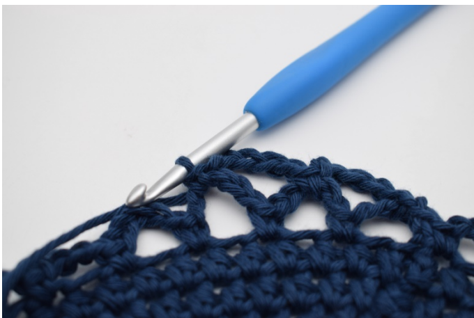
13. 1 fm.