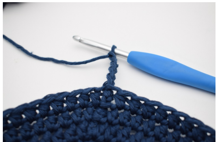
2. 5 Lm häkeln.