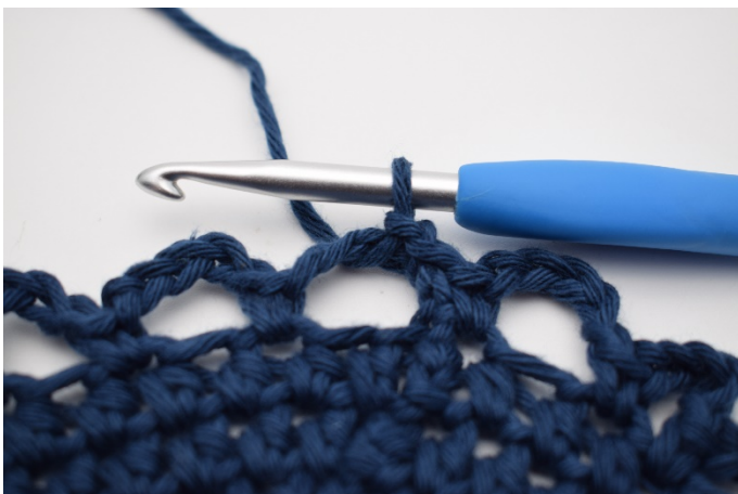
7. 3 km entlang dem ersten Lm-Bogen, damit du in der Mitte davon beginnst.