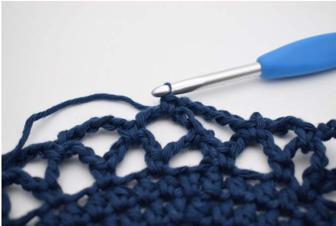
15. Wiederhole jetzt die Runden und wechsle die Farbe wie oben beschrieben