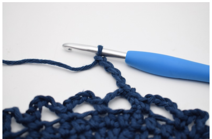
8. 5 Lm häkeln.