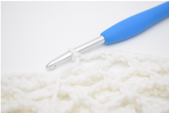
17. Jetzt wird noch eine Runde mit Farbe 4 gehäkelt. Diese Runde wird wie vorher gehäkelt, jedoch mit 4 Lm anstelle von 5.