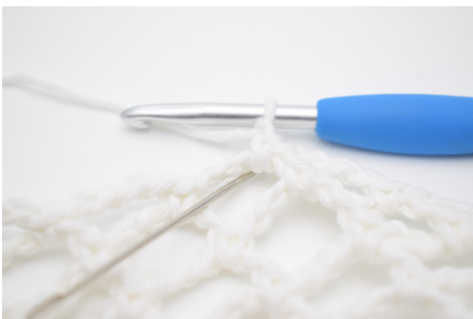
1. 1 Lm und 4 fM in den Lm-Bogen.