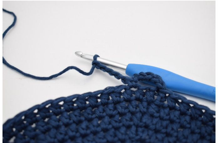
4. 5 Lm häkeln.