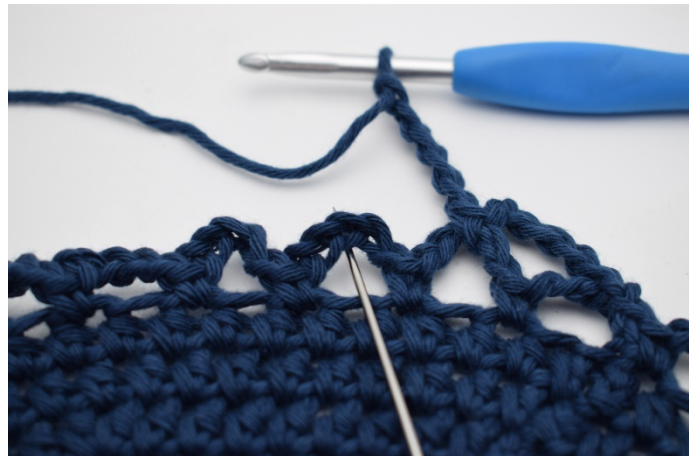
12. In den nächsten Lm-Bogen. (Die Nadel zeigt wo)