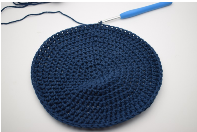
1. Hier ist der Boden mit 1 Km beendet.