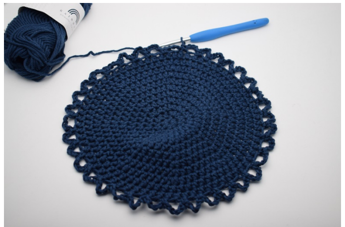
6. So auf der Runde wiederholen bis insgesamt 36 Lm-Bogen um den Boden gehäkelt sind.