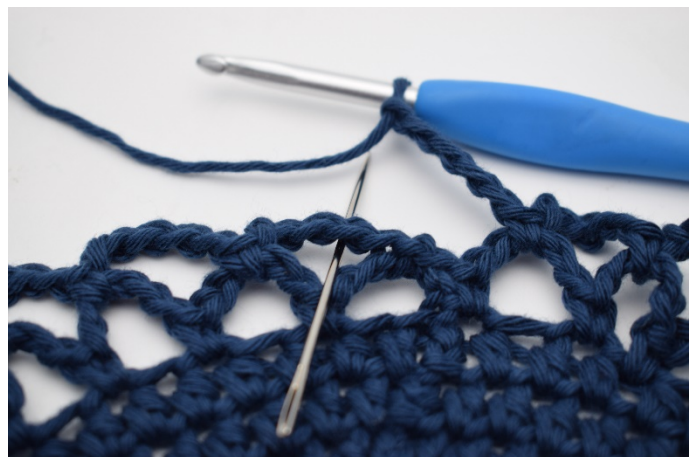
14. Weiter auf der Runde wiederholen. Die Runde wird mit 1fm in den ersten Lm-Bogen dieser Runde beendet.