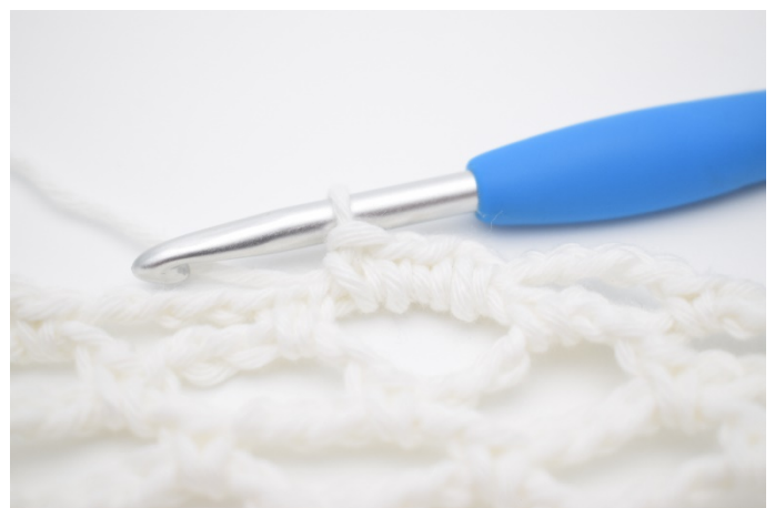
2. Genau so.