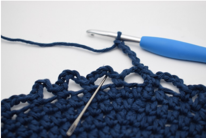
9. In den nächsten Lm-Bogen. (Die Nadel zeigt wo)