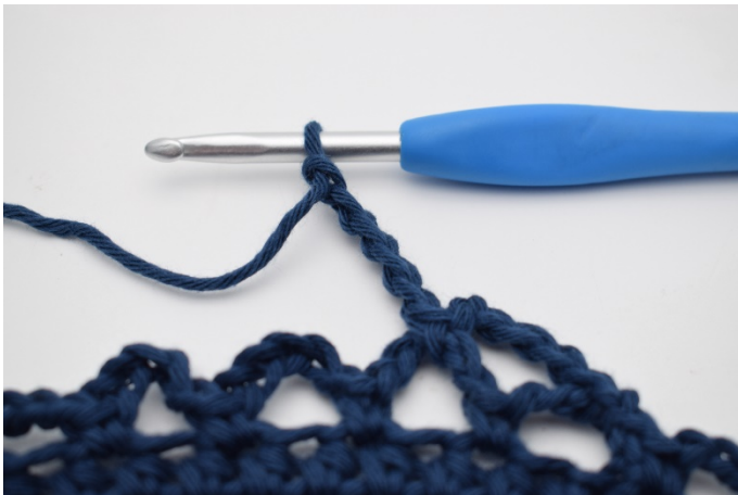
11. 5 Lm häkeln.