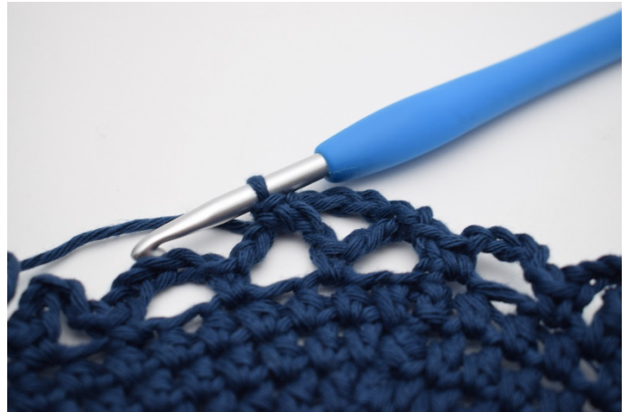
10. 1 fm.