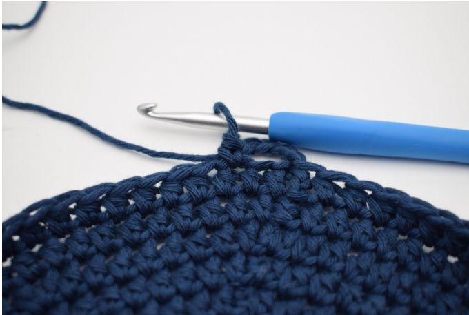
3. 1 M überspringen, und 1 fM in die nächste.