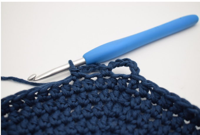
5. 1 M überspringen, und 1 fM in die nächste.