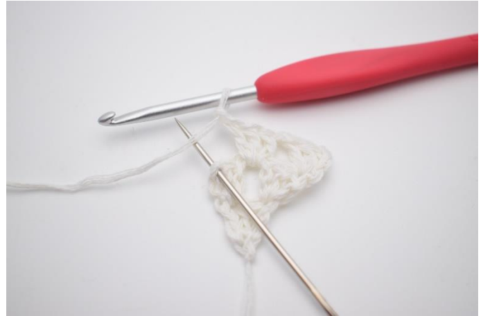
6. 1 Lftm anschlagen. Nun wird in die letzte M, die hier anhand der Nadel markiert wird,