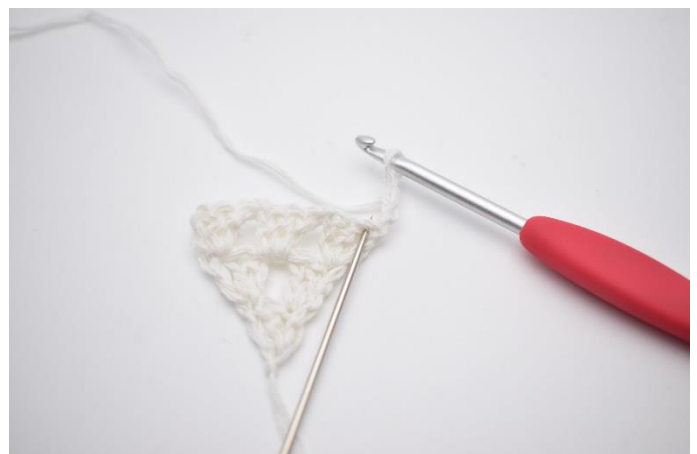
2. In die erste M, die hier anhand der Nadel markiert wird,