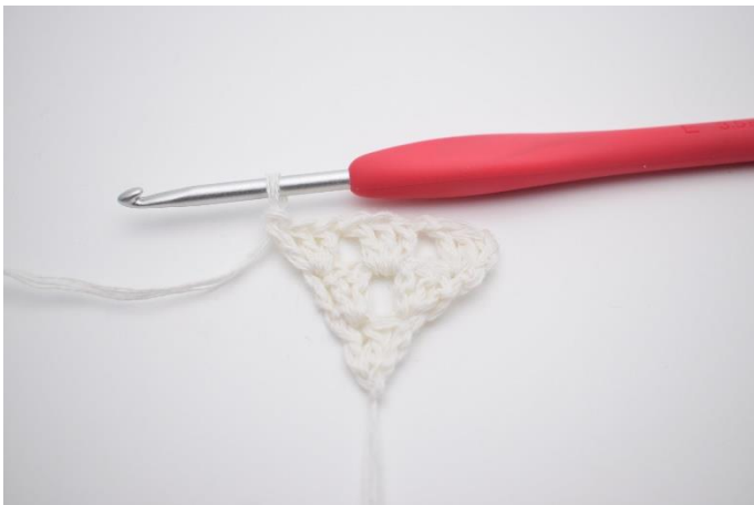
7. 1 Stb-Gruppe gehäkelt.