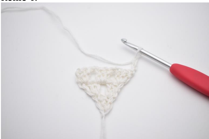
1. 3 Lftm zum Wenden (ersetzen das 1. Stb).