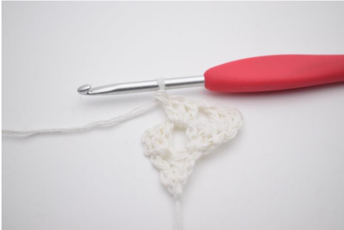
5. 1 Stb-Gruppe in den Lftm-Zwischenraum häkeln.