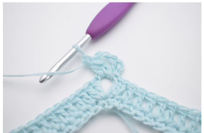
2. 3 Lftm anschlagen (ersetzen das 1. Stb). 1 Stb, 2 Lftm und 2 Stb in den Lftm-Zwischenraum häkeln.