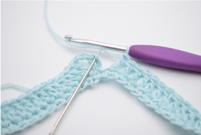
7. 1 Stb in die letzten 62 M häkeln. Beende die Runde mit 1 Km in die obere der 3 Lftm, die zu Beginn der Runde angeschlagen wurden.