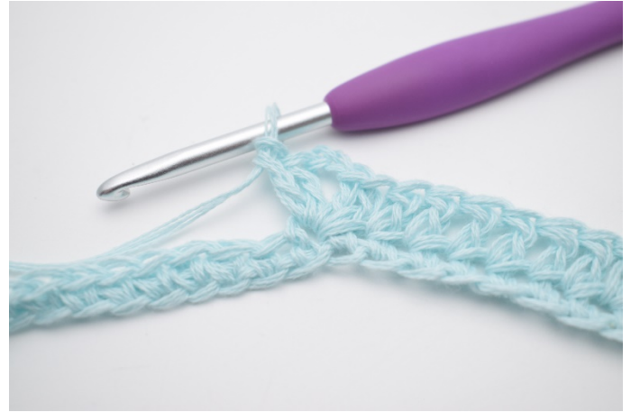
6. Genau so.