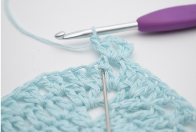
3. "2 Stb zwischen den 2 Stb der vorherigen Runde häkeln."