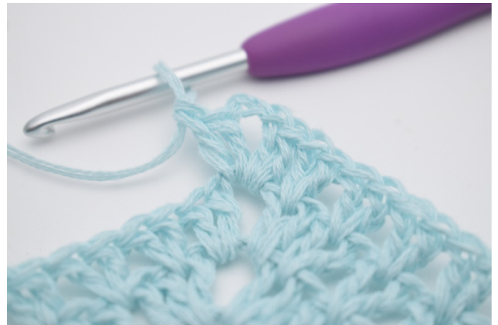
6. "2 Stb, 2 Lftm, 2 Stb" in den Lftm-Zwischenraum häkeln.