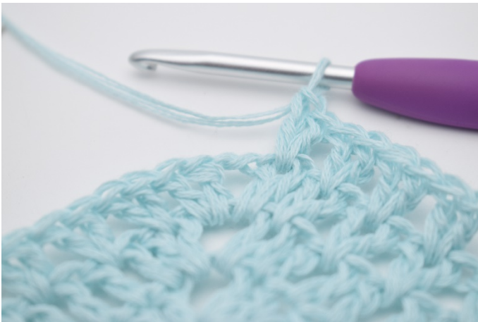
5. Wiederhole von " bis " insgesamt 37 Mal.