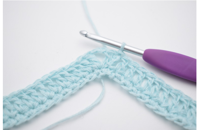
8. Genau so.