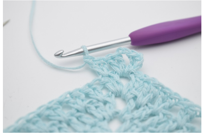
4. Genau so.