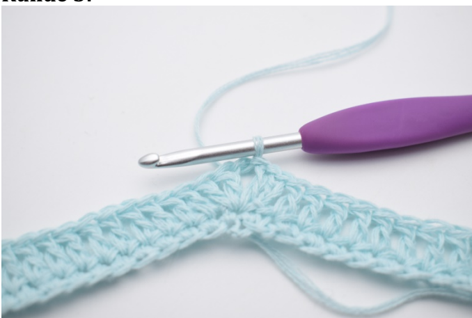
1. Km bis zum Lftm-Zwischenraum häkeln.