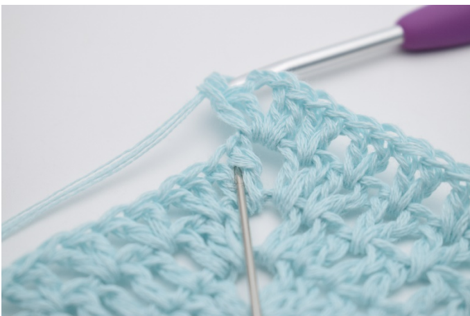
7. "2 Stb zwischen den 2 Stb der vorherigen Runde häkeln."