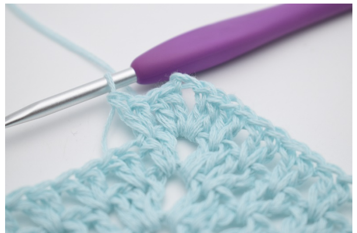
8. Genau so.