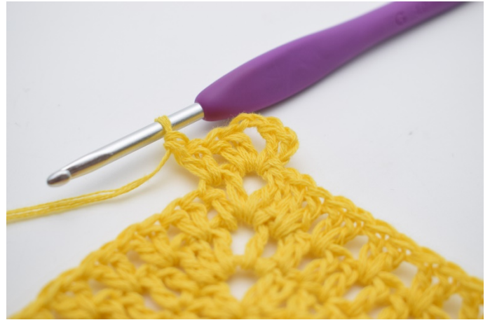
4. Genau so.