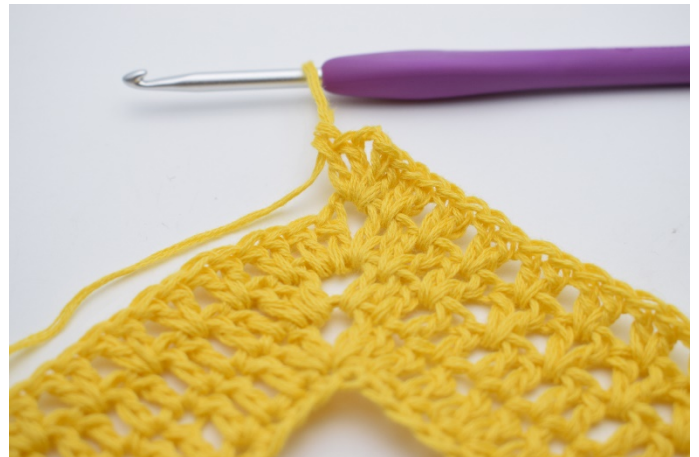
6. "2 Stb, 2 Lftm, 2 Stb" in den Lftm-Zwischenraum häkeln.