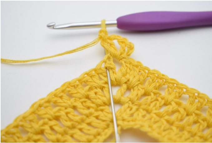
3. "2 Stb zwischen den 2 Stb der vorherigen Runde häkeln".