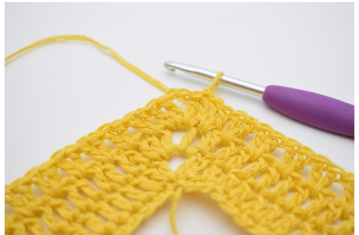
12. Genau so.