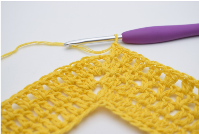
5. Wiederhole von " bis " insgesamt 29 (30) 32 (33) Mal.