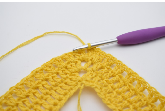
1. Km bis zum Lftm-Zwischenraum häkeln.