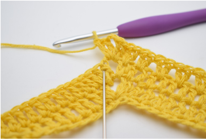
9. "2 Stb zwischen den nächsten 2 Stb häkeln, 1 M überspringen".