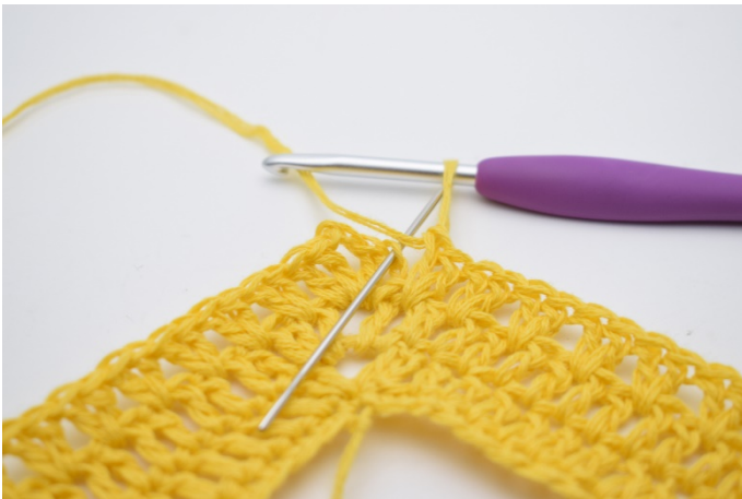
11. Wiederhole von " bis " insgesamt 27 (28) 30 (31) Mal. Beende die Runde mit 1 Km in die obere der 3 Lftm, die zu Beginn der Runde angeschlagen wurden.