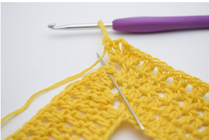
7. "2 Stb zwischen den 2 Stb der vorherigen Runde häkeln".