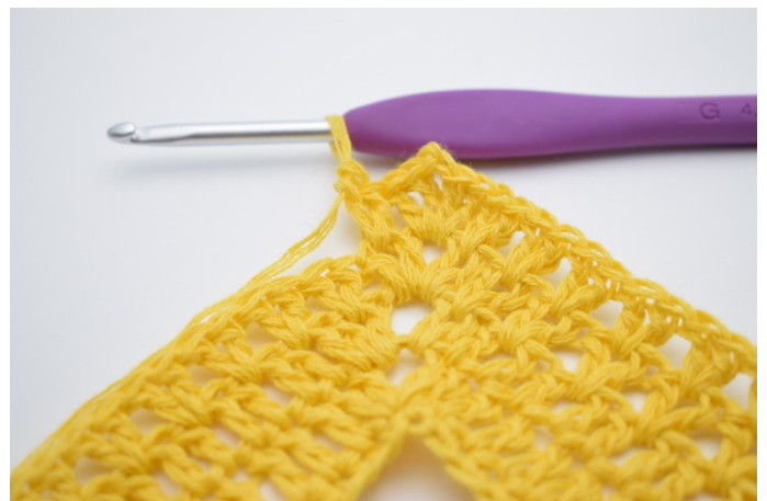
8. Genau so.