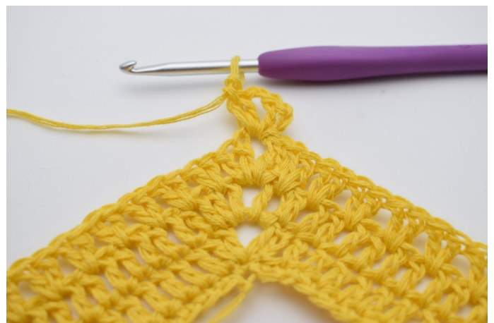
2. 3 Lftm anschlagen (ersetzen das 1. Stb). 1 Stb, 2 Lftm und 2 Stb in den Lftm-Zwischenraum häkeln.