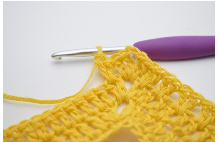
10. Genau so