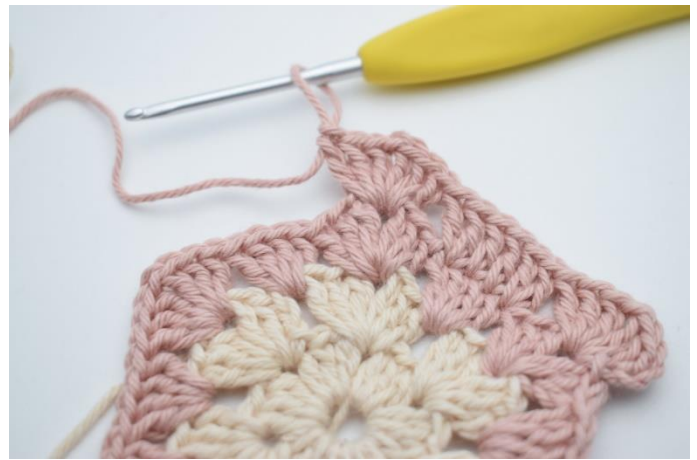
8. "Häkle 3 St, 1 Lm, 3 St im nächsten Lm-Zwischenraum,