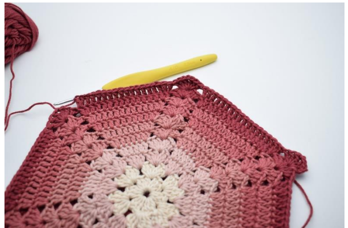
10. überspringe 3 M, häkle 2 St in die nächste M, 1 St in die nächsten 14 M, 2 St in die nächste M".