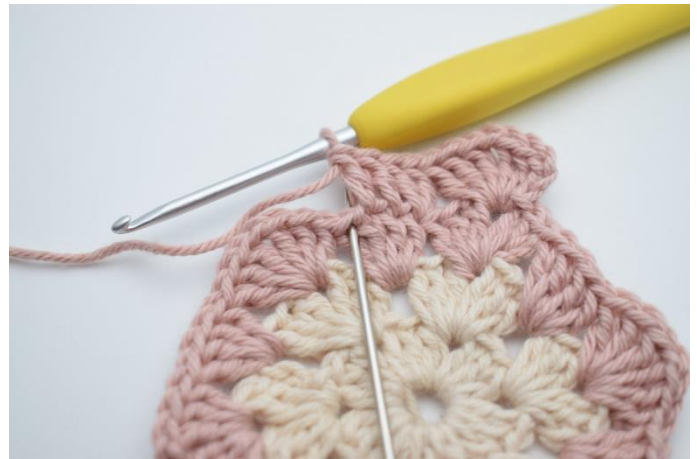
6. Häkle 2 St in die nächste M.