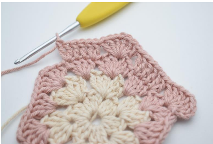
9. überspringe 3 M, häkle 2 St in die nächste M, 1 St in die nächsten 2 M, 2 St in die nächste M".