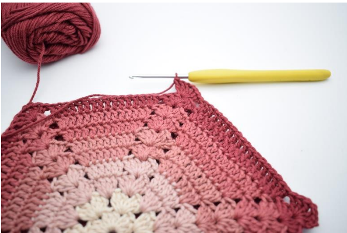
9. 3 Lm (statt 1 St). "Häkle 2 St, 1 Lm, 3 St im nächsten Lm-Zwischenraum,