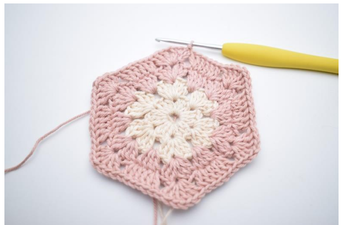
10. Wiederhole "bis" 5 Mal. Beende mit 1 Kettm. Den Faden abschneiden. Lav km hen til Im-mellemrum.