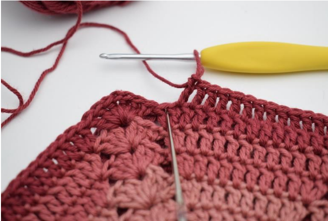
7. 2 St in die nächste M.