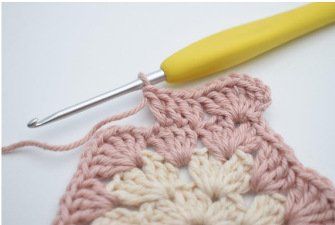
5. Häkle 1 St in die nächsten 2 M,