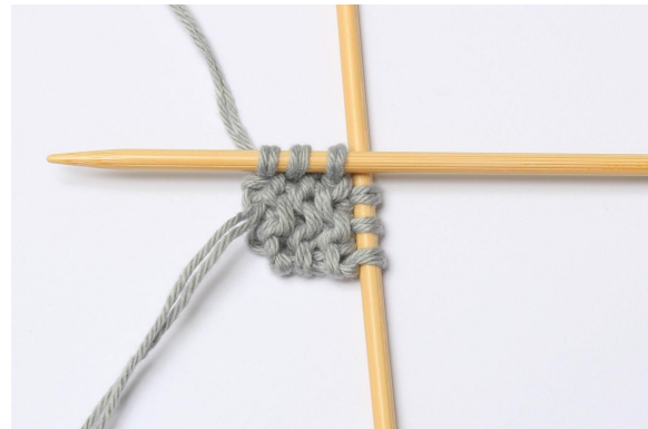
2. Wende nicht, sondern stricke 3 M hoch = 6 M.