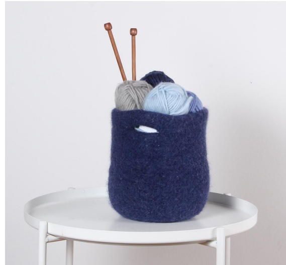
Korb nach dem waschen