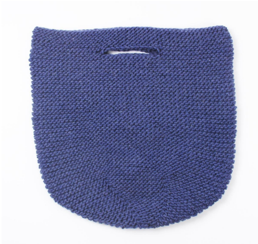
Korb vor dem waschen