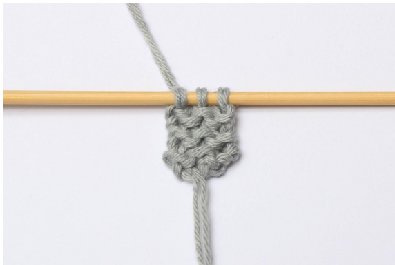
1. Schläge 3 M auf und stricke 6 Reihen rechts.