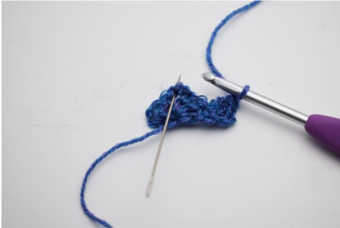
3. Eine Lm häkeln. Jetzt wird im Luftmaschenbogen ( Spitze des Schals) gehäkelt.