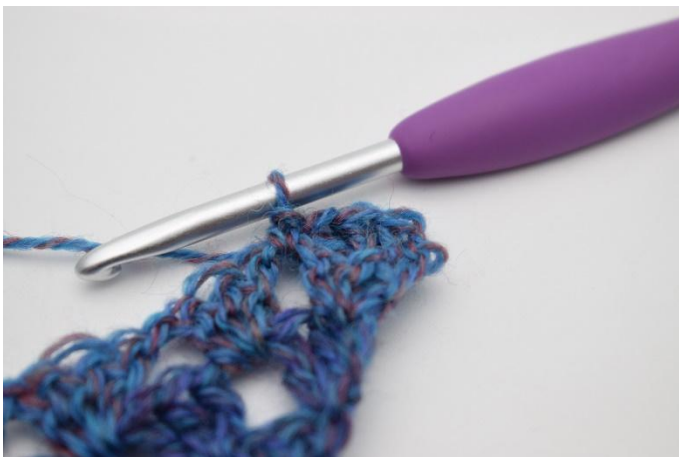
5. Genau so.