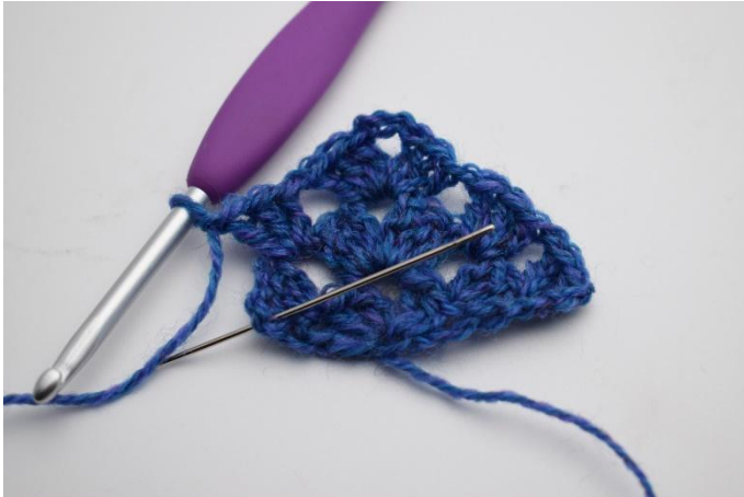
15. 1 Lm bilden und in die 3. Lm der vorherigen Reihe häkeln.