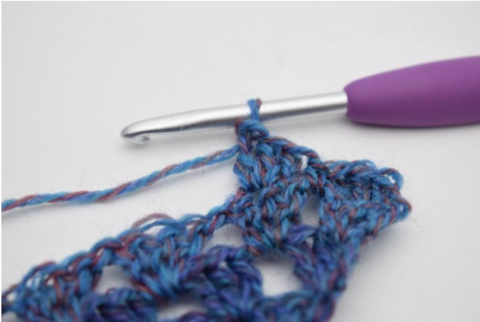
7. Genau so.