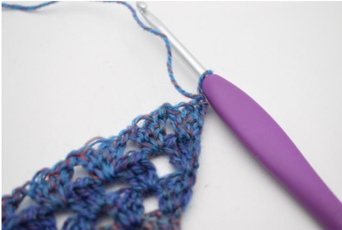
1. Mit 1 Lm wenden.