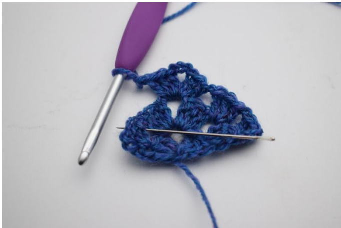
13. 1 Lm bilden und in den nächsten Lm-Zwischenraum häkeln,