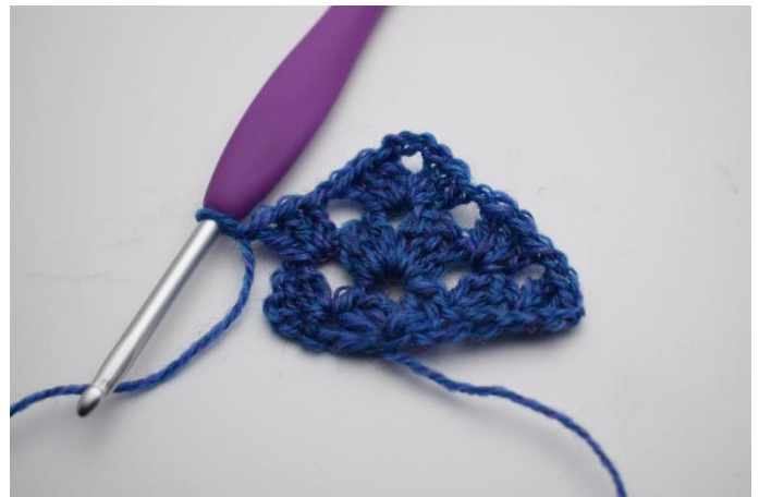
14. 1 Stb Gr häkeln.