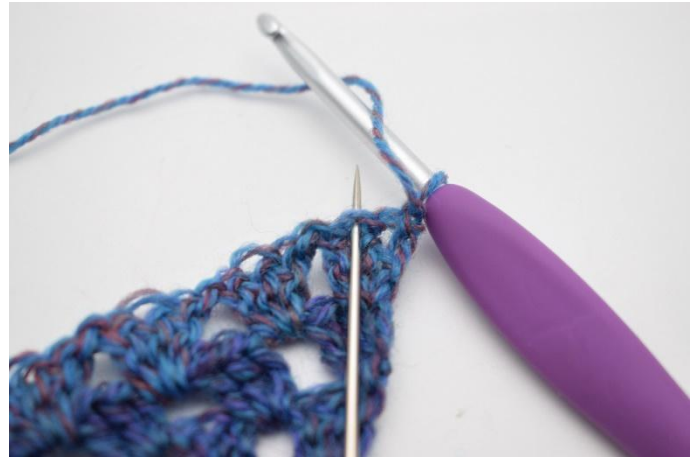
2. 1 M überspringen und 3 Stb in das mittlere Stb der Stb Gr häkeln.