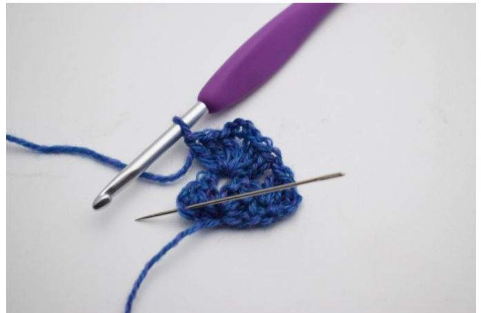
6. 1 Lm bilden und in die 3 Lm der vorherigen Reihe häkeln.