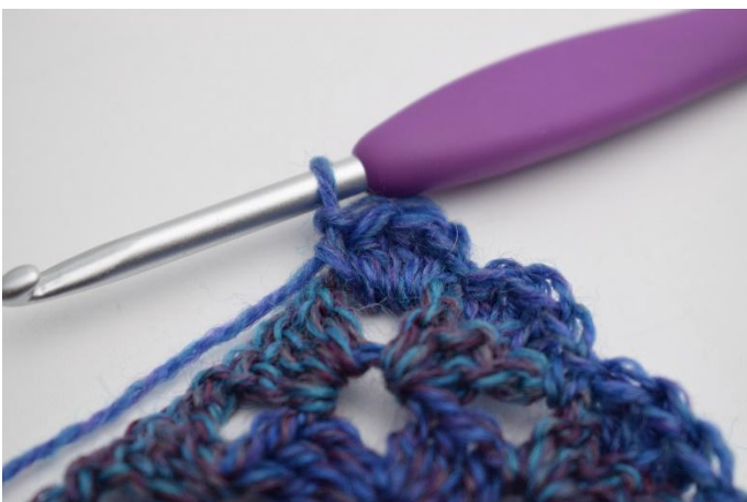
11. 1 fM, 3 Stb und 1 fM in den Lm Bogen