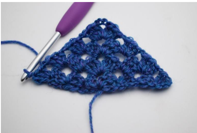
17. So wird wiederholt: 3 Lm bilden (ersetzen 1 Stb). 2 Stb in die erste M und 1 Lm. *1 Stb Gr und 1 Lm in jeden Lm-Zwischenraum*. In der Spitze wird *1 StbGr, 3 Lm, 1StbGr, 1 Lm*gehäkelt. *1 Stb Gr und 1 Lm in jeden Lm-Zwischenraum* auf der gegenüberliegenden Seite häkeln und mit 1 Stb Gr in die 3. Lm der vorherigen Reihe abschließen.