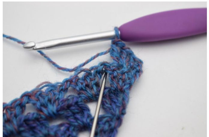
4. 1 fM in den Lm-Zwischenraum häkeln.