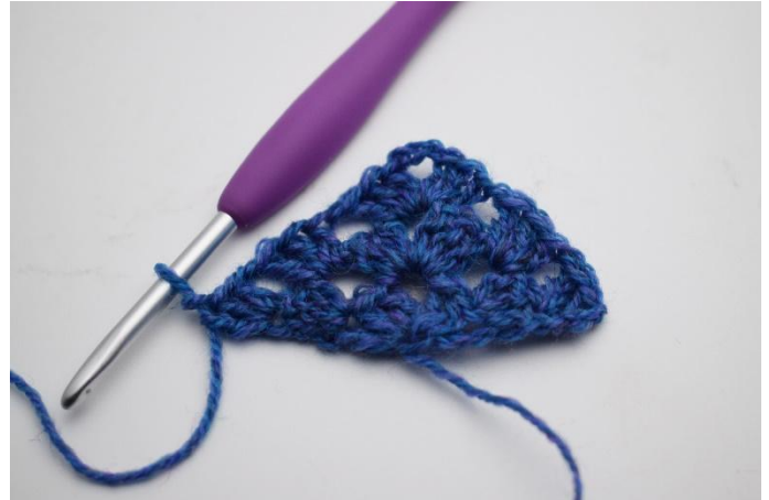
16. 1 Stb Gr häkeln.