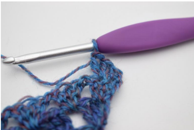
3. Genau so.