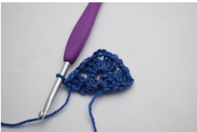
7. 1 Stb Gr häkeln.