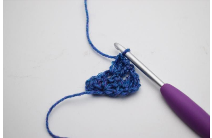
4. *1 Stb Gr häkeln,