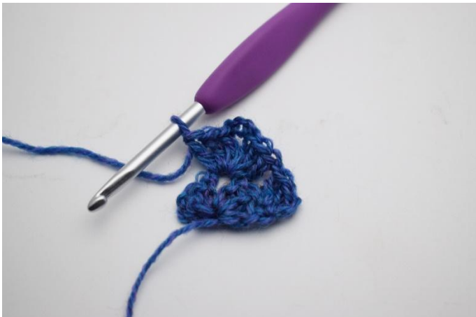
5. 3 Lm, og 1 Stb Gr im Luftmaschenbogen*.