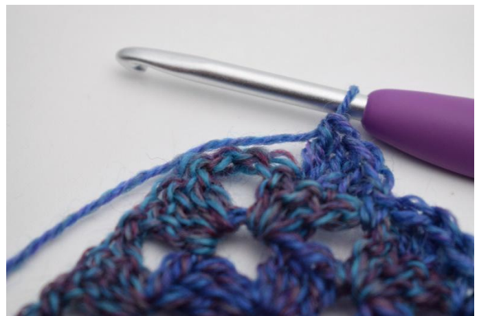
10. Bis zur Spitze /Luftmaschenbogen wiederholen.