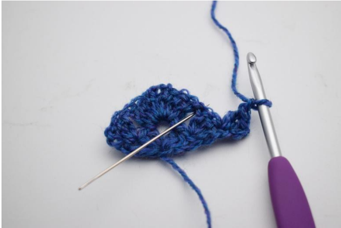
9. 2 Stb in die 1. M häkeln, so dass jetzt 1 Stb Gr mit 3 Stb entstanden ist. Bilde 1 Lm.