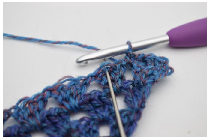
6. *1 M überspringen und 3 Stb in das mittlere Stb der Stb Gr häkeln, .