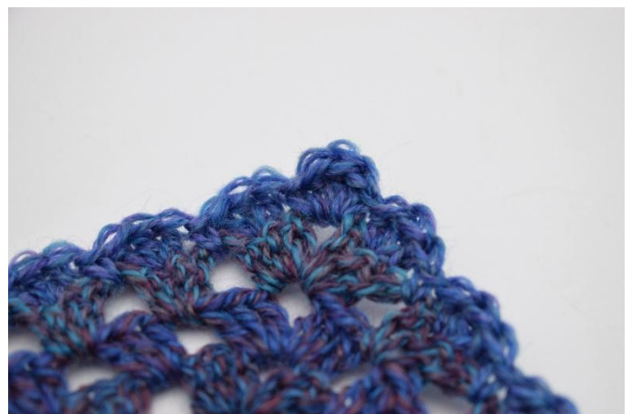
12. Dann * 1 M überspringen und 3 Stb in das mittlere Stb der Stb Gr häkeln. 1 M überspringen und 1 fM in den Lm-Zwischenraum häkeln* bis zum Ende der Reihe. Garn abtrennen und Enden vernähen.