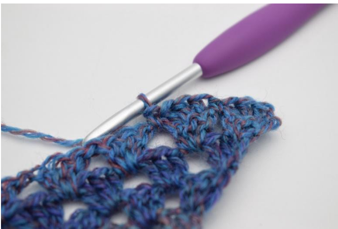
9. Genau so.