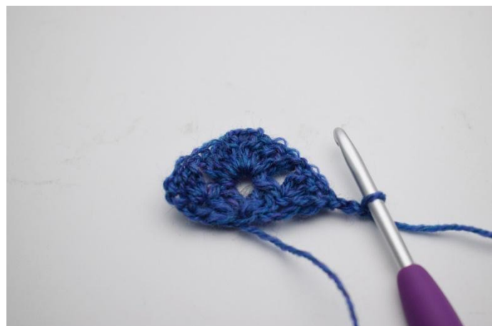
8. Die Arbeit mit 3 Lm wenden (ersetzen 1 Stb).