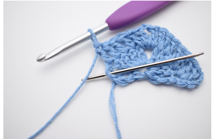
6. In die letzte M (die hier anhand der Nadel markiert wird),