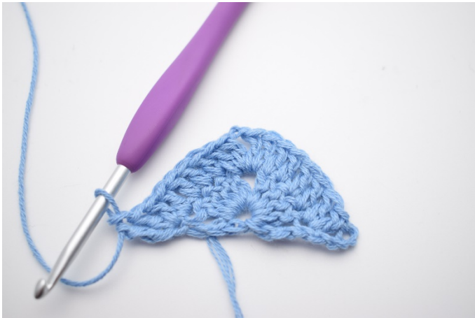
7. 2 Stb und 1 DStb häkeln.