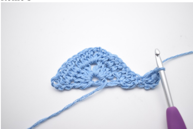
1. 4 Lftm zum Wenden (ersetzen 1 DStb). 2 Stb in die erste M häkeln.