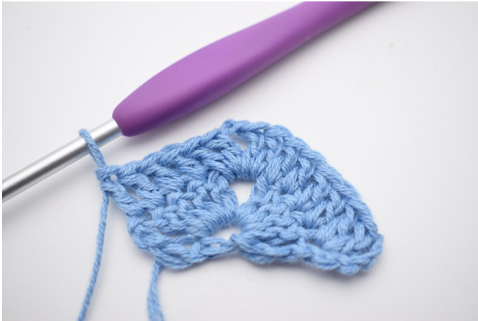
5. Jeweils 1 Stb in die nächsten 4 M häkeln..