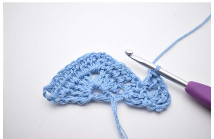
2. "1 M überspringen, 2 Stb in die nächste M" häkeln.