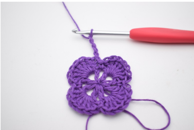
1. Mache 4 Lm.