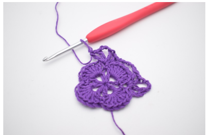
8. So wurden jetzt 2 V's gebildet mit 3 Lm dazwischen, das ist die nächste Ecke.