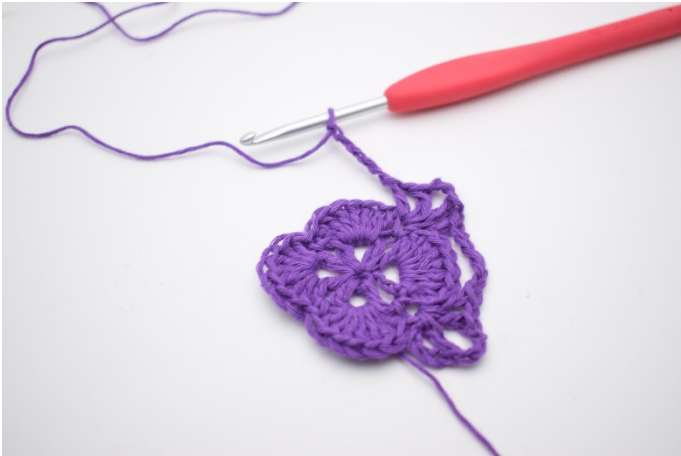
9. Mache 5 Lm.