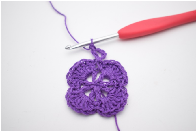
3. So. Jetzt wurde ein V gebildet.