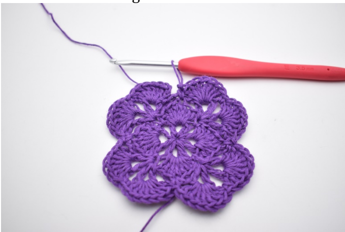
17. Wiederhole dieses die ganze Runde.