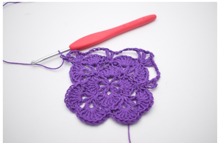
12. So. Es wurden jetzt 2 V's mit 3 Lm dazwischen gebildet und eine weitere Ecke ist entstanden.