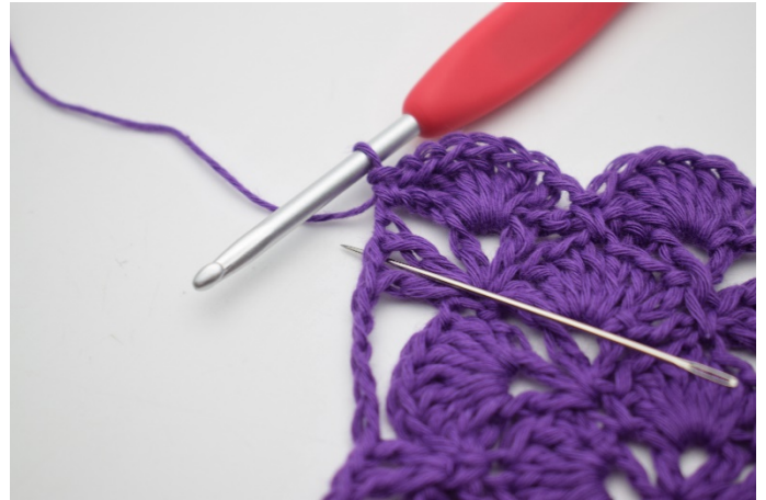
8. Im nächsten V werden 7 Stb gehäkelt.