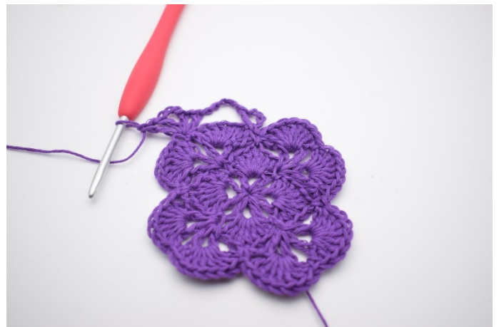
6. So. Es wurden jetzt 2 V's mit 3 Lm dazwischen gebildet und eine Ecke ist entstanden.