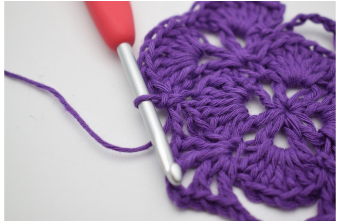
8. So. Der große Lm-Bogen ist jetzt angehäkelt.