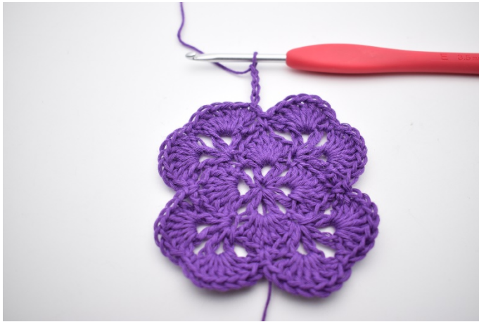
1. Mache 4 Lm.