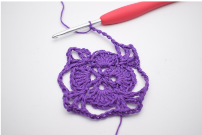
11. Wiederhole die ganze Runde.