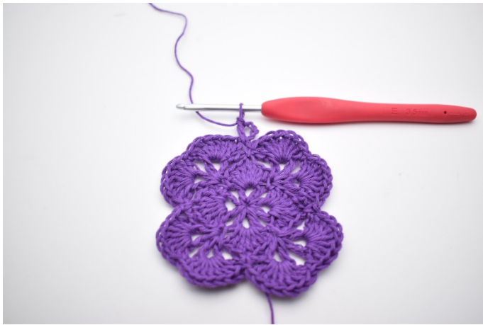
3. Jetzt wurde ein V gebildet.