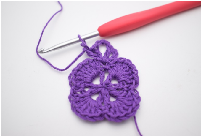
5. Häkle 1 Stb, 1 Lm und 1 Stb in die gleiche Masche. Jetzt wurde ein V mit 3 Lm dazwischen gebildet. Das ist eine Ecke.