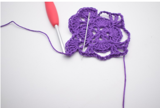
11. In Lm-Bogen wird 1 Fm gehäkelt.