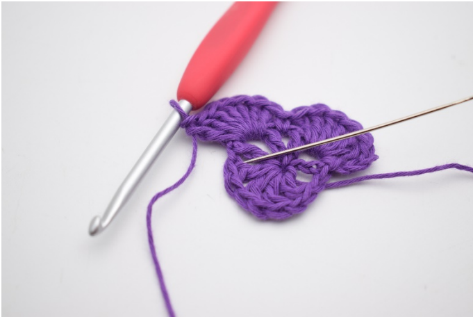
9. In der nächsten Lm-Lücke wird 1 Fm gehäkelt.