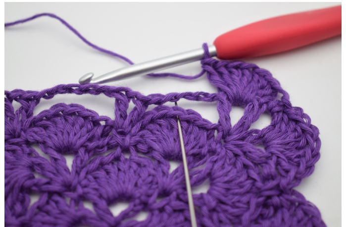
10. Jetzt häkeln wir den nächsten großen Lm-Bogen fest indem wir 1 Fm in dem 4. Stb im Fächer der vorigen Runde machen.