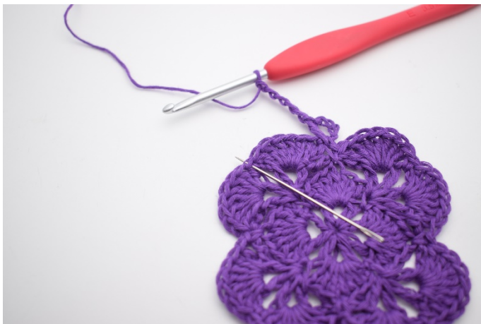
5. In der nächsten Fm häkle 1 Stb, 1 Lm, 1 Stb, 3 Lm, 1 Stb, 1 Lm und 1 Stb.