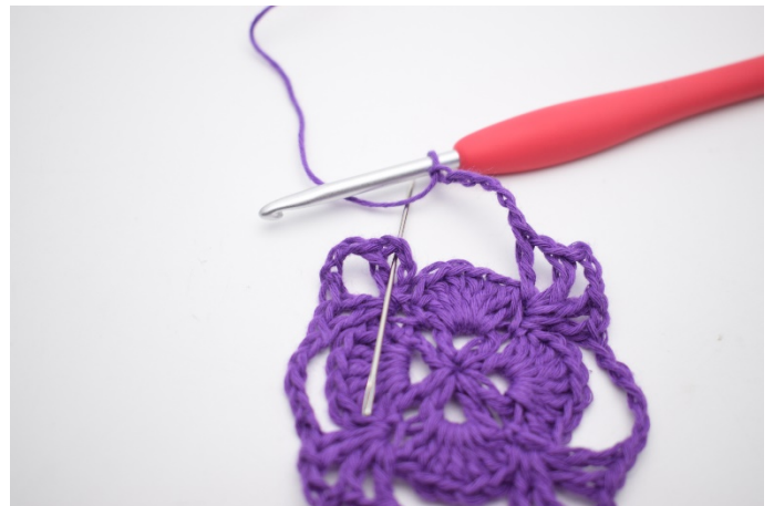
12. Beende mit 1 Kettm in der Lm-Lücke der ersten V.