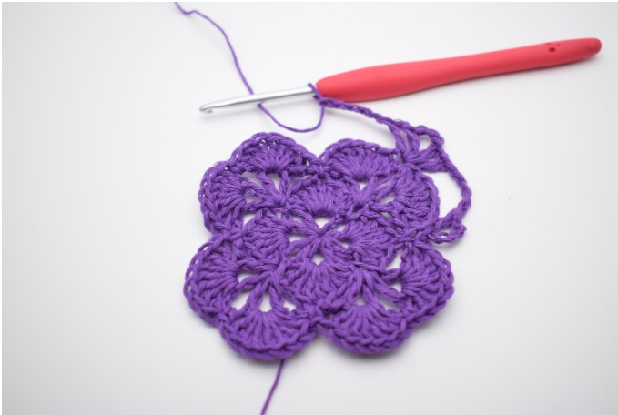
7. Mache 5 Lm.