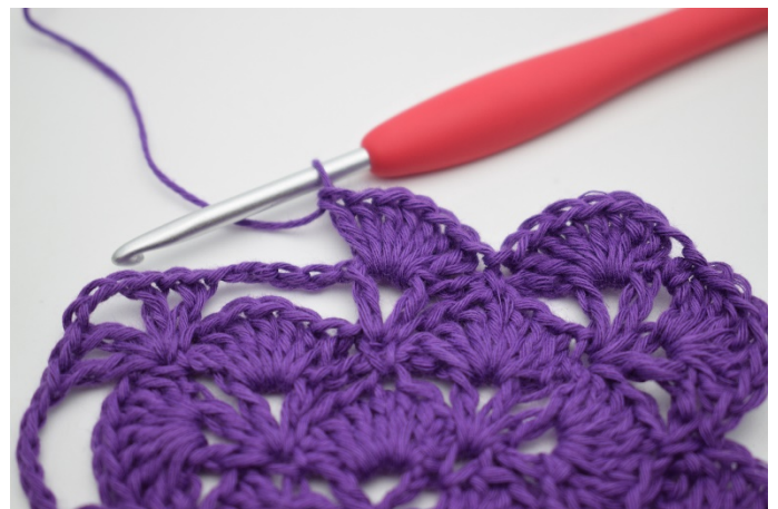
12. Im nächsten V werden 7 Stb gehäkelt.