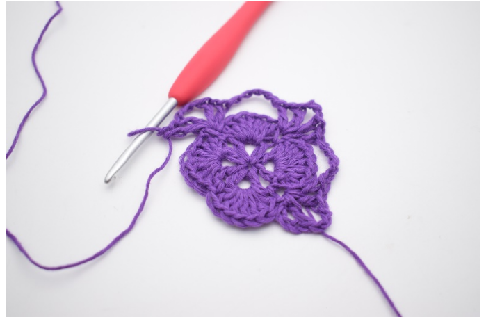
10. In der nächsten Fm häkle 1 Stb, 1 Lm, 1 Stb, 3 Lm, 1 Stb, 1 Lm und 1 Stb. Es wurden jetzt 2 V's gebildet mit 3 Lm dazwischen, das ist die nächste Ecke.