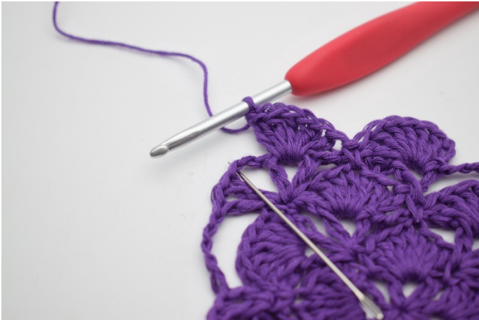
7. Im Lm-Bogen wird 1 Fm gehäkelt.