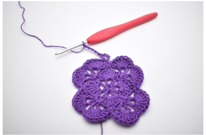
4. Mache 5 Lm.