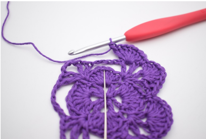
15. Jetzt häkeln wir den nächsten großen Lm-Bogen fest indem wir 1 Fm in dem 4. Stb im Fächer der vorigen Runde machen.