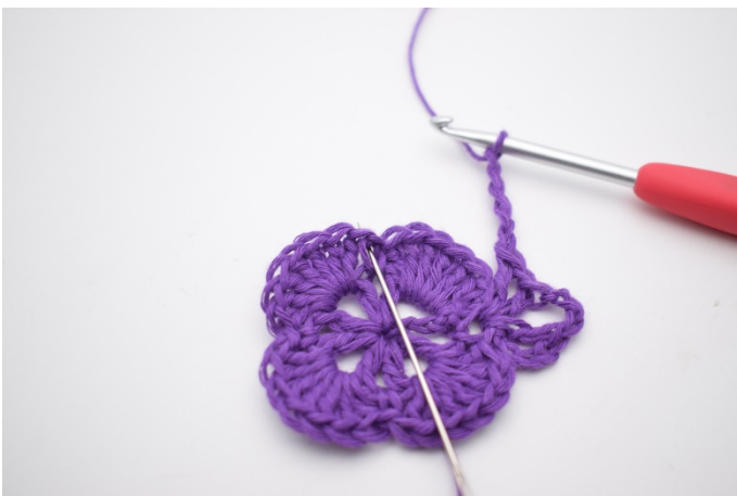
7. In der nächsten Fm häkle 1 Stb, 1 Lm, 1 Stb, 3 Lm, 1 Stb, 1 Lm und 1 Stb.