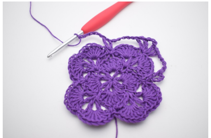
10. Mache 5 Lm.