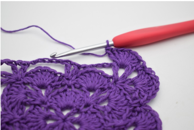
9. So. Jetzt sind 2 Fächer in der ersten Ecke gehäkelt.