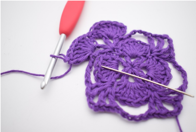
7. Jetzt häkeln wir den großen Lm-Bogen fest indem wir 1 Fm in dem 4. Stb im Fächer der vorigen Runde machen. Die Nadel markiert wo die Fm sein muss.