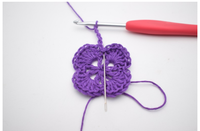
2. In der Fm daneben wird 1 Stb gehäkelt.