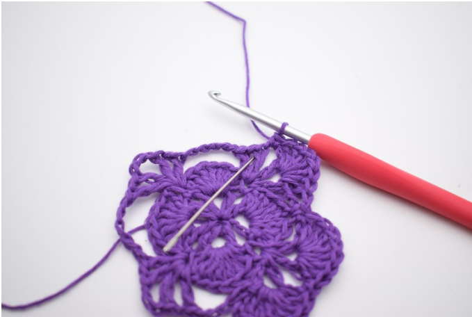
13. Im nächsten V werden 7 Stb gehäkelt.