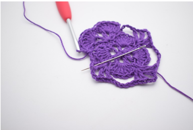
9. Im nächsten V werden 7 Stb gehäkelt.