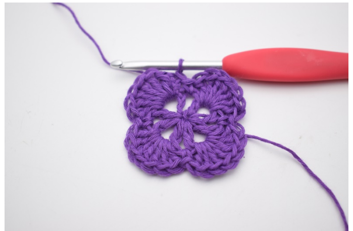
12. Beende mit 1 Kettm in die oberste der 3 Lm.