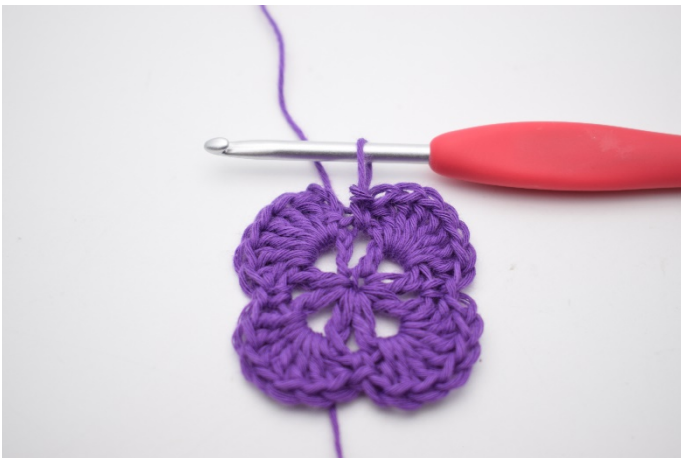
11. Wiederhole die ganze Runde.