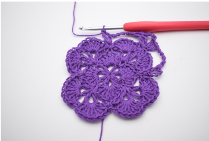
9. Es ist ein V entstanden.