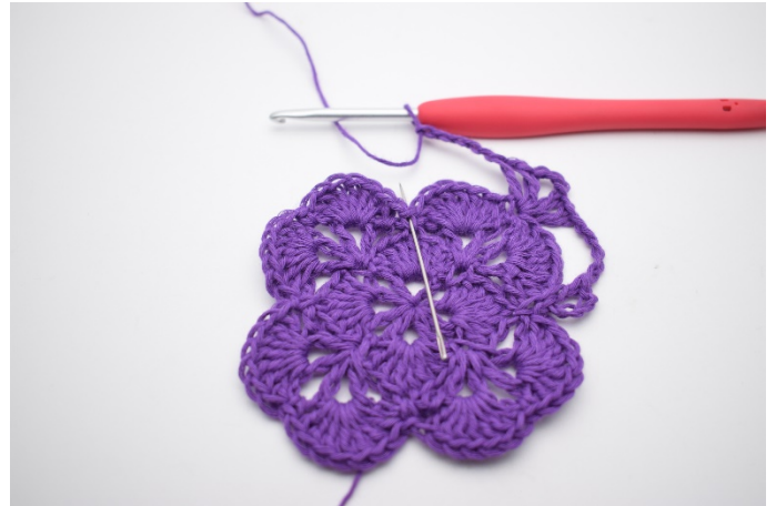
8. In der Fm daneben wird 1 Stb, 1 Lm und 1 Stb gehäkelt.