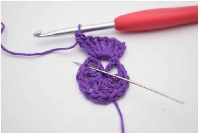
5. In der nächsten Lm-Lücke wird 1 Fm gehäkelt.