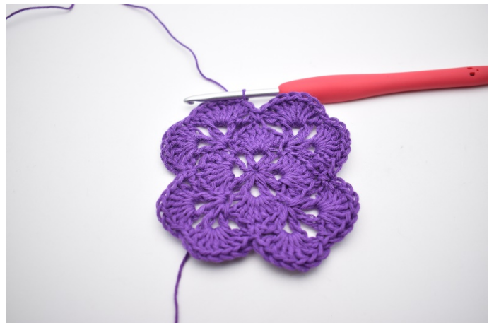
18. Beende mit 1 Kettm in die oberste der 3 Lm vom Anfang der Runde.