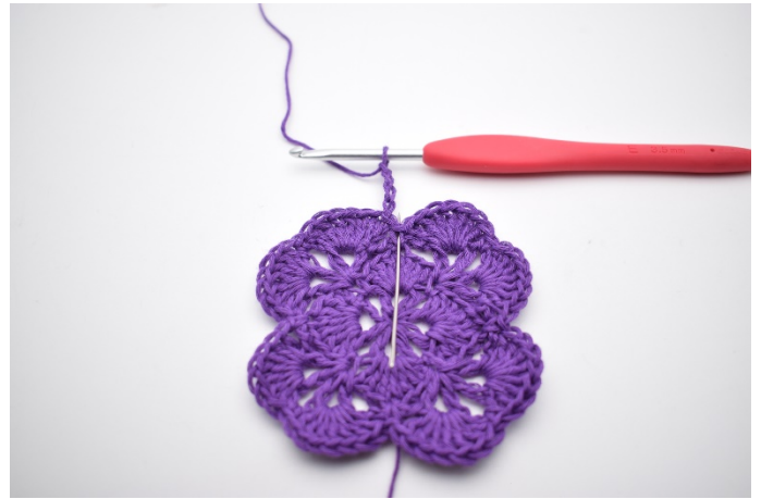
2. In der Fm daneben wird 1 Stb gehäkelt.