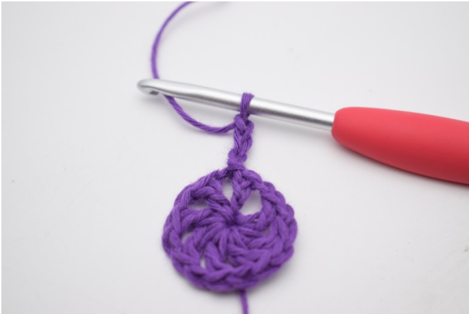
3. Mache 3 Lm, häkle 6 Stb in der Lm-Lücke.