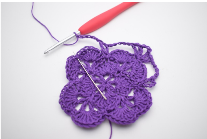
11. In der nächsten Fm häkle 1 Stb, 1 Lm, 1 Stb, 3 Lm, 1 Stb, 1 Lm und 1 Stb.