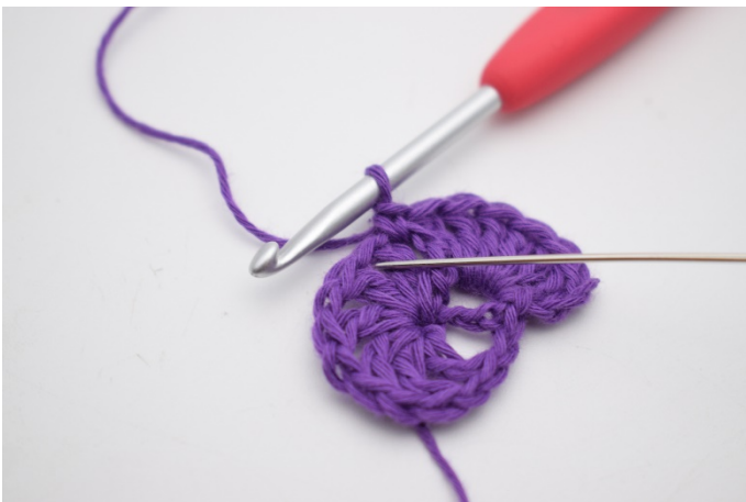
7. In der nächsten Lm-Lücke werden 7 Stb gehäkelt.