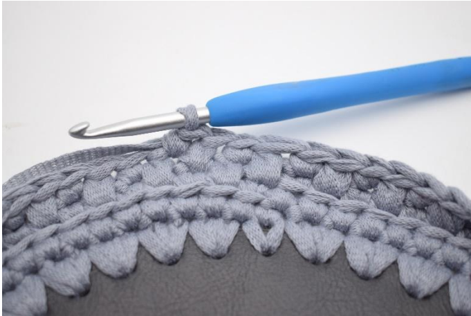
19. 1 fm in die nächste m häkeln.