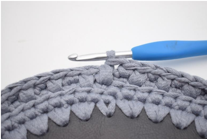
15. Genau so.