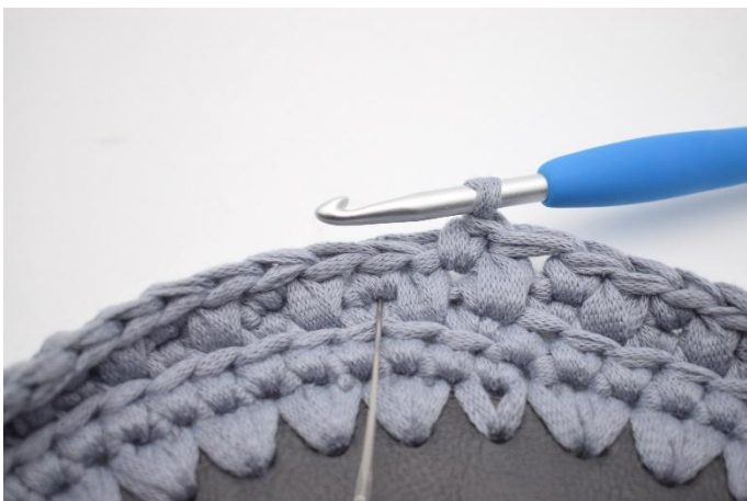
17. 1 tfm in die nächste m häkeln. Die Nadel zeigt, wo eingestochen wird.