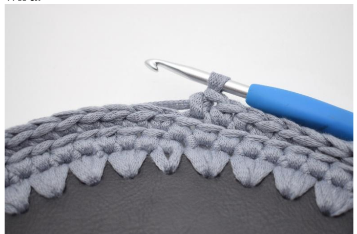
6. Die Runde mit fm in den hQf häkeln.