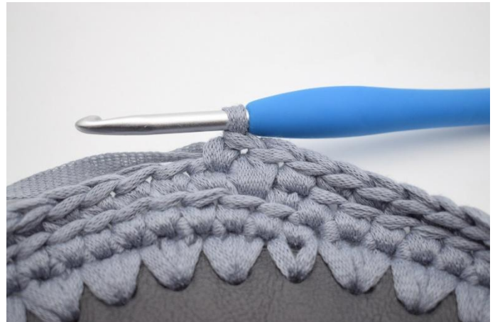
10. 1 fm in die nächste m häkeln.