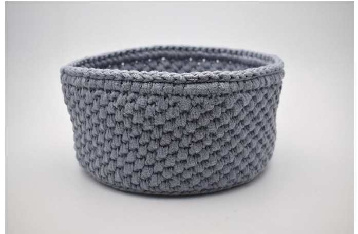
26. Mit einer Runde Kettmaschen abschliessen. Das Garn trennen und die Enden vernähen.