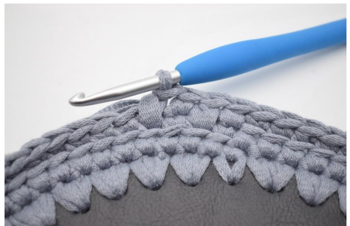
12. Genau so..