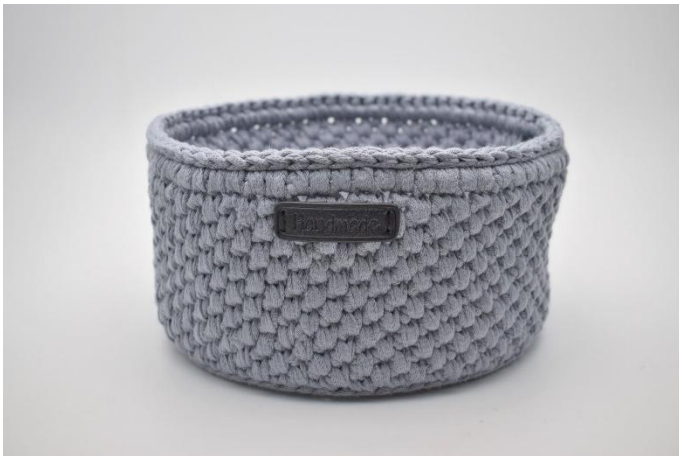
27. Das "Handmade" Etikett mit Nadel und Faden annähen. .