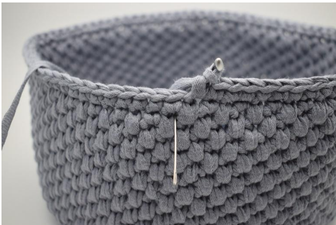
23. 1 Runde tfm häkeln. Die Nadel zeigt, wo eingestochen wird.