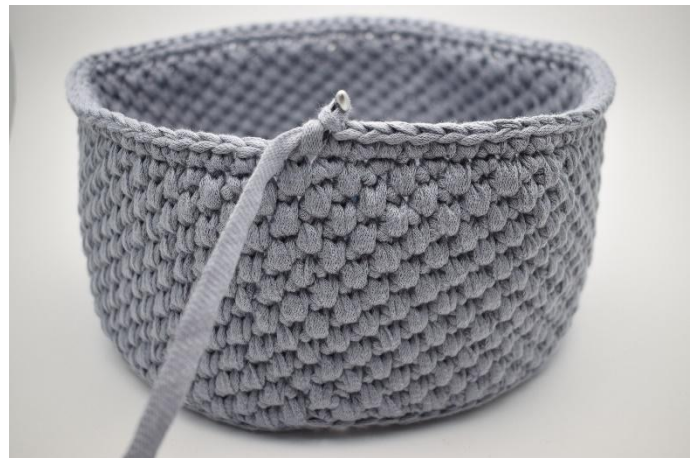
22. 1 Runde fm häkeln.