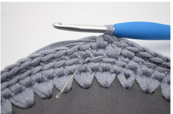
11. 1 tfm in die nächste m häkeln. Die Nadel zeigt, wo eingestochen wird.