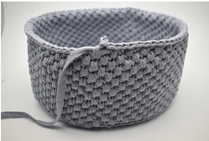
21. Diese Runden wiederholen, wie in der Häkelschrift beschrieben,