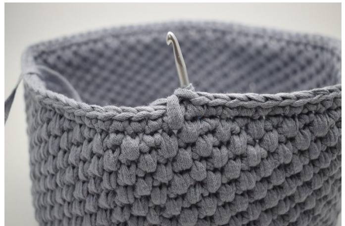
24. Genau so.