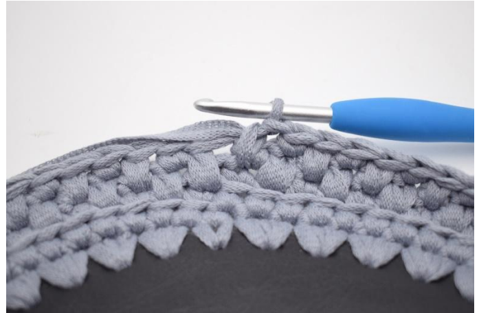
20. Die Runde mit tfm und fm im Wechsel häkeln. Mit 1 tfm beenden.