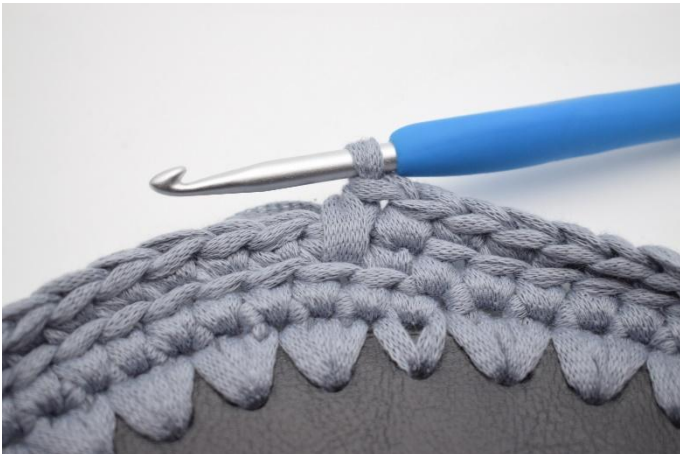
9. So, jetzt sind 1 fm und eine tfm gehäkelt.