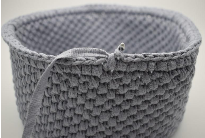
25. Auf der gesamten Runde wiederholen.