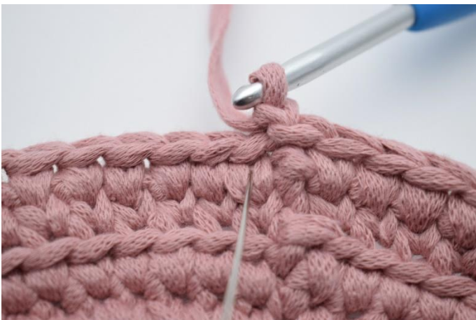
17. Häkle 1 Fm im V der ersten Masche.