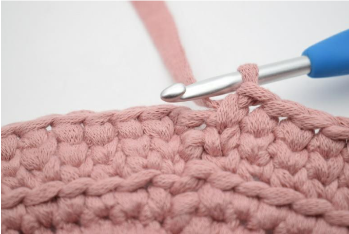
19. Wiederhole dieses die ganze Runde.