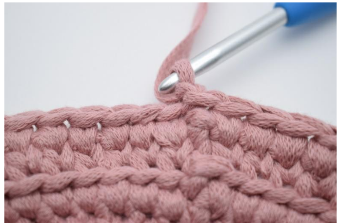
16. Mache 1 Lm.