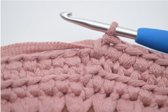
13. Häkle Ks die ganze Runde.