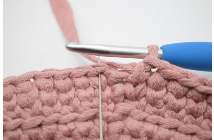
20. Beende mit 1 Kettm in die erste Masche der Runde.