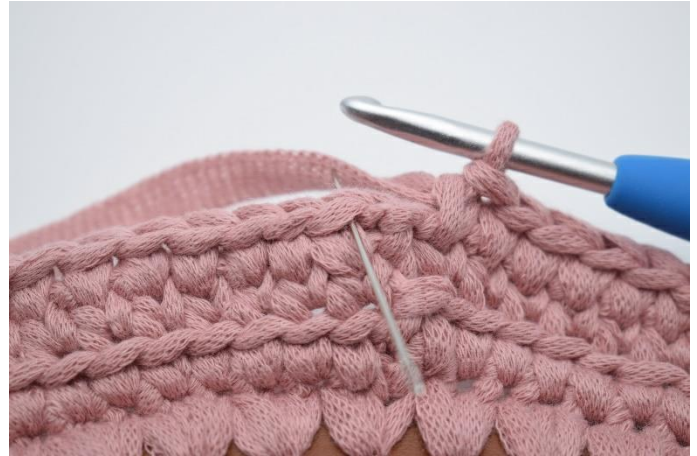
14. Beende mit 1 Kettm in der ersten Masche dieser Runde.