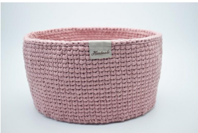
23. Nähe oder klebe evtl. ein schickes "Handmade" Schild fest. Das Schild wird über den Rand vom Korb gefaltet.