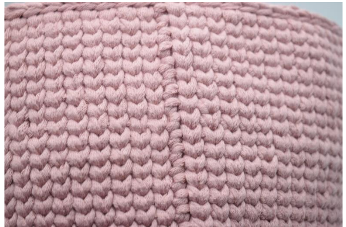
22. Wiederhole wie in der Anleitung beschrieben. Beende mit einer Runde Kettm. Deine Naht wird so aussehen.