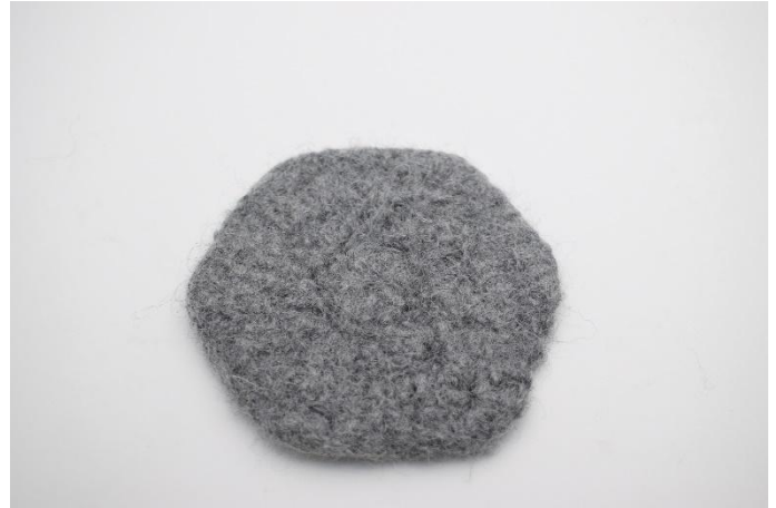
Nach dem Filzen. Grösse ca. 10x11 cm