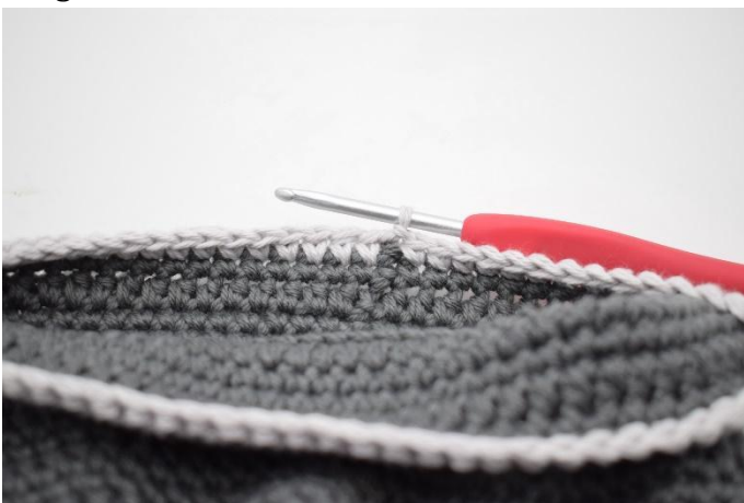
13. Zu einer Kontrastfarbe wechseln. 1 Lm häkeln. Eine Runde fm häkeln, mit 1 Km beenden. Garn trennen und Enden vernähen.