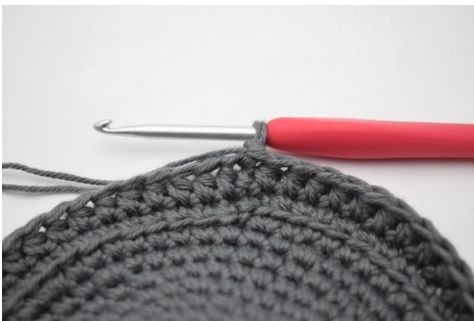
7. 1 Lm häkeln.