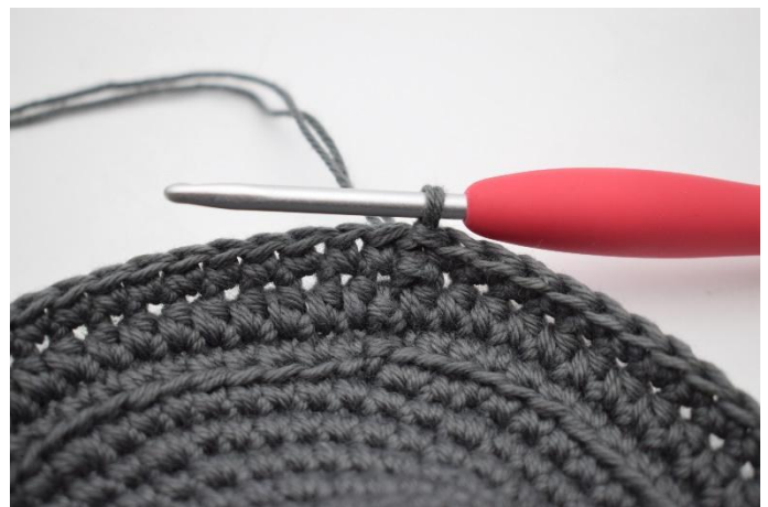
8. Eine Runde fm häkeln, mit 1 Km beenden.