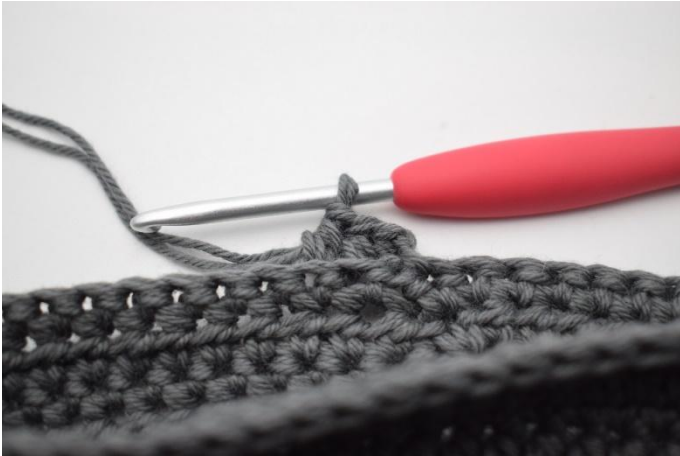
11. 1 Lm häkeln. HStb in das hmg auf der gesamten Runde häkeln,