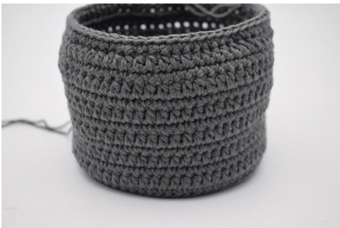
9. Diese 2 Runden wiederholen wie in der Häkelschrift beschrieben.