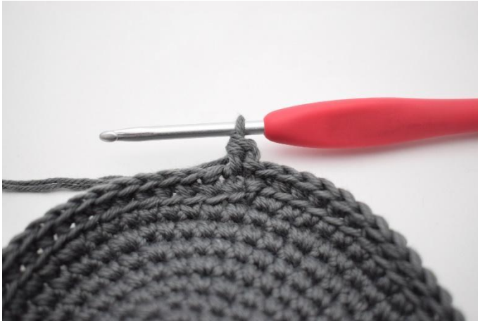
5. 1 hStb häkeln