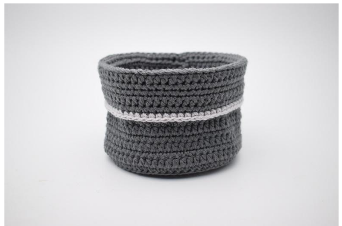
14. Den Umschlag nun über das Körbchen falten und den Aufhänger annähen.