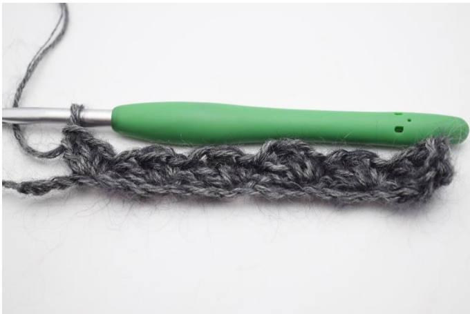
7. 2 Lftm überspringen, "1 fM, 2 Stb" in die nächste Masche häkeln. Wiederhole dies bis zu den letzten 2 Lftm.