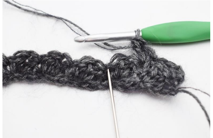
6. 2 Maschen überspringen,