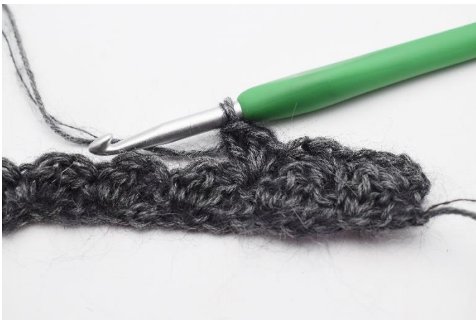
7. "1 fM, 2 Stb in die nächste M" häkeln.