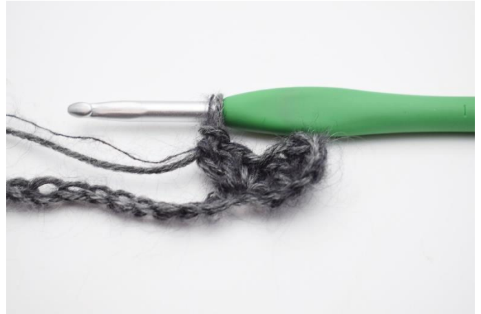
4. "1 fM, 2 Stb" in die nächste Masche häkeln.