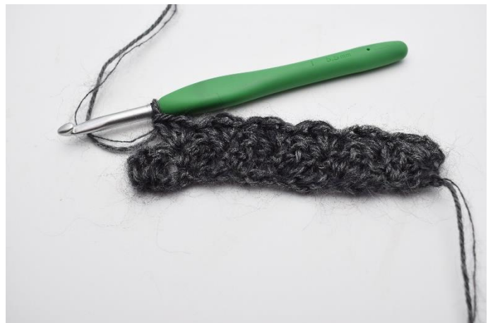
8. "2 Maschen überspringen, 1 fM häkeln, 2 Stb in die nächste M häkeln". Wiederhole von " bis " bis Reihenende.