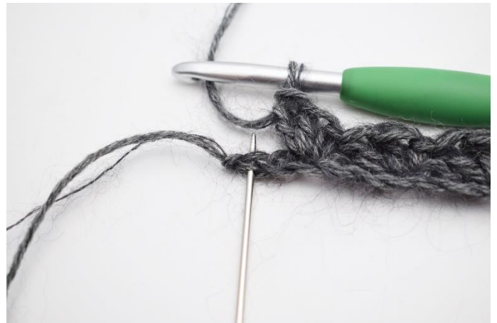
8. 1 Lftm überspringen,