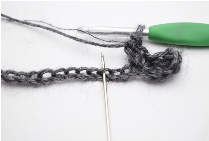
5. 2 Lftm überspringen,