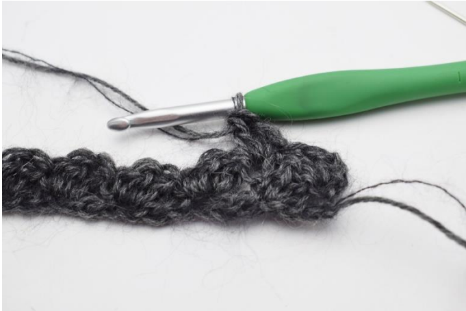
5. "1 fM, 2 Stb in die nächste Masche häkeln".