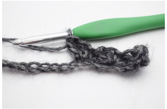
6. "1 fM, 2 Stb" in die nächste Masche häkeln.