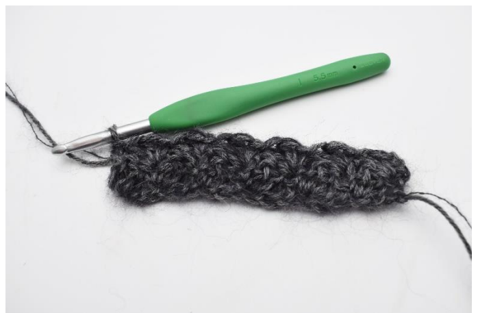
10. 1 fM häkeln.