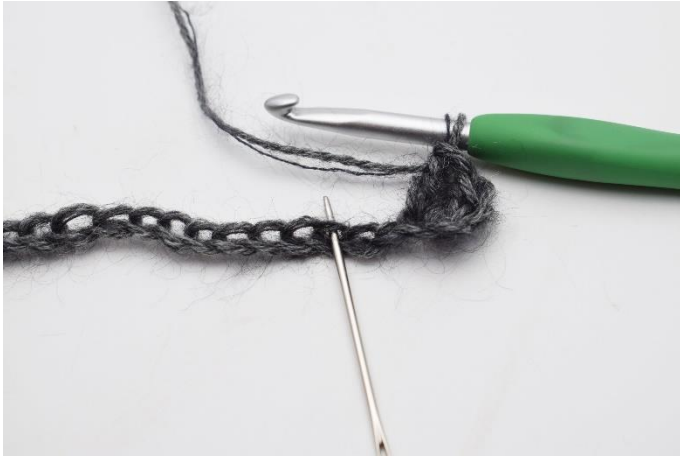
3. 2 Lftm überspringen,