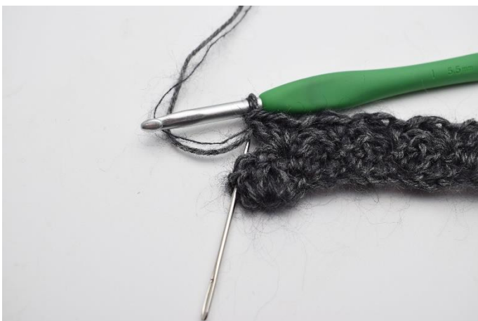
9. In die Wendemasche (die Nadel markiert hier die Wendemasche der vorherigen Reihe)