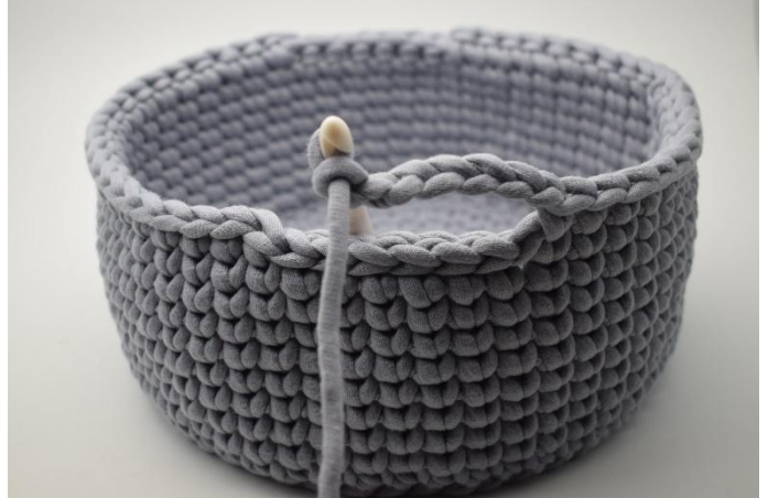
2. 7 lm arbeiten, die 6 km überspringen.