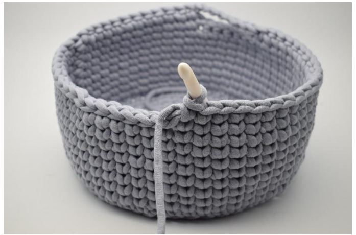
4. Sts in die nächsten 21 m häkeln.