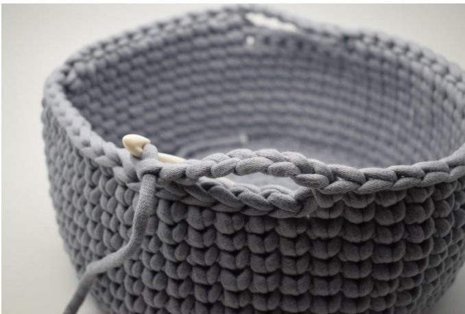
5. 7 lm machen und die 6 km überspringen.