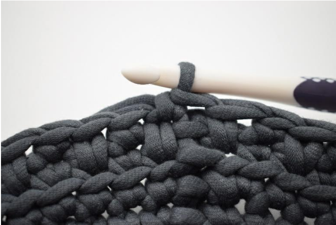
13. Häkle 1 fm in die nächste M.