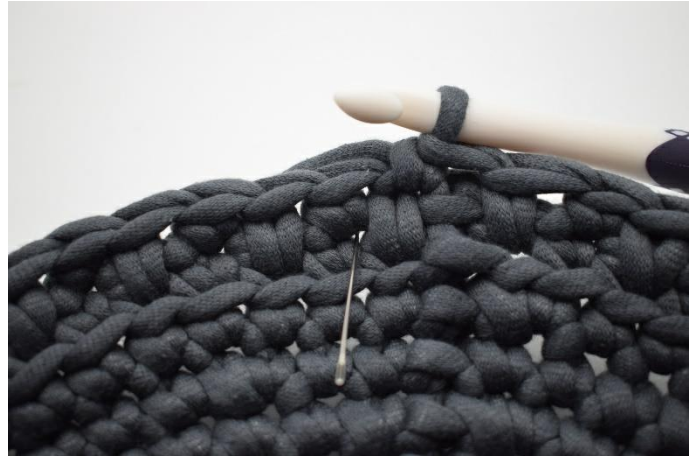
14. Häkle 1 dfm. Die Nadel hier markiert wo die dfm gehäkelt werden muss.