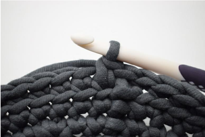
7. So. Jetzt haben wir 1 dfm gehäkelt.