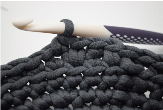
11. Häkle 1 fm in die nächste M.