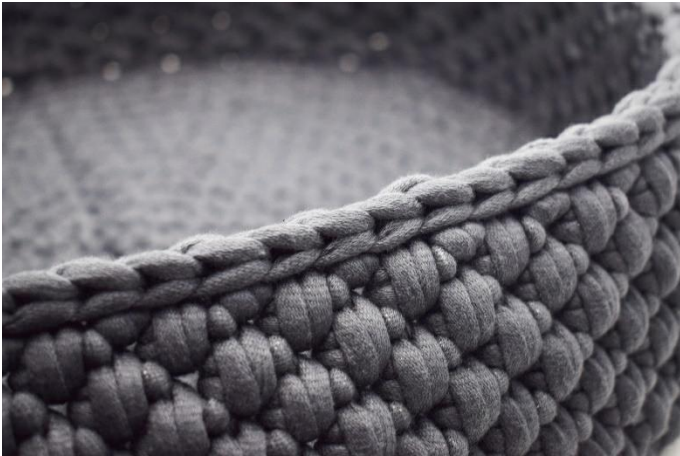
21. Beende mit 1 Runde Kettm. Das Garn abschneiden und vernähen.