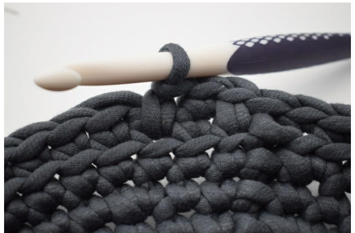
10. So. Jetzt ist 1 dfm gehäkelt.