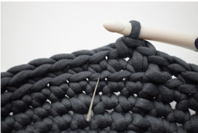
9. Häkle 1 dfm. Die Nadel hier markiert wo die dfm gehäkelt werden muss.