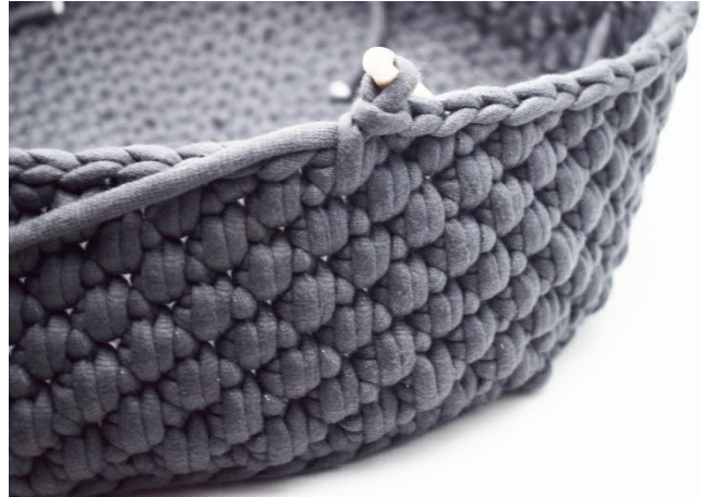
20. Wiederhole die Runden mit abwechselnd fm und dfm bis du insgesamt 8 Runden hast.