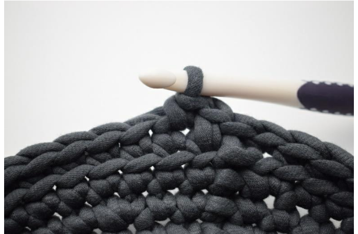
8. Häkle 1 fm in die nächste M.