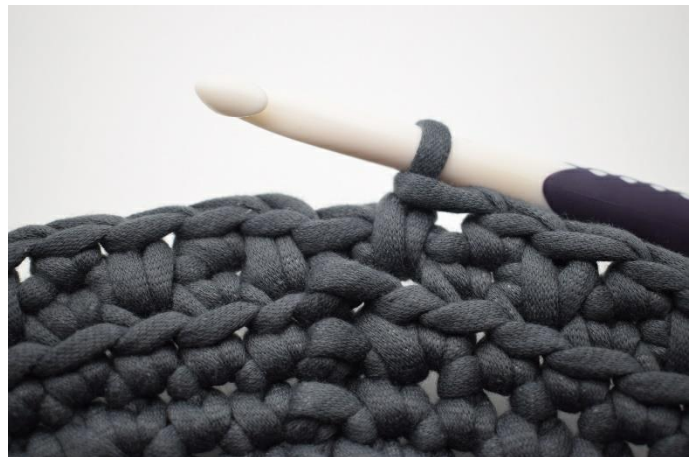
12. Wiederhole " 1 dfm, 1 fm" die ganze Runde. Beende mit 1 dfm.