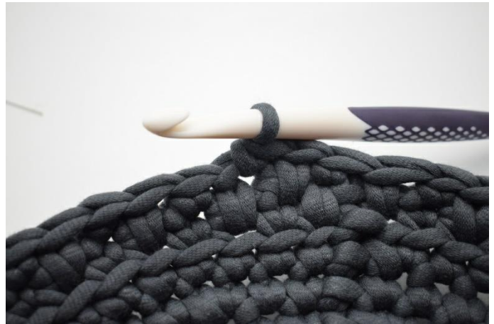
16. Häkle 1 fm.