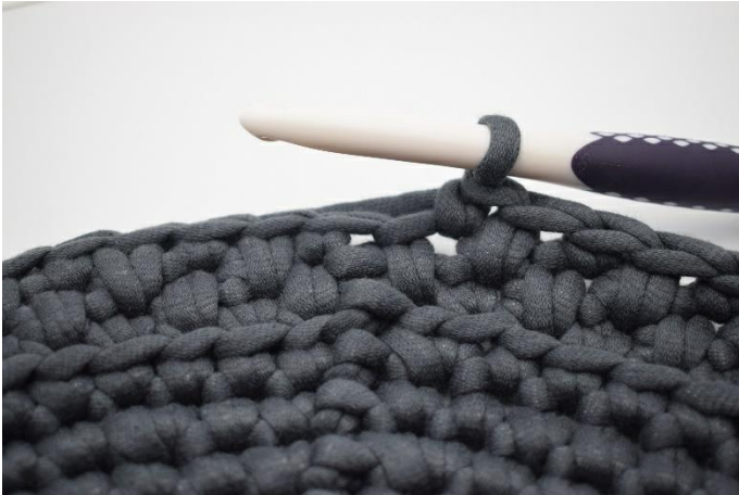
19. Wiederhole " 1fm, 1dfm" die ganze Runde. Beende mit 1 fm.