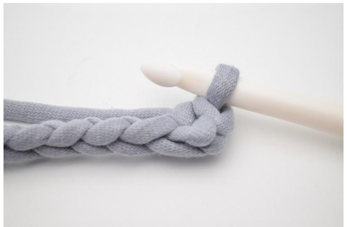
4. Genau so.