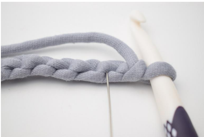
3. Um eine schöne Kante zu erhalten, kann man am besten fm in die waagrechten Maschenglieder häkeln. Die Nadel hier zeigt, in welches Maschenglied die erste fm gehäkelt wird.