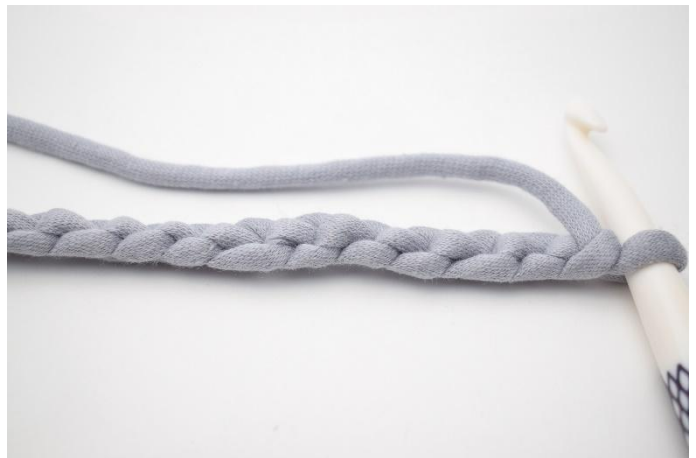
2. Die LM Kette so drehen, dass die "Rückseite" nach oben zeigt.