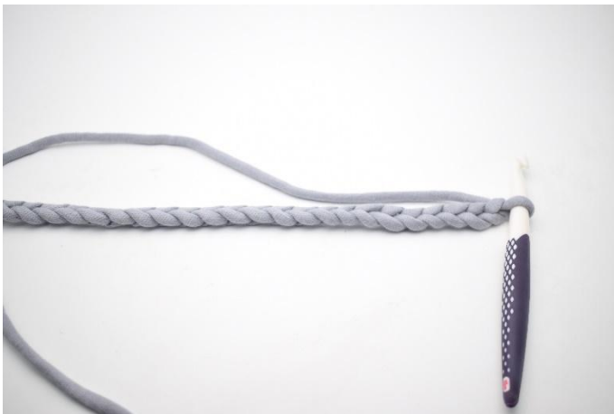
1. Die Luftmaschen aufschlagen.