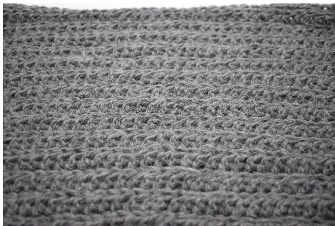
6. Reihe 2 wiederholen bis 27 Rh gehäkelt sind.