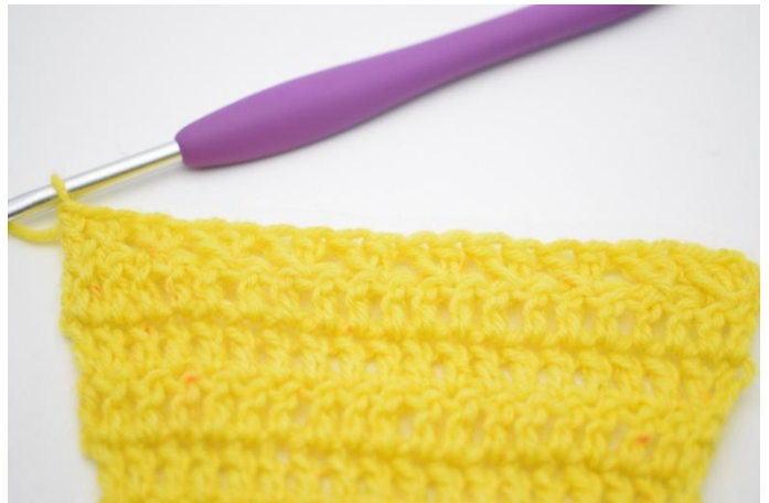
12. Genau so.

22. Jetzt wird eine Rh Stb mit Zunahme wie vorher gehäkelt. Mit 3 Lm wenden. 1 Stb in die erste M und alle folgenden M häkeln. (23)