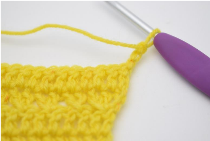
1. Mit 3 lm wenden.

Mit 3 lm wenden. *1m überspringen und 1 Stb in die nächste M häkeln. 1 Stb in die M häkeln, die gerade übersprungen wurde*. Von * bis * auf der Reihe wiederholen, es bleibt 1 M übrig, in diese 1 Stb häkeln. (24)