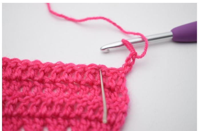
2. 2 m überspringen