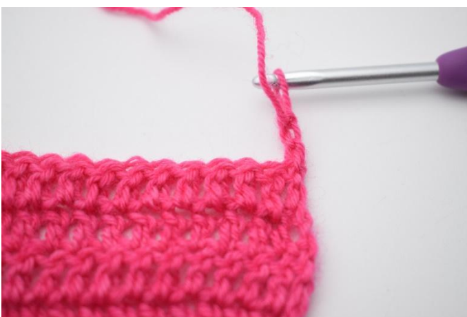
1. Mit 3 lm wenden.

99. Mit 3 lm wenden. 2 m überspringen und 1 Stb in die nächste M häkeln. 1 Stb in die M daneben häkeln, die gerade übersprungen wurde. * 1 m überspringen und 1 Stb in die nächste M häkeln. 1 Stb in die M häkeln, die gerade übersprungen wurde.* Von * bis * auf der Reihe wiederholen, bis 2 M übrig sind. 1 m überspringen und 1 Stb in die letzte M häkeln. (94)