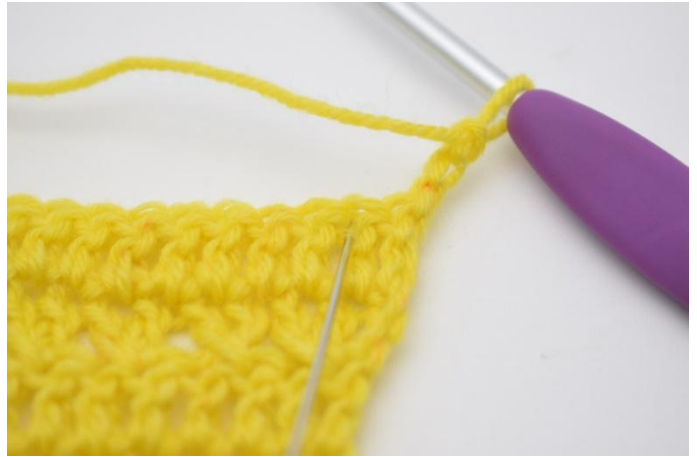
2. 1m überspringen,