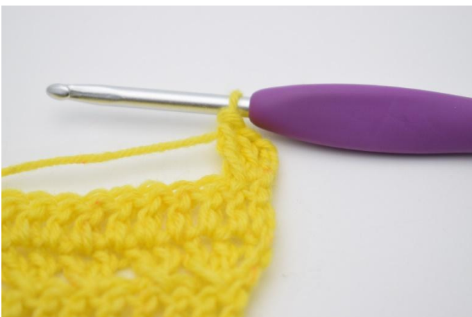
5. Genau so.