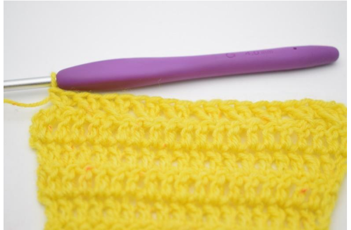
10. Die gekreuzten Stb wiederholen, bis noch 1 M übrig ist.