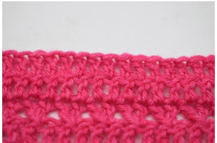
4. Die Reihe mit Stb fortsetzen.

98. Mit 3 lm wenden. Die 2 nächsten M zusammenhäkeln. Die Reihe mit Stb fortsetzen. (95)