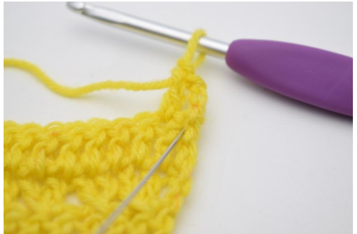
4. 1 Stb in die M häkeln, die gerade übersprungen wurde.