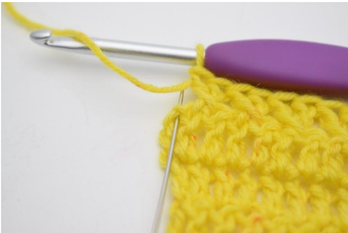
11. 1 Stb in die letzte M häkeln.