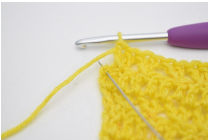
11. 1 Stb in die letzte M häkeln.