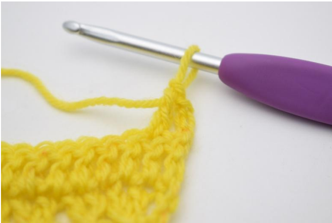
3. 1 Stb häkeln.