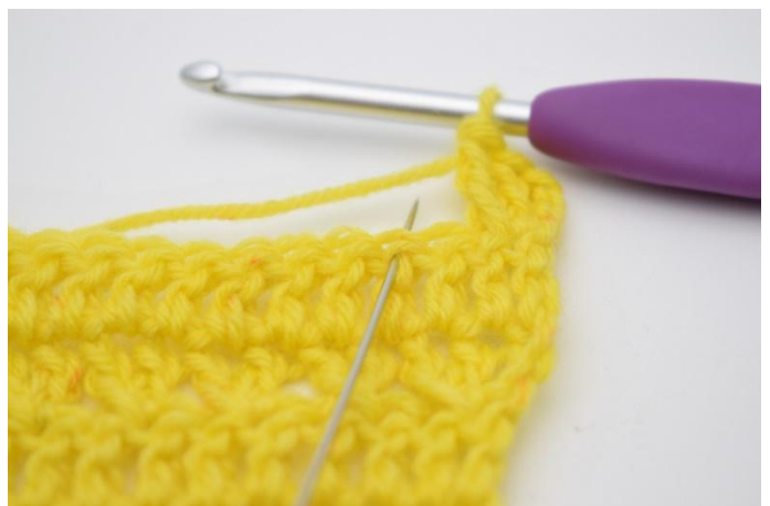
6. 1m überspringen,