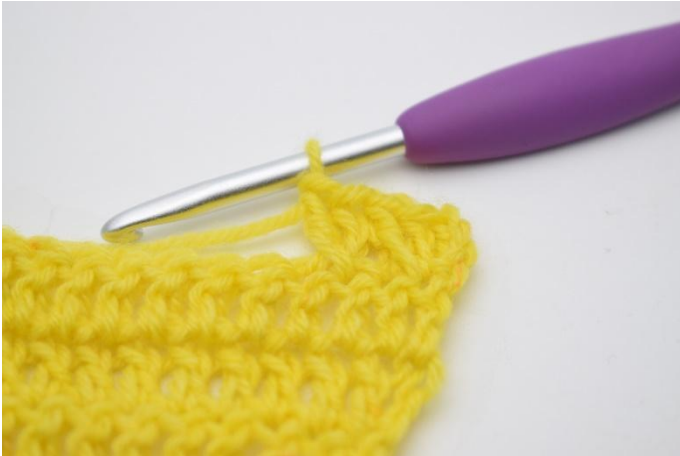
9. Genau so.