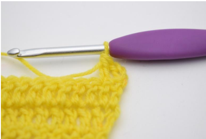
3. 1 Stb häkeln.