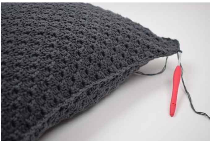
11. Weiterhäkeln, bis das Kissen ganz geschlossen ist. Mit 1 km beenden.