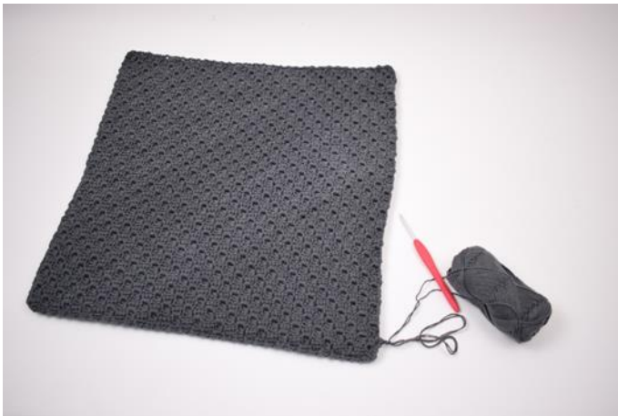
9. Rund um das Kissen wiederholen.