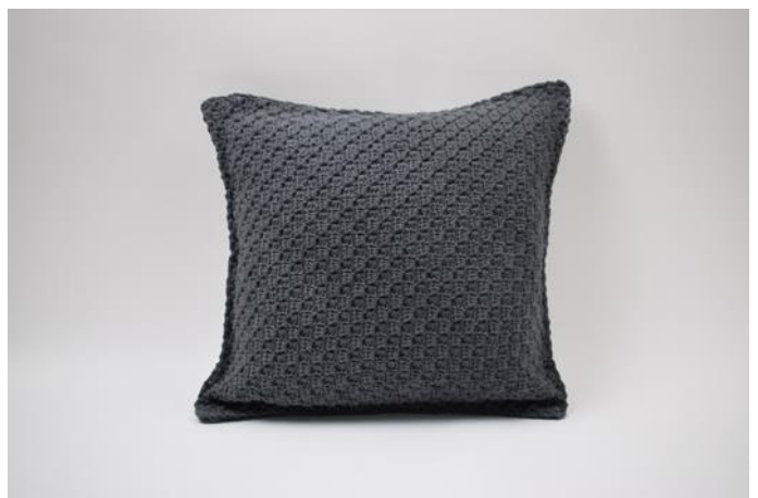
12. Den Faden trennen und die Enden vernähen.