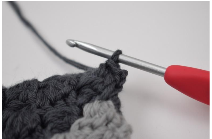
4. 1 fm in die Ecke häkeln