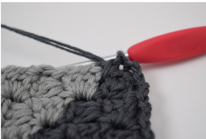
7. So weiter häkeln bis zur nächsten Ecke an der Fb. A und B zusammentreffen. Hier zu Fb. B wechseln.