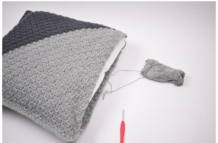
10. Das Füllkissen in das Kissen packen, bevor es ganz geschlossen wird.