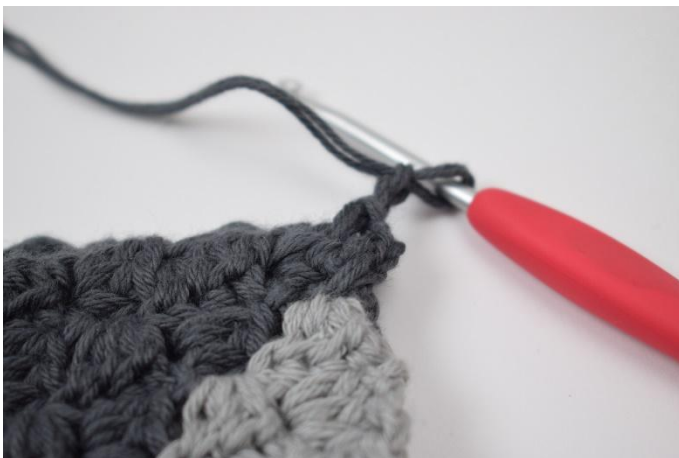
5. 2 lm bilden.