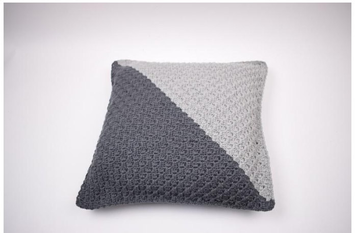
12. Den Faden trennen und die Enden vernähen.