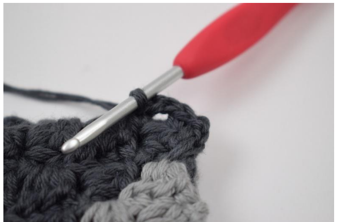
6. 1 fm zwischen die nächsten beiden "Vierecke" häkeln.