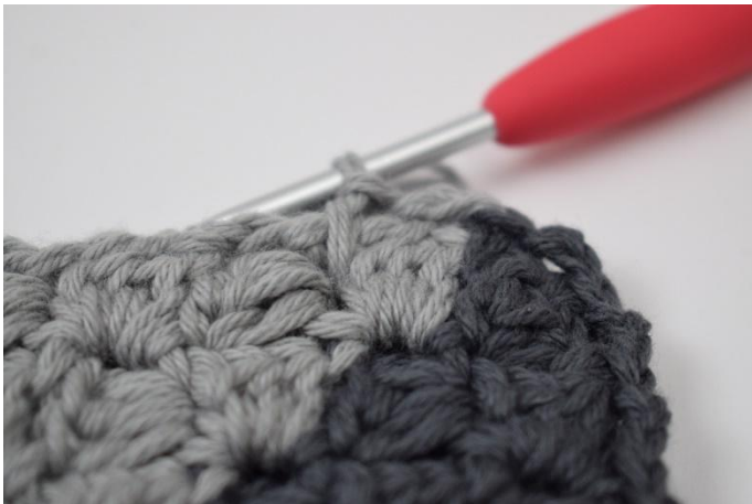
9. Weiter mit Fb. B um das Kissen häkeln.