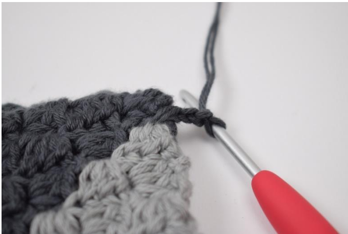
3. 2 lm häkeln.