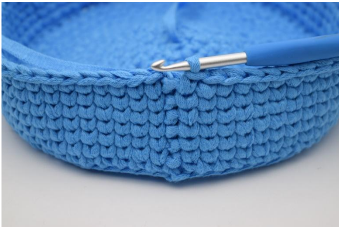
15. Die Runden mit Sts entsprechend der Angaben in der Häkelschrift wiederholen.