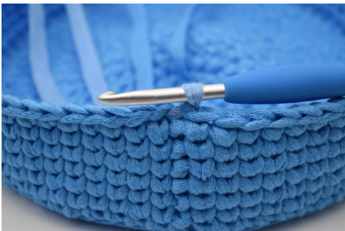
17. Genaus so.