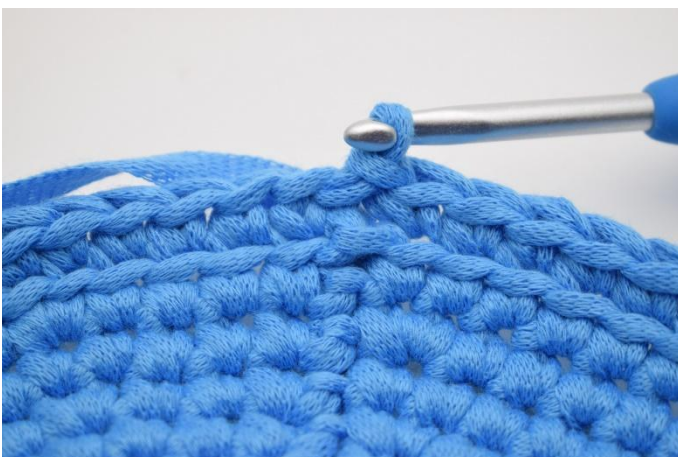
5. 1 Runde fm in das hMg häkeln, mit 1 Km beenden.