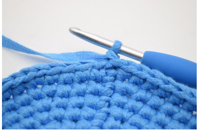
2. Mache 1 Lm.