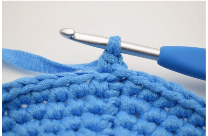
4. So, jetzt ist 1 fm in das hMg gehäkelt.