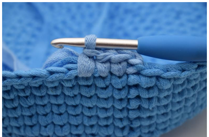
18. Mit Fb. 2 und 3 weiterhäkeln, wie in der Häkelschrift beschrieben.