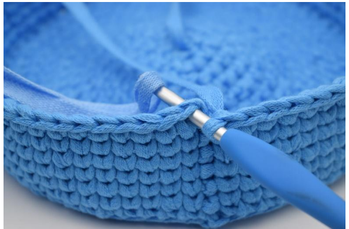
16. Wechsel zu Fb. 2 mit dem letzten Durchzug wenn du die Runde mit Fb. 1 abschließt.