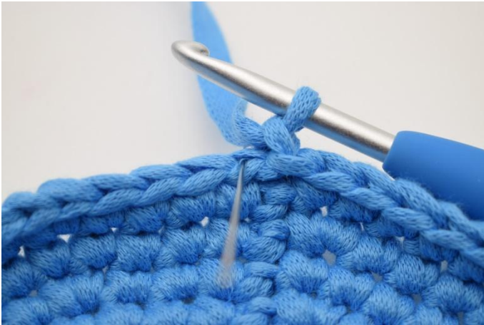
3. Jetzt fm in das hMg häkeln. Das ist das Maschenglied, auf das die Nadel zeigt.