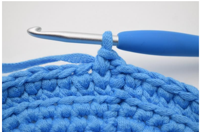
14. Genaus so. Die Runde Sts häkeln und mit 1 km abschließen.