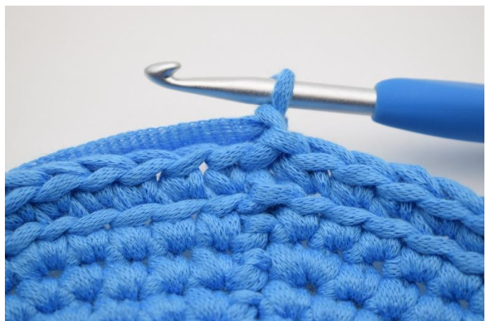
6. 1 Lm machen.