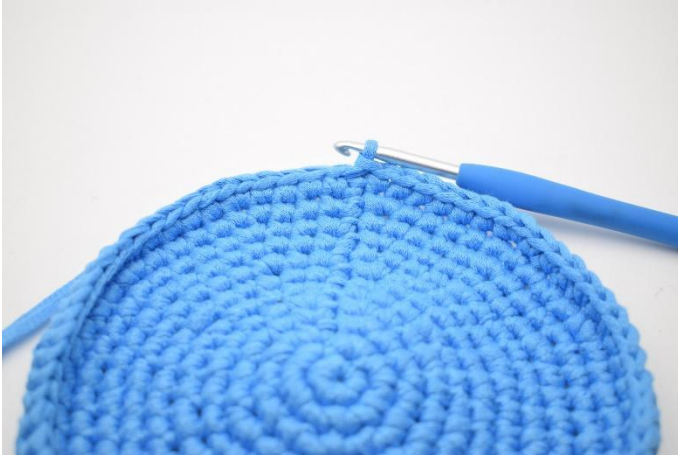
1. Hier enden die Zunahmen