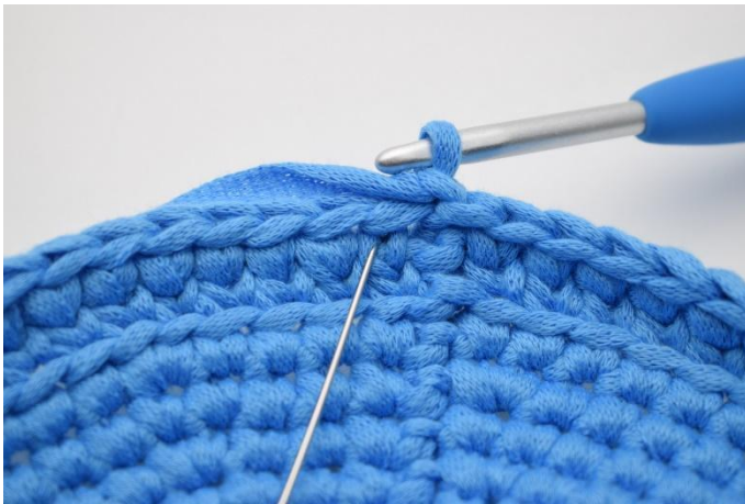
13. Wieder 1 Sts häkeln. Die Nadel markiert hier das erste "v" in das gehäkelt wird.