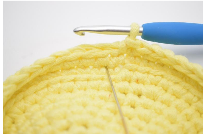
6. Jetzt wird das Muster mit abwechselnd 1 tfM und 1 fM gehäkelt. Das macht man folgendermaßen: 1 tfM häkeln. Das ist eine normale fM, die nur tief gehäkelt wird. Das bedeutet, dass sie in die fM der vorigen Runde gehäkelt wird. Die Nadel zeigt, wo gehäkelt wird.