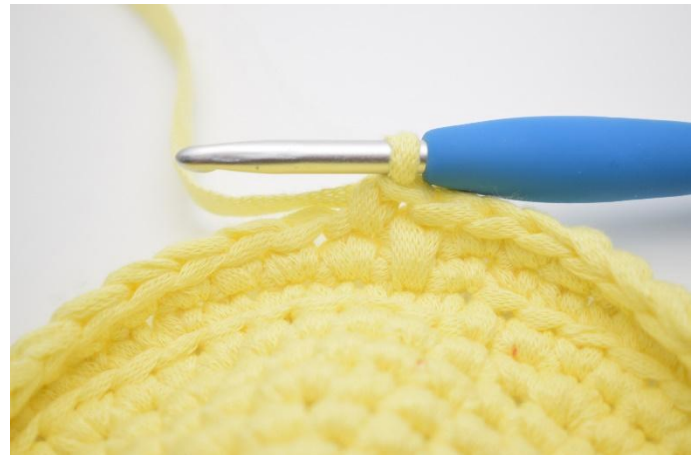
2. Jetzt eine normale fM in die Masche daneben häkeln.