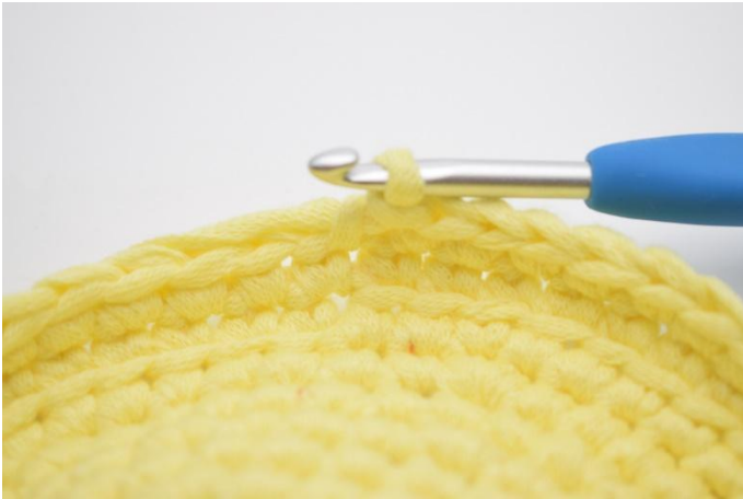
5. 1 Runde fM häkeln.