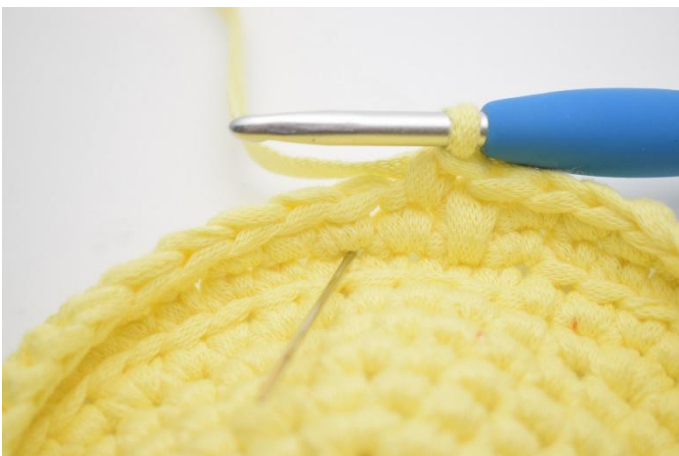
3. Jetzt wieder eine tfM häkeln. Die Nadel zeigt wieder, wo die tfM gehäkelt wird.