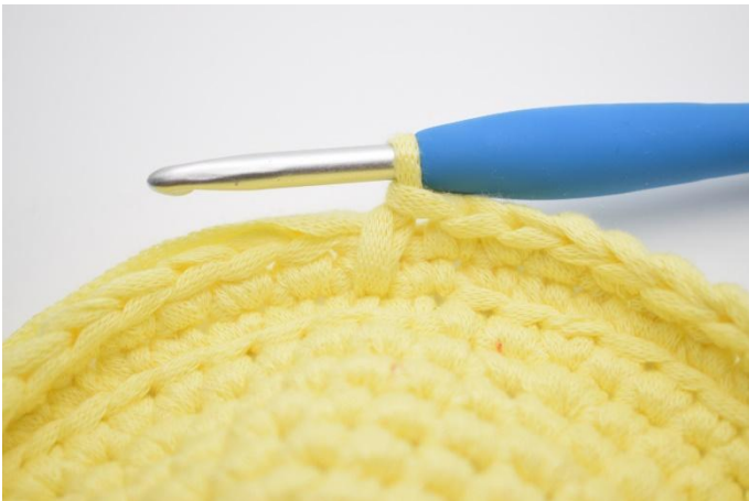
1. So, jetzt ist eine tfM gehäkelt..