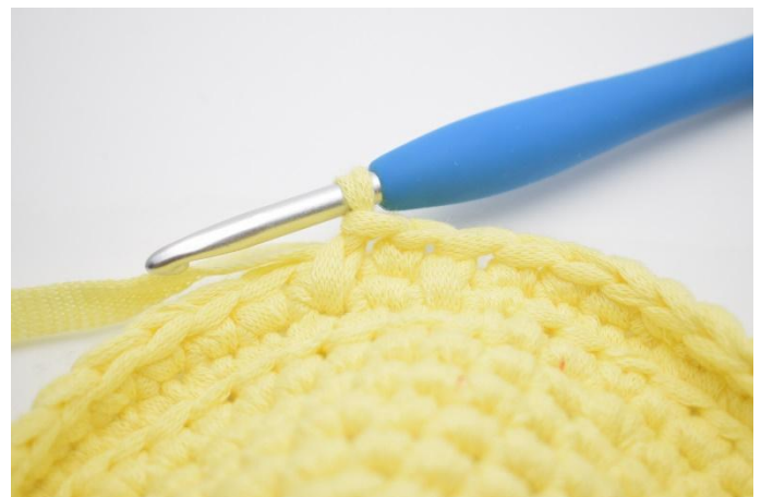
4. Genau so.