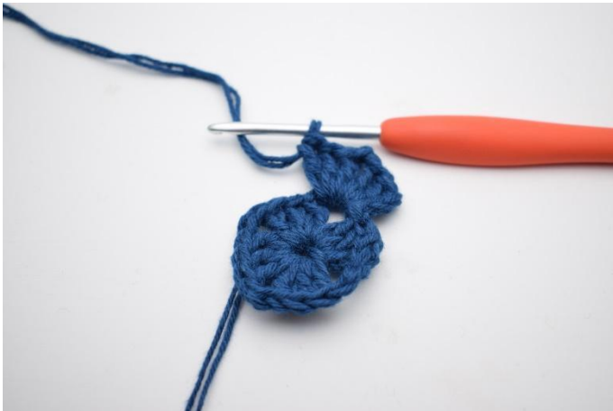
3. Häkle 3 lm, 2 Stb, 2 lm und 3 Stb in den Lm-Bogen.