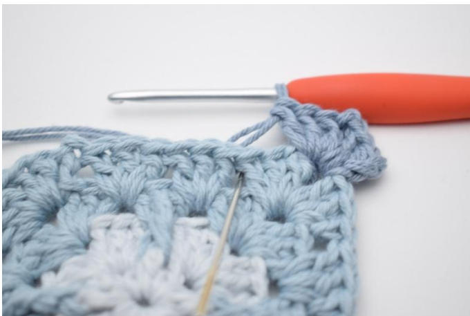
3. In die nächsten 3 Lm-Zwischenräume werden 1 Stb, 1 Rel-DpStbvo um das mittlere Stb in der Stb-Gruppe von der 3. Runde und 1 Stb gehäkelt.