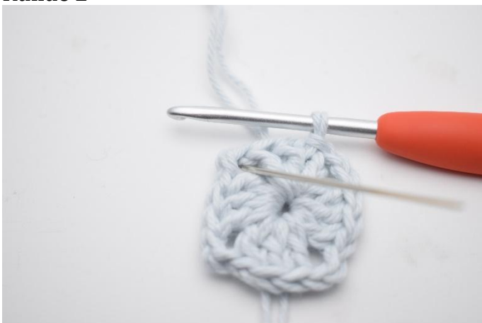
1. Km hin zum Lm-Bogen häkeln.