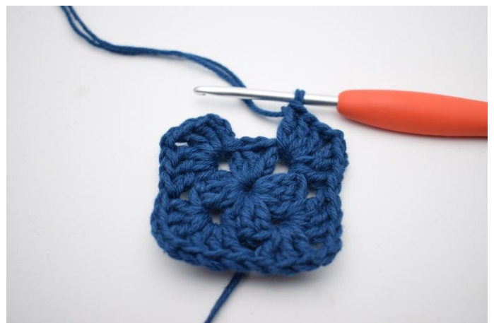
6. Wiederhole *-* insgesamt 3 mal.