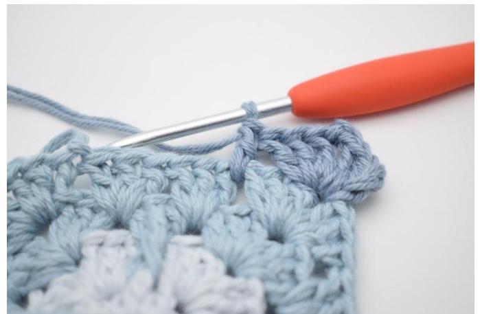
4. Jetzt ist 1 Stb in den Zwischenraum gehäkelt.