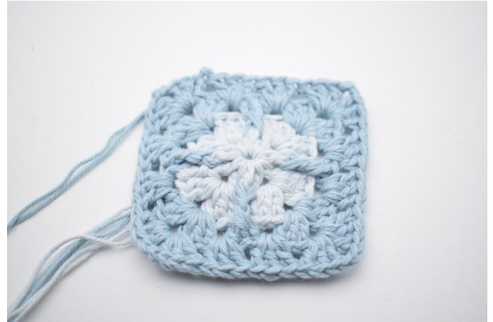
10. Mit 1 Km beenden. Faden trennen.