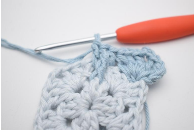
9. Genau so.