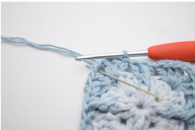
1. Km zum Lm-Bogen häkeln