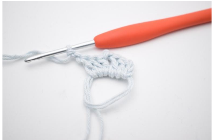
4. *3 Stb und 2 lm, häkeln*.