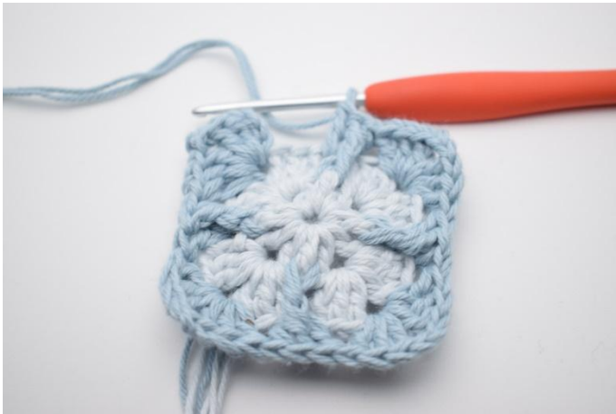
11. Dabei *-* insgesamt 3 mal wiederholen