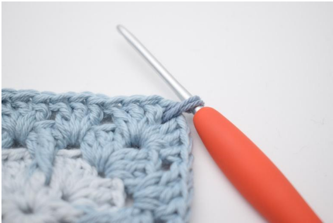
1. Mit Farbe C in einem Lm-Bogen beginnen.