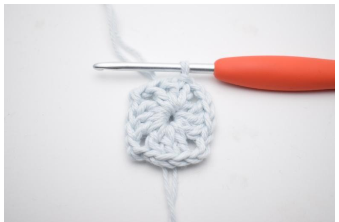
6. Mit 1 Km beenden.