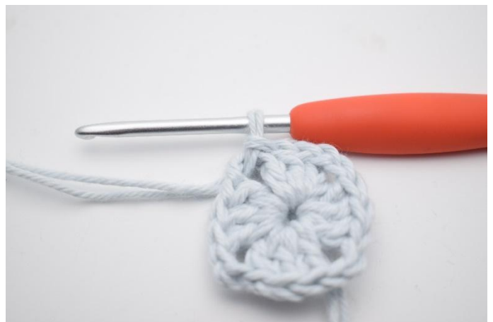
2. Genau so.