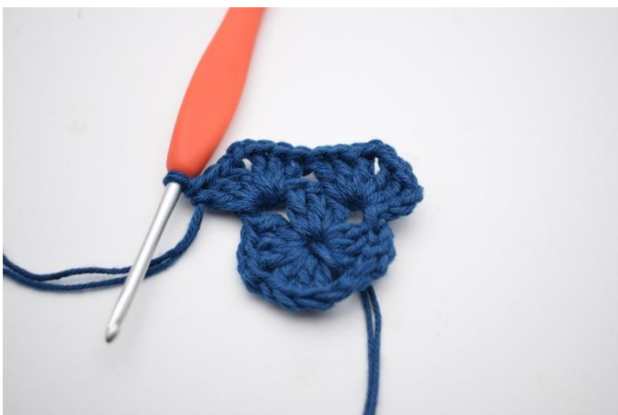
5. Genau so.