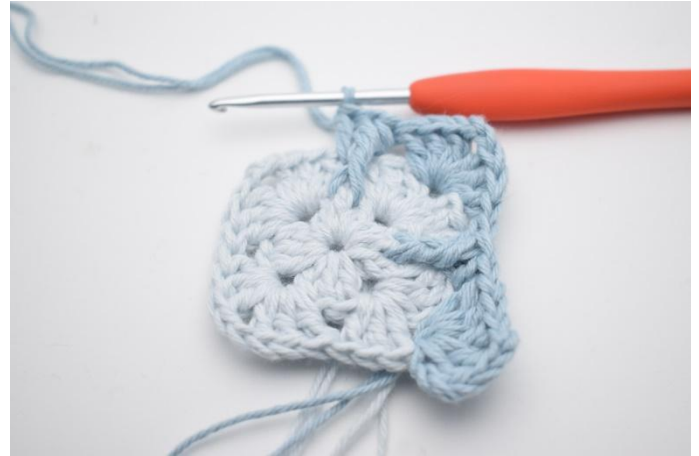
10. *3 Stb, 2 lm, 3 Stb, in den nächsten Lm-Bogen. In den nächsten Lm-Zwischenraum werden 1 Stb, 1 Rel-DpStbvo um das mittlere Stb in der Stb-Gruppe von der 1. Runde und 1 Stb* gehäkelt.