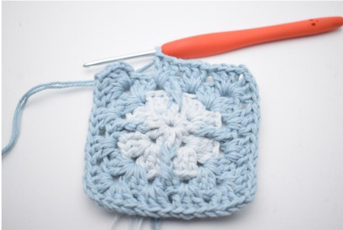
9. Wiederhole *-* insgesamt 3 mal.