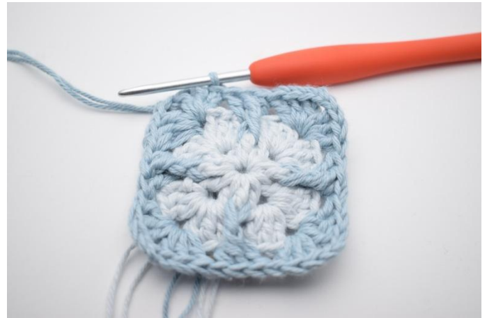
12. und mit 1 km beenden.