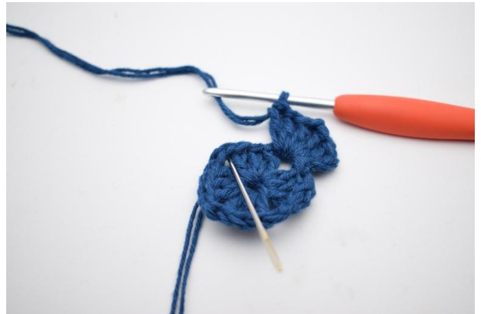
4. *3 Stb, 2 lm und 3 Stb in den nächsten Lm-Bogen* häkeln..