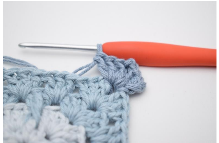
2. 3 lm, 2 Stb, 2 lm und 3 Stb in den Lm-Bogen häkeln.