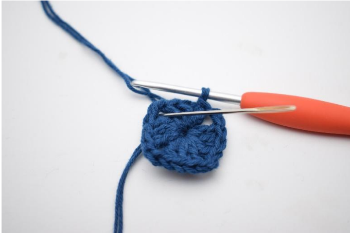
1. Km zum Lm-Bogen häkeln.