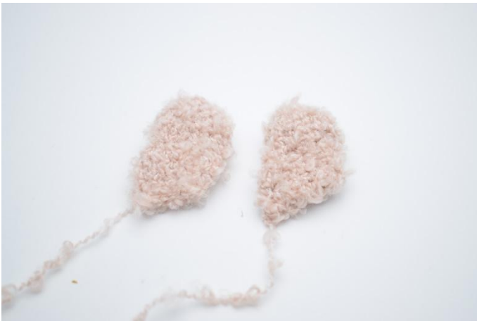
1. Die Flügel sind jetzt fertig zum montieren.

Falte die Flügel flach und häkle sie unten zusammen.