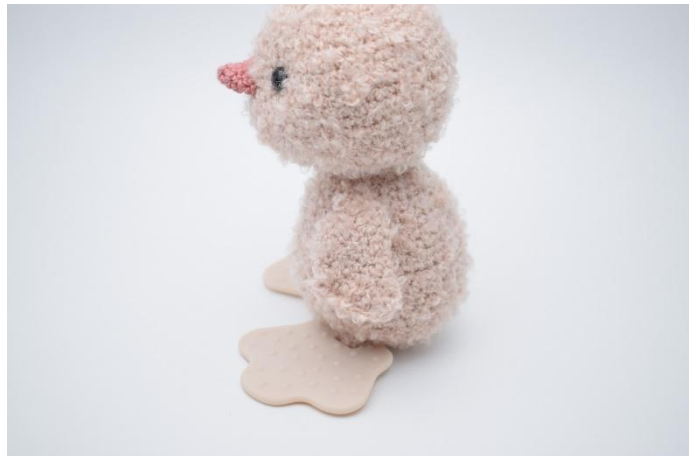
2. Nähe den einen Flügel fest auf der Seite, ca. 3 Runden tief am Körper.