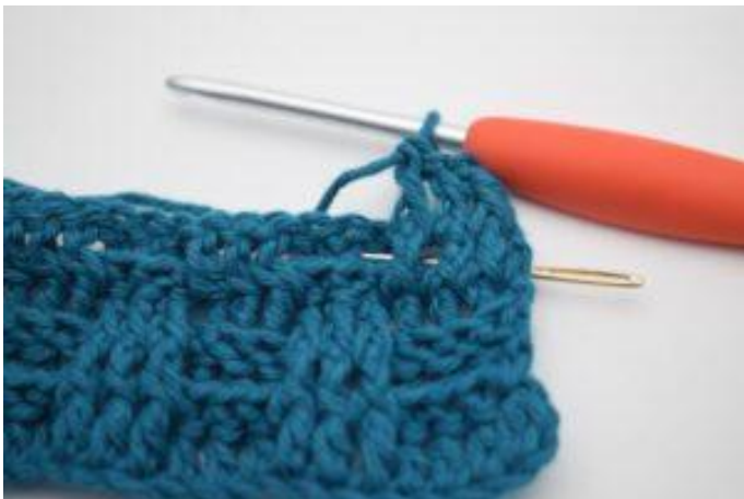
5. 1 ReStbhi um das nächste Stäbchen.