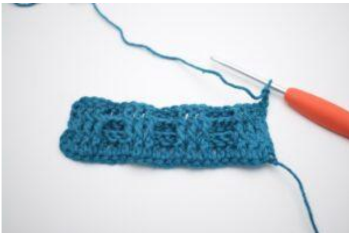
1. Mit 2 lm wenden.