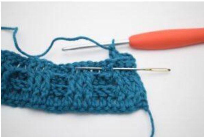
5. 1 ReStbvo um das nächste Stäbchen.