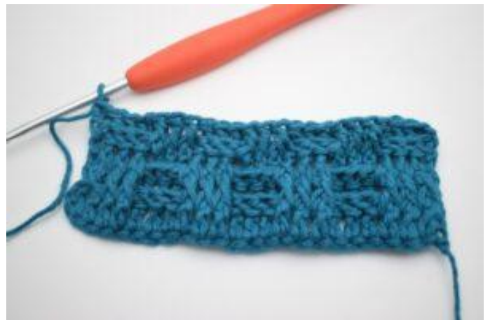
8. Im Wechsel 3 ReStbhi und 3 ReStbvo auf der gesamten Reihe häkeln. Die Reihe endet mit 3 ReStbhi. 1 normales Stb in die letzte m häkeln.