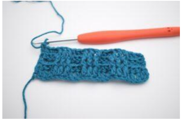
8. Im Wechsel 3 ReStbhi und 3 ReStbvo auf der gesamten Reihe häkeln. Die Reihe endet mit 3 ReStbhi. In die letzte m wird ein normales Stb gehäkelt.