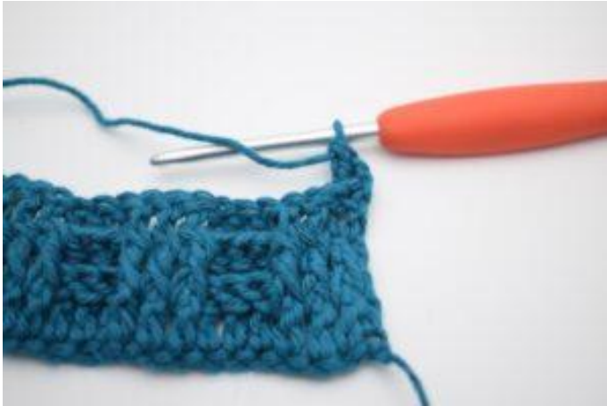
3. Genau so.