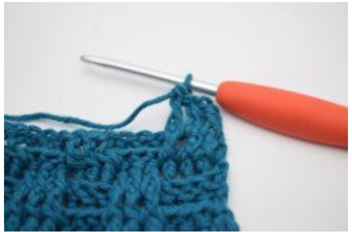
4. 1 ReStbvo um die nächsten 2 Stäbchen.