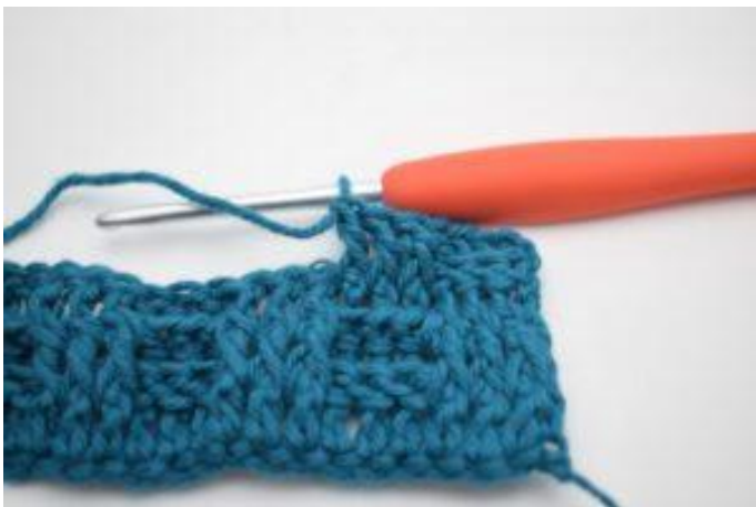
7. 1 ReStbvo um die nächsten 2 Stäbchen.