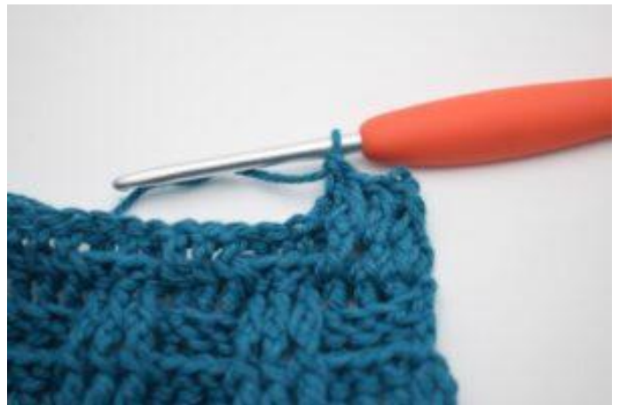
6. Genau so.