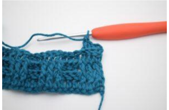
4. 1 ReStbhi um die nächsten 2 Stäbchen.