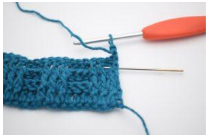
2. 1 ReStbhi um das erste Stäbchen.