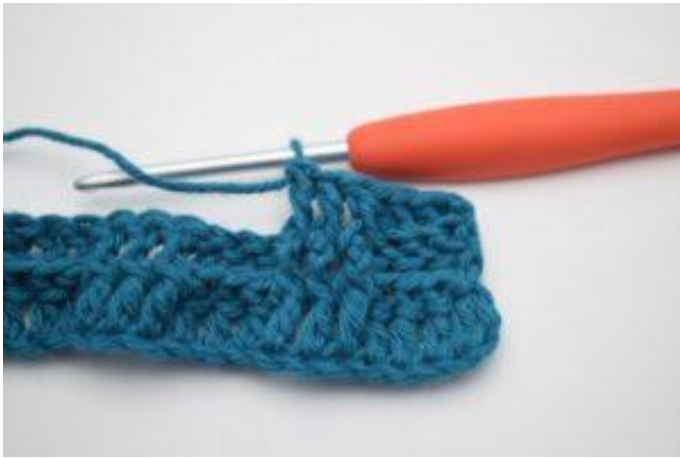
7. 1 ReStbvo um die nächsten 2 Stäbchen häkeln.