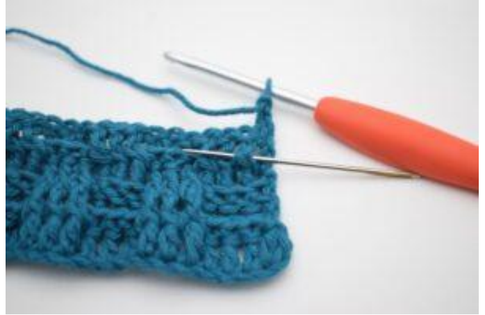
2. 1 ReStbvo um das erste Stäbchen.