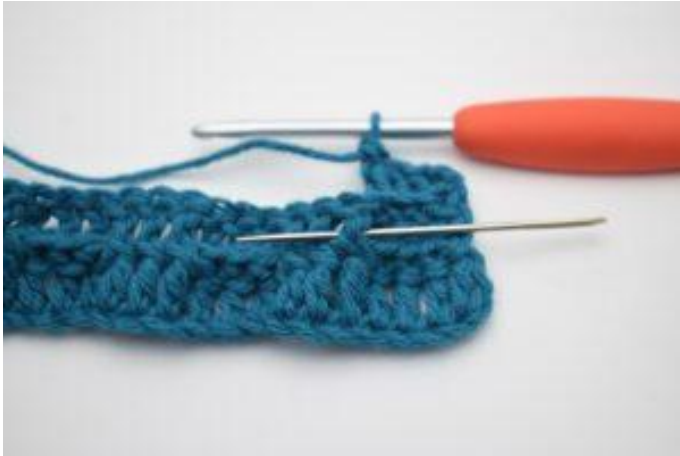
5. 1 ReStbvo um das nächste Stb häkeln.