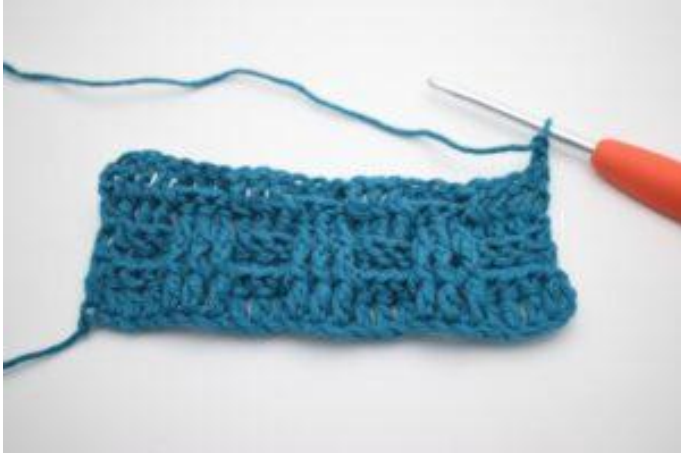
1. Mit 2 lm wenden.