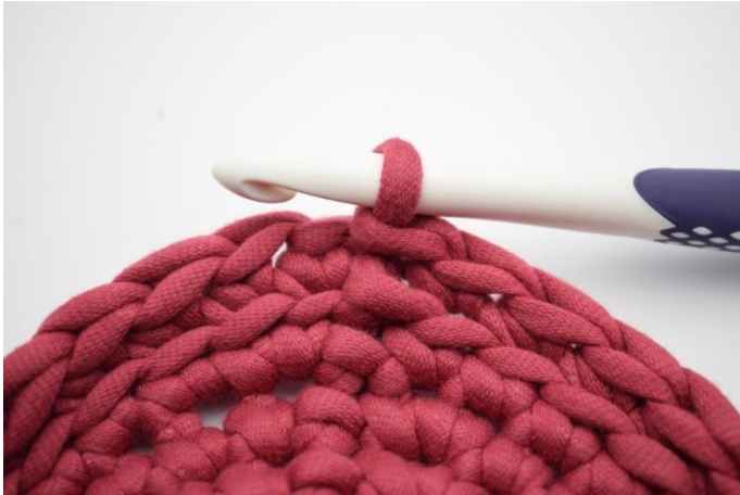
7. Auf der Runde wiederholen und mit 1 km beenden.