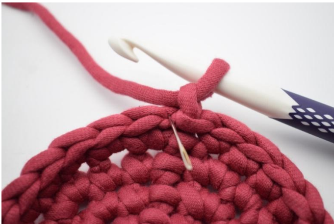
3. In dieser Runde werden fm in das hMg gehäkelt. Die Nadel zeigt hier wo gehäkelt wird.