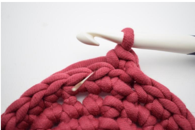
5. 1 fm in das hMg der nächsten M häkeln. Die Nadel zeigt hier, in welches Maschenglied gehäkelt wird.