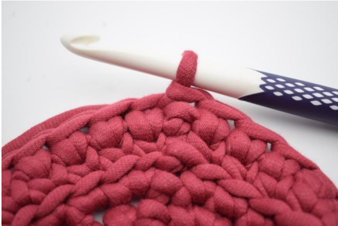
13. Auf der Runde wiederholen und mit 1 km beenden.