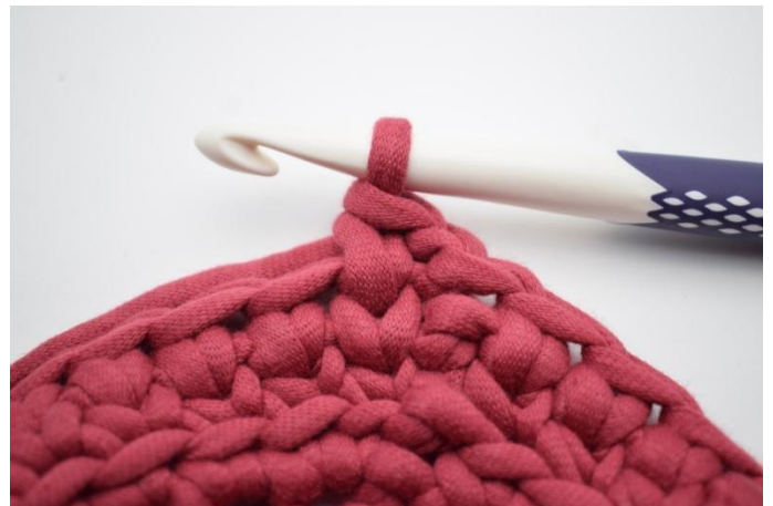
16. Genau so.