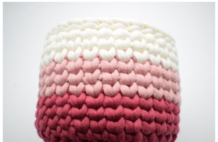
18. Wiederhole dieses Vorgehen mit Farbwechseln wie in der Häkelschrift beschrieben. Beende mit 1 Runde Km. Faden trennen und Fäden vernähen.