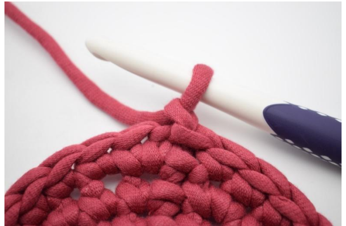
2. Bilde 1 lm.