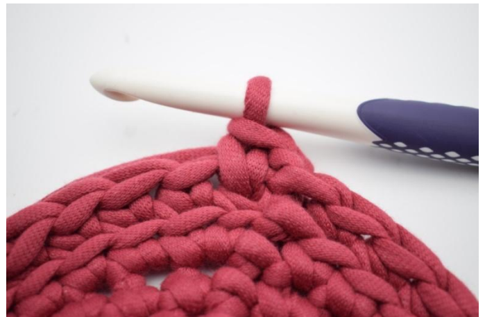
10. So. Jetzt ist ein Ks gehäkelt.