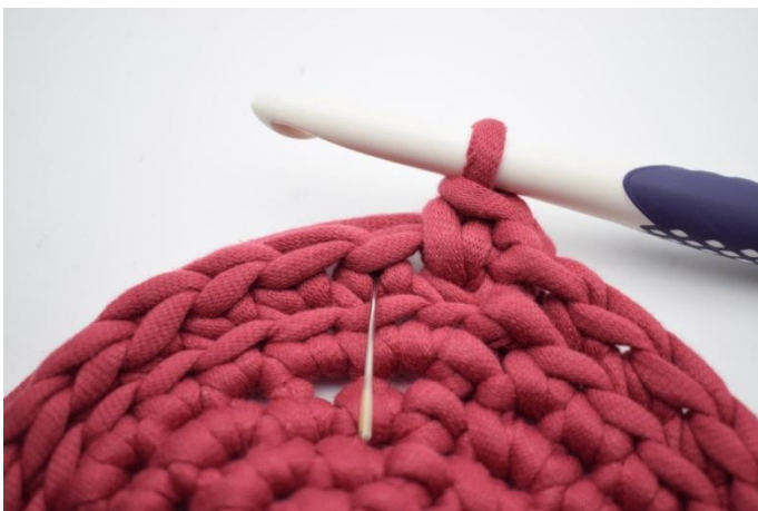
11. 1 Ks in das nächste "V". Die Nadel zeigt, wo der nächste Ks gehäkelt wird.