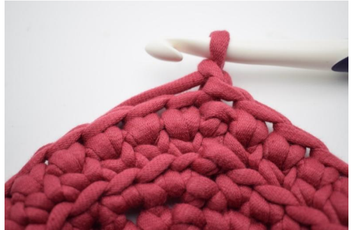
14. So werden die Runden wiederholt. Bilde 1 lm.