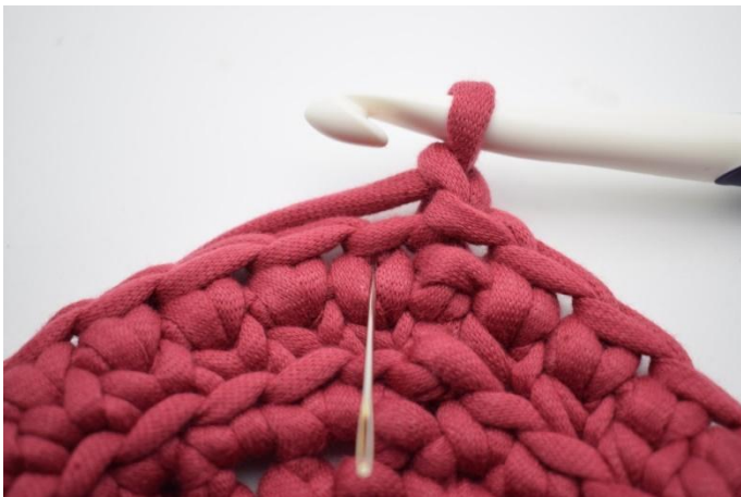
15. Häkle 1 ks in das erste "v".