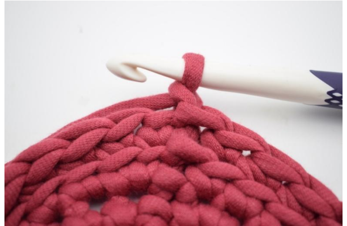
8. Bilde 1 lm.