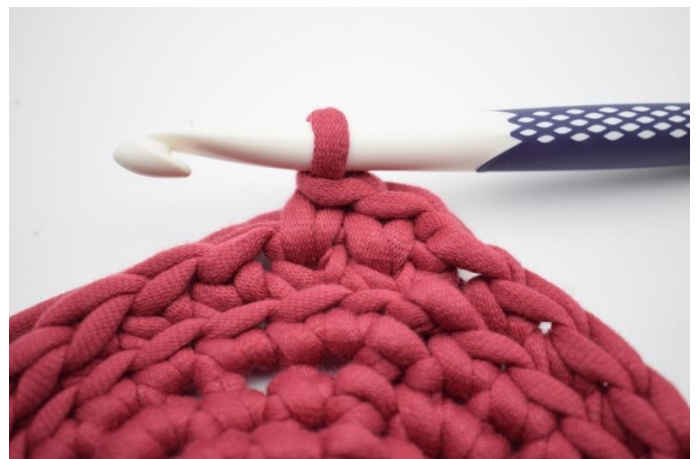
12. Genau so.