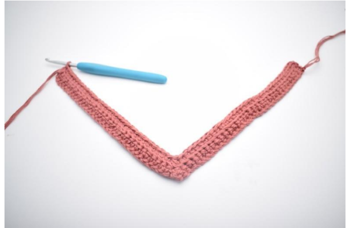
12. 1 fm in die letzten 32 m häkeln.