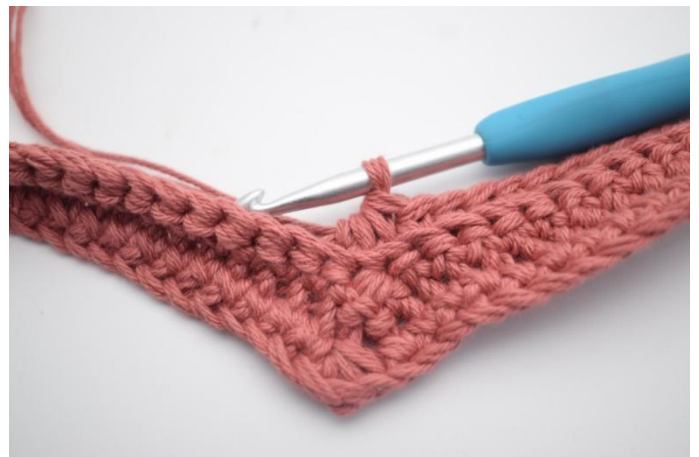
16. Die nächsten 3 m zusammen zu einer.