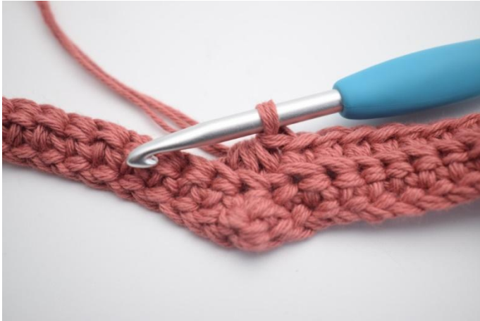
11. Die nächsten 3 m zusammen zu einer.