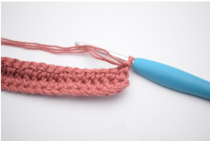
13. Mit 1 lm wenden.