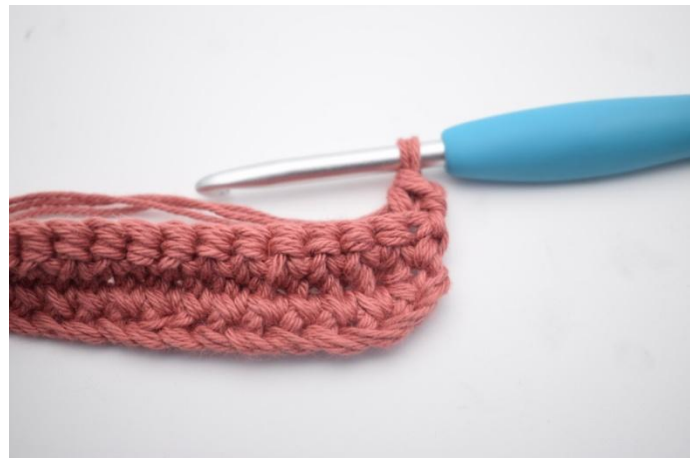
14. 1 fm in das hMg häkeln.