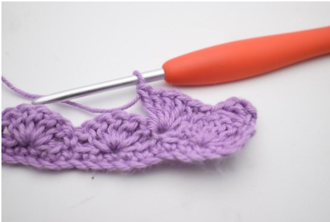
7. 5 Stb in die nächste häkeln.