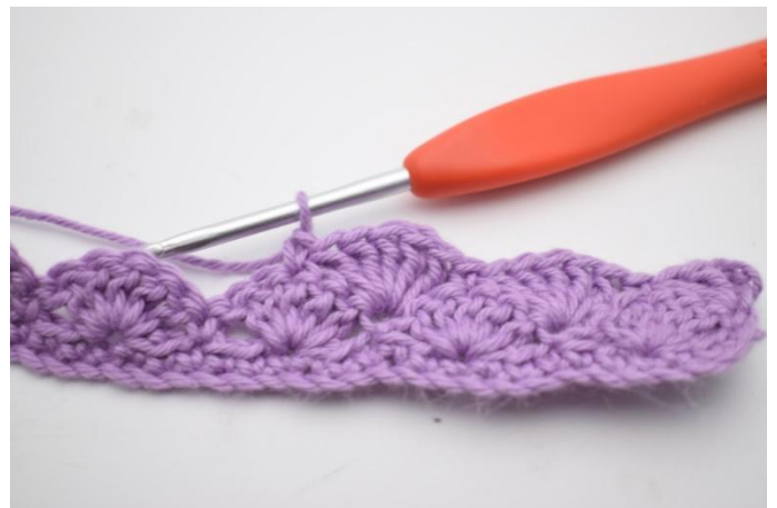
10. 2 M überspringen, 5 Stb in die nächste M häkeln, 2 M überspringen und 1 fm in die nächste M häkeln.