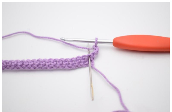
2. 2 Stb in die erste M häkeln.