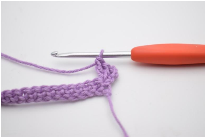
3. Genau so.