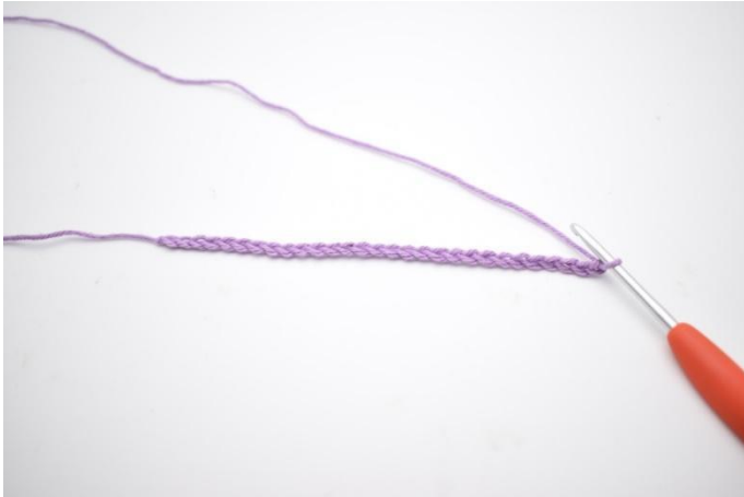
1. 77 Lm häkeln.