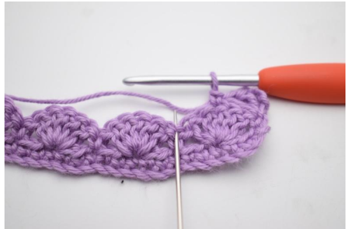
6. 2 M überspringen.