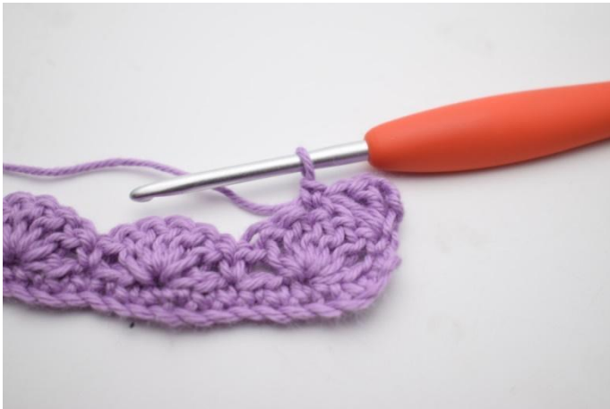
5. Genau so.