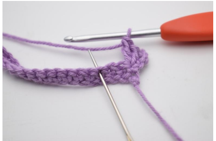
4. 2 M überspringen.