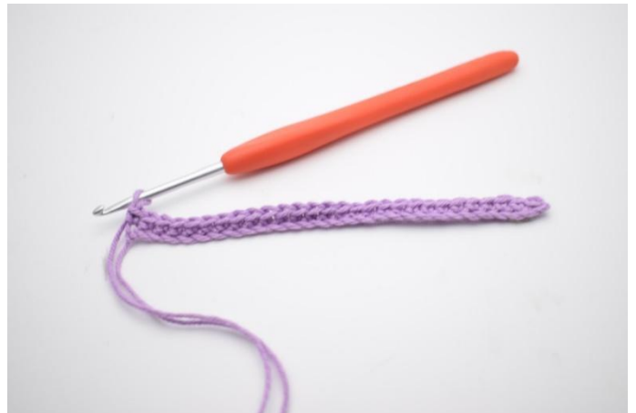
4. 1 Reihe fm häkeln.