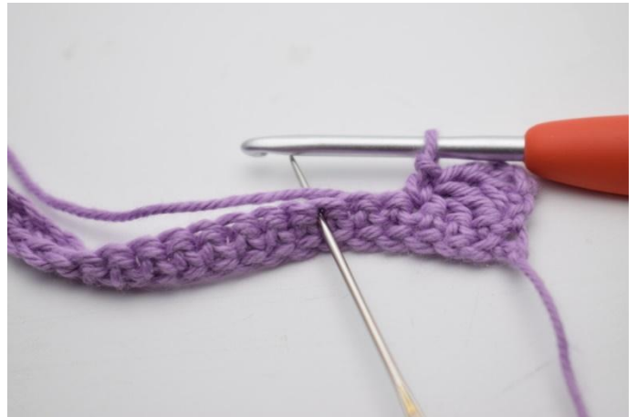
6. 2 M überspringen.