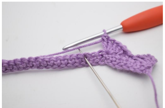
8. 2 M überspringen.