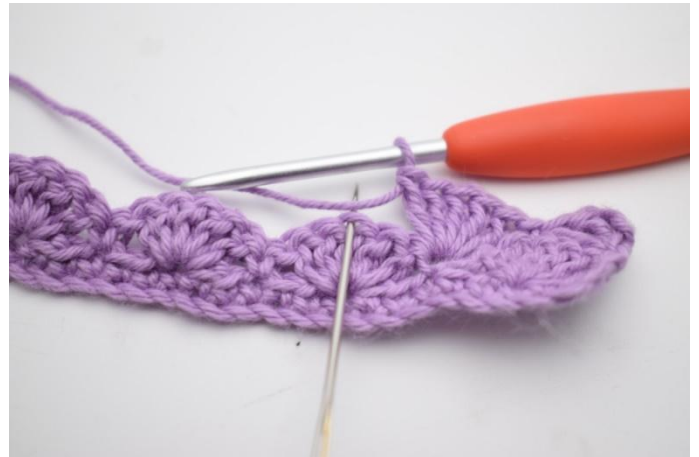
8. 2 M überspringen.