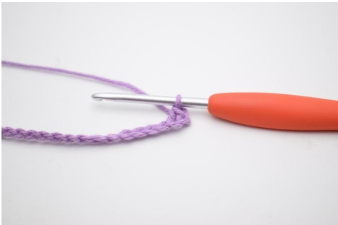
3. Genau so.