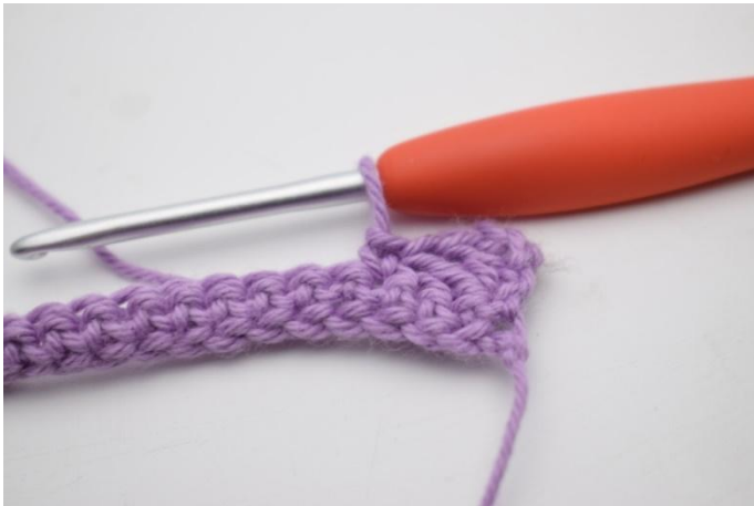
5. 1 fm in die nächste M häkeln.