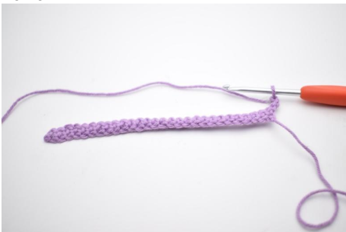
1. Mit 3 Lm wenden (ersetzen 1 Stb).