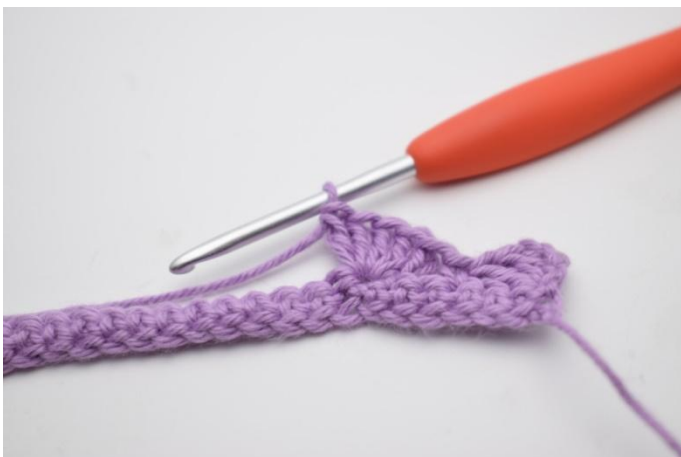
7. 5 Stb in die nächste häkeln.