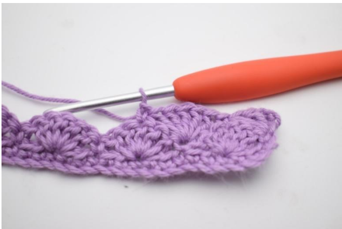
9. 1 fm in die nächste häkeln m.