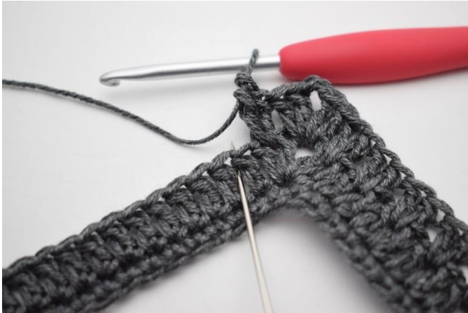
11. 1 m überspringen und 2 Stb zwischen die nächsten 2 Stb häkeln.