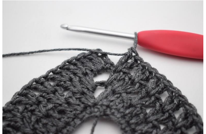
8. *2 Stb zwischen die nächsten 2 Stb, 1 m überspringen*. Von* bis * insgesamt 36 mal wiederholen.