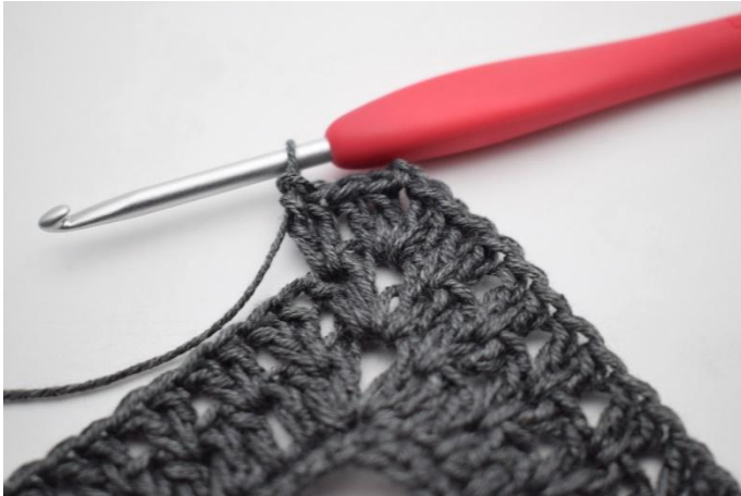
7. Genau so.