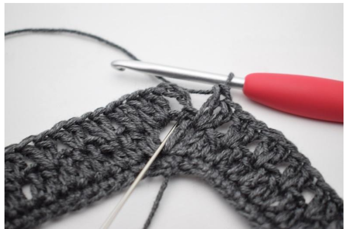
14. 1 Stb in den Lm-Bogen vom Anfang der Runde häkeln.