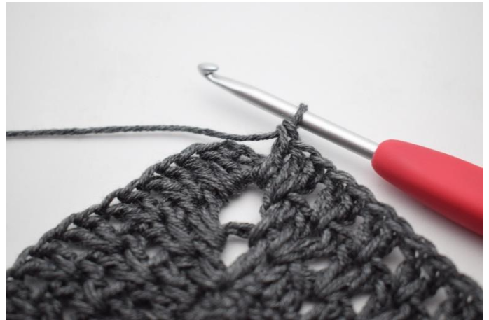
10. Genau so.