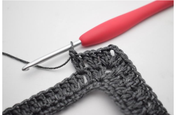
12. Genau so.