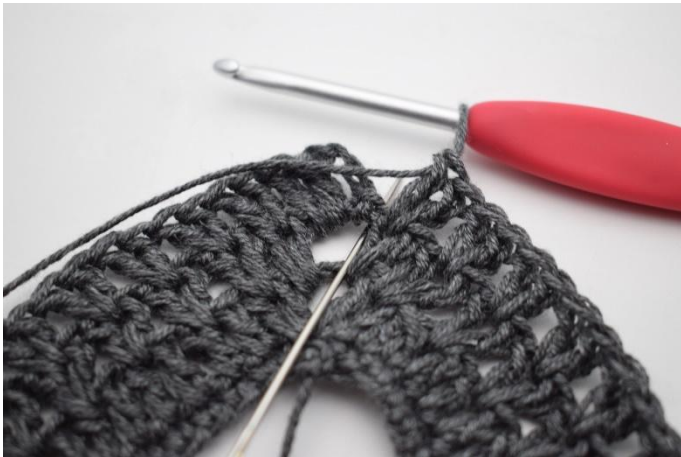
9. 1 Stb in den Lm-Bogen vom Anfang der Runde häkeln.