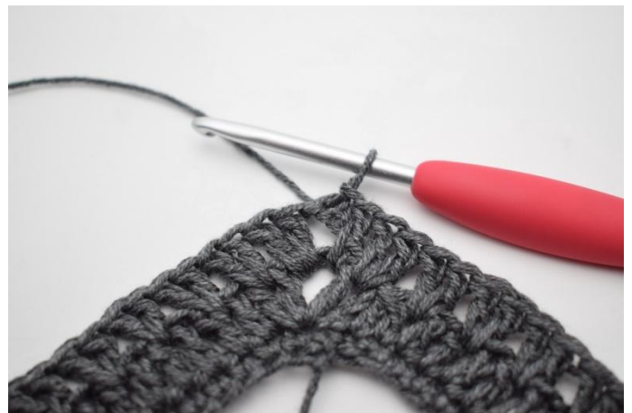
16. Mit 1 km abschließen.