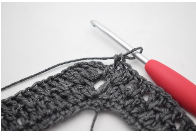
15. Genau so.