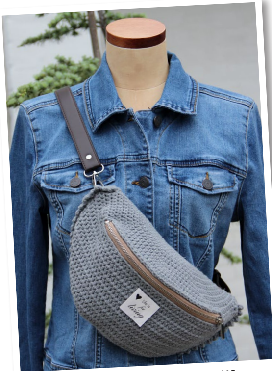
Abmessungen: 28 x 16 x 10 cm/Cosy 125 g. Reißverschluss: 25 cm. Relativ locker mit Häkelnadel Größe 4,0 mm häkeln. Einfachen Fadens: 16,5 hStb/10 cm.

Obwohl eine Tasche mit der gleichen Häkelnadelgröße gehäkelt wurde, kann die Endgröße deutlich unterschiedlich von einer anderen Tasche sein, die mit derselben Häkelnadelgröße hergestellt wurde. Der Häkelstil (fest oder locker) beeinflusst das Endergebnis in erheblicher Weise.